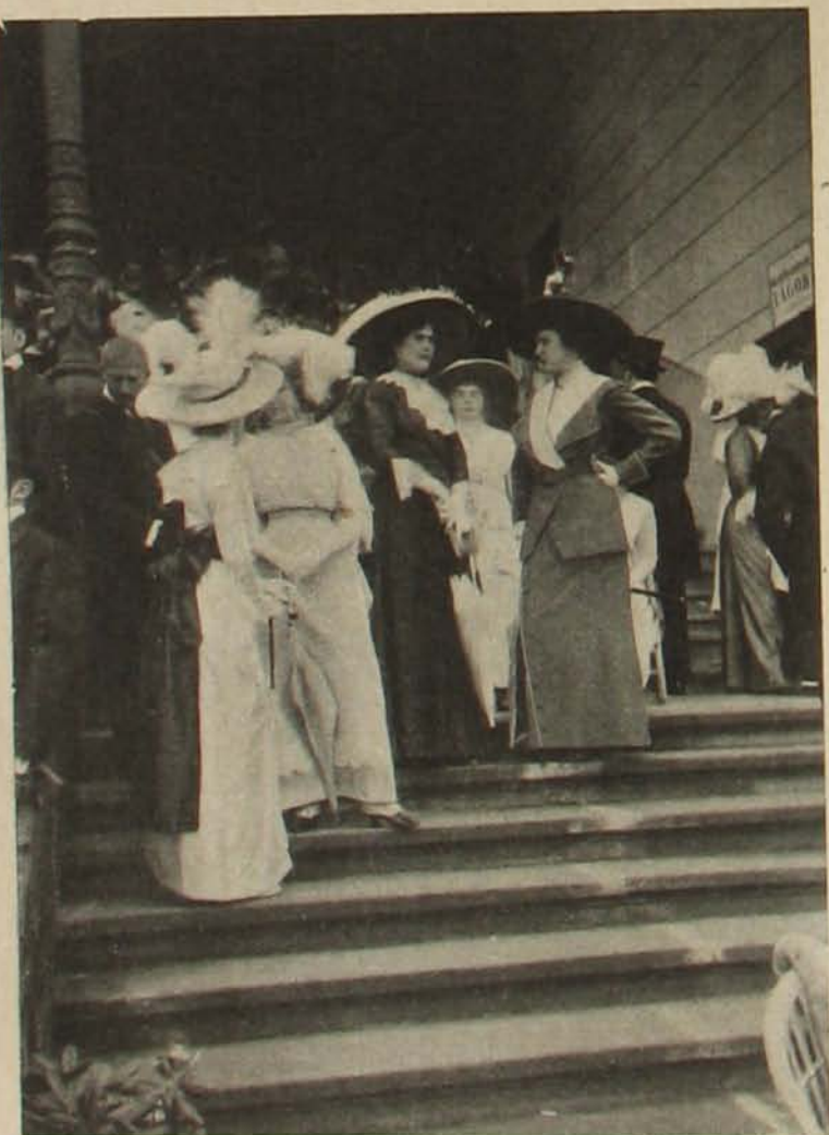
Hölgyek a nagy tribün lépcsőjén.