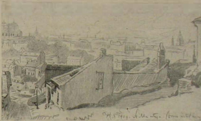
A vár az Arok-utcából nézve.