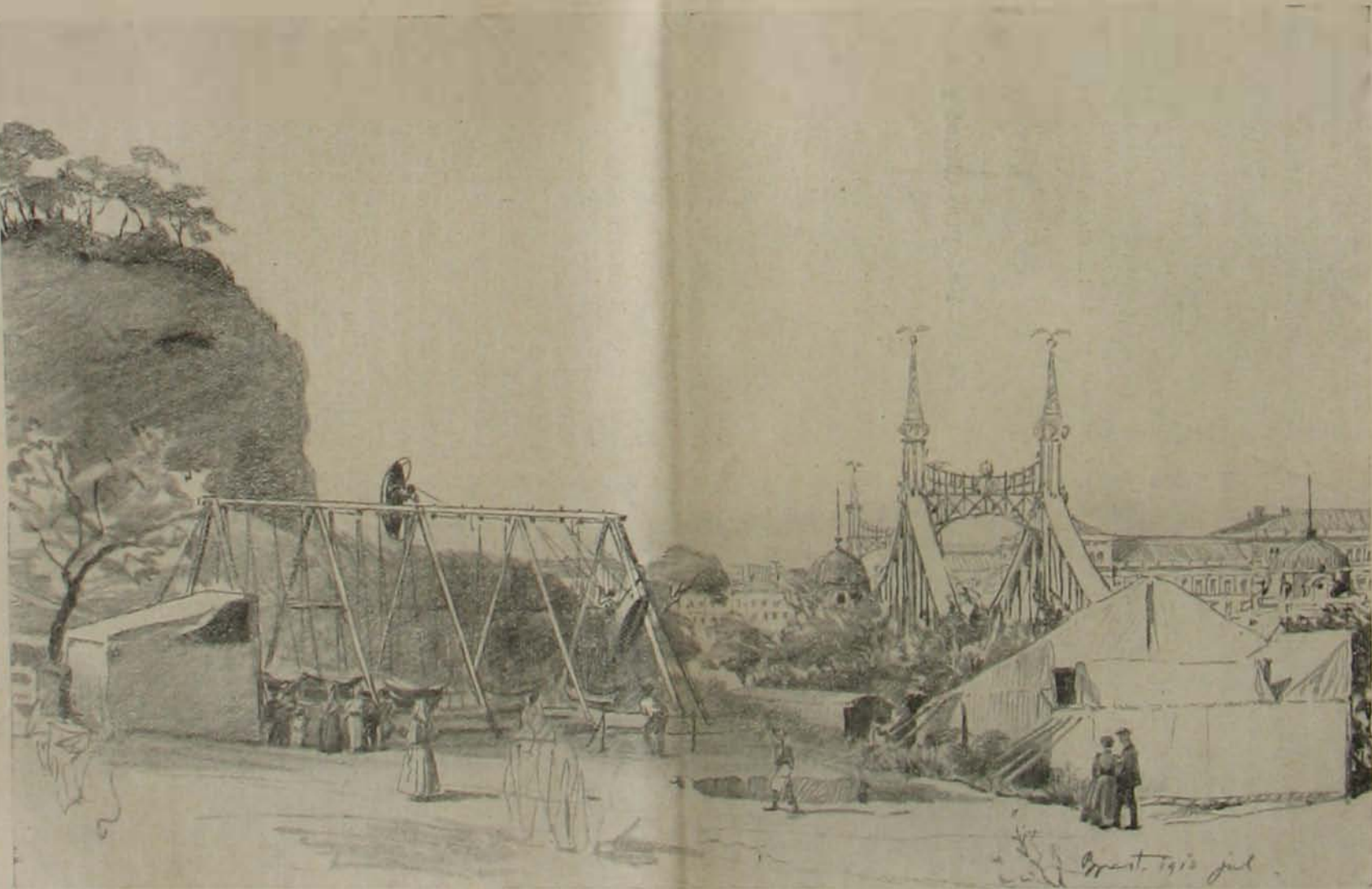
A Gellérthegy alján.