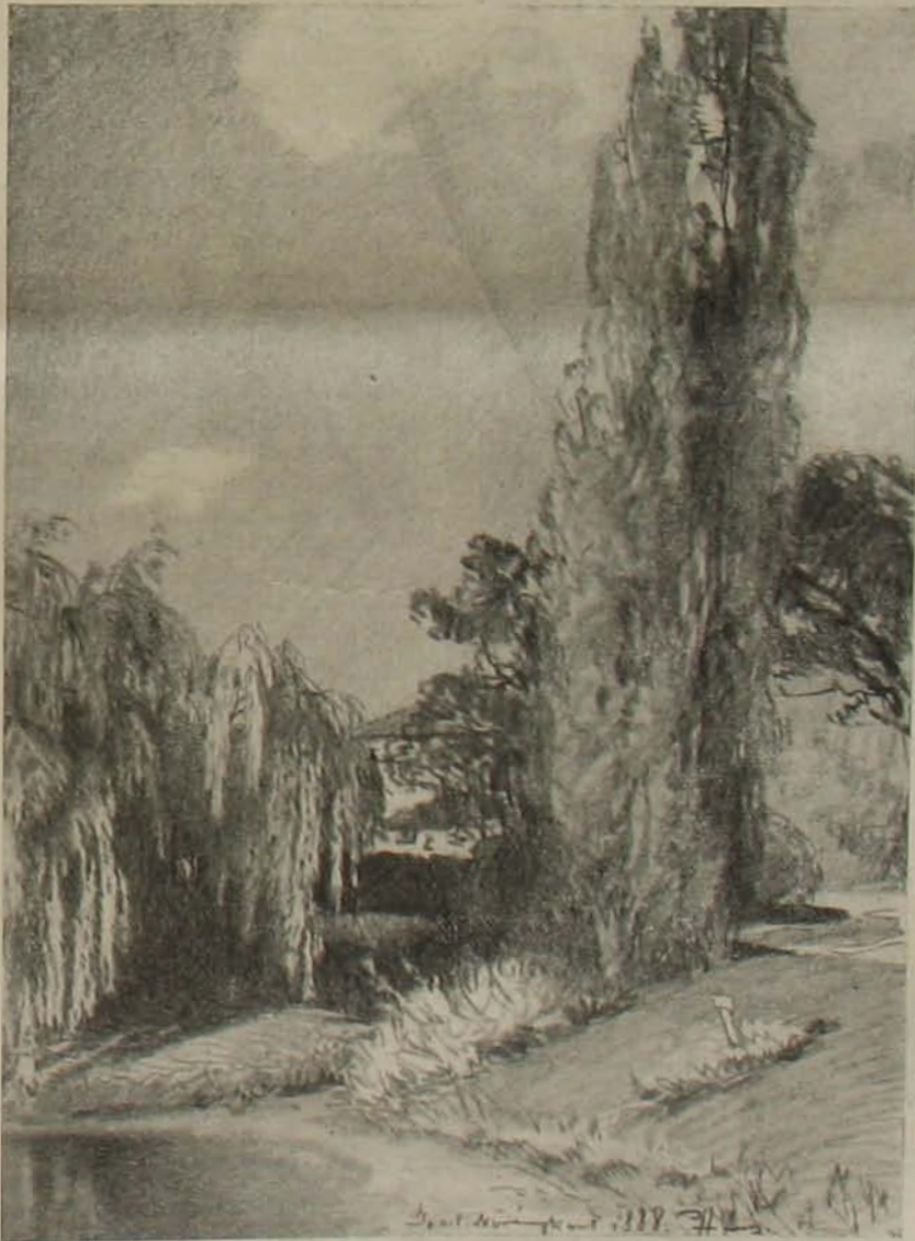
Képek Budapest eltűnő részleteiről. — Részlet a régi botanikus kertből.