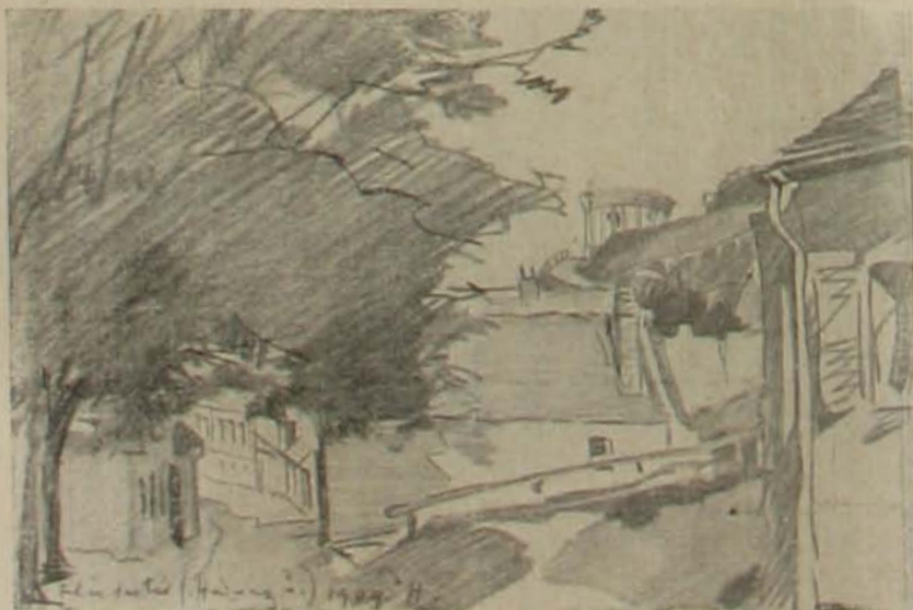
A hadnagy-uteza a felvérsas-térről.