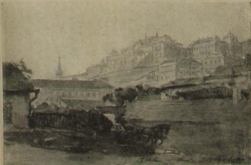
Kőpek Budapest eltűnő részleteiről.