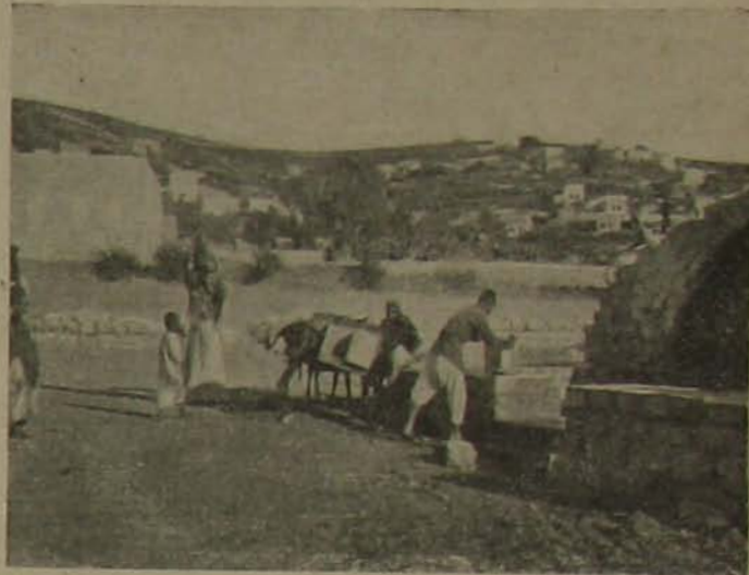
A Krisztus szülőtőlje ma : Názárethi képek. — 1. A Szent József barlang-műhelye fölött épülő templom. — 2. A Mária-forrásnál.

lái. a lengyelek közt. Ha mindenét elérvezetik is, ha sovány földjén marha nem legel, gabona nem terem, a remény még akkor sem hagyja el, — talán sóbányára akad, gyár épül, háború tör ki s újból meggazdagodhatnak.