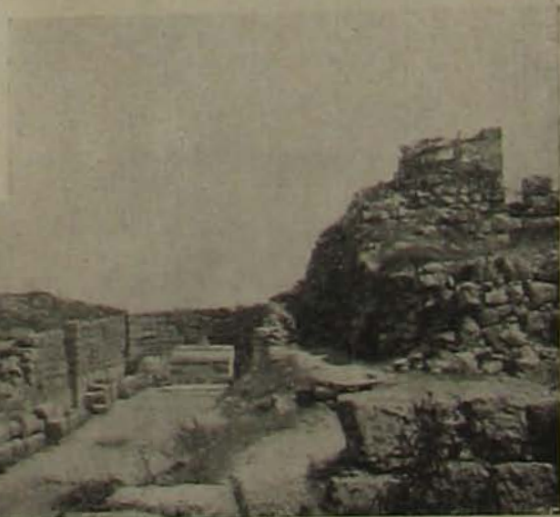
Krisztus szülőkölde ma: Názárethi képek. — 1. A magyar keresztések által megostromolt bástya a Tábor-hegyen. — 2. Názáreth látképe. — 3. Mohamedán mecset. — 4. A kinyilatkoztatás temploma. — 5. A keresztos templom és a kastély romjai a Tábor-hegyen.