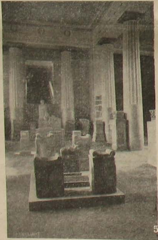
Lapidarium; az előtérben ott áll a jagod-törzs (Bosznia örökös) Bihac mellett feltárt szentélyéből.

Bosznia és Hercegovina területe addig az ideig, míg az okkupáció révén felügyeletünk alá nem került, történelmi és természetrajzi kutatás szempontjából jóformán ismeretlen volt. Maga a lakosság el volt nyomva, nélkülözötte az általános műveltséget is, multjával ez okból mit sem törődött. Az általános rossz közlekedés és az elrettentő közbiztonsági állapotok pedig távol tartották innen az ez iránt érdeklődő idegen tudósokat.