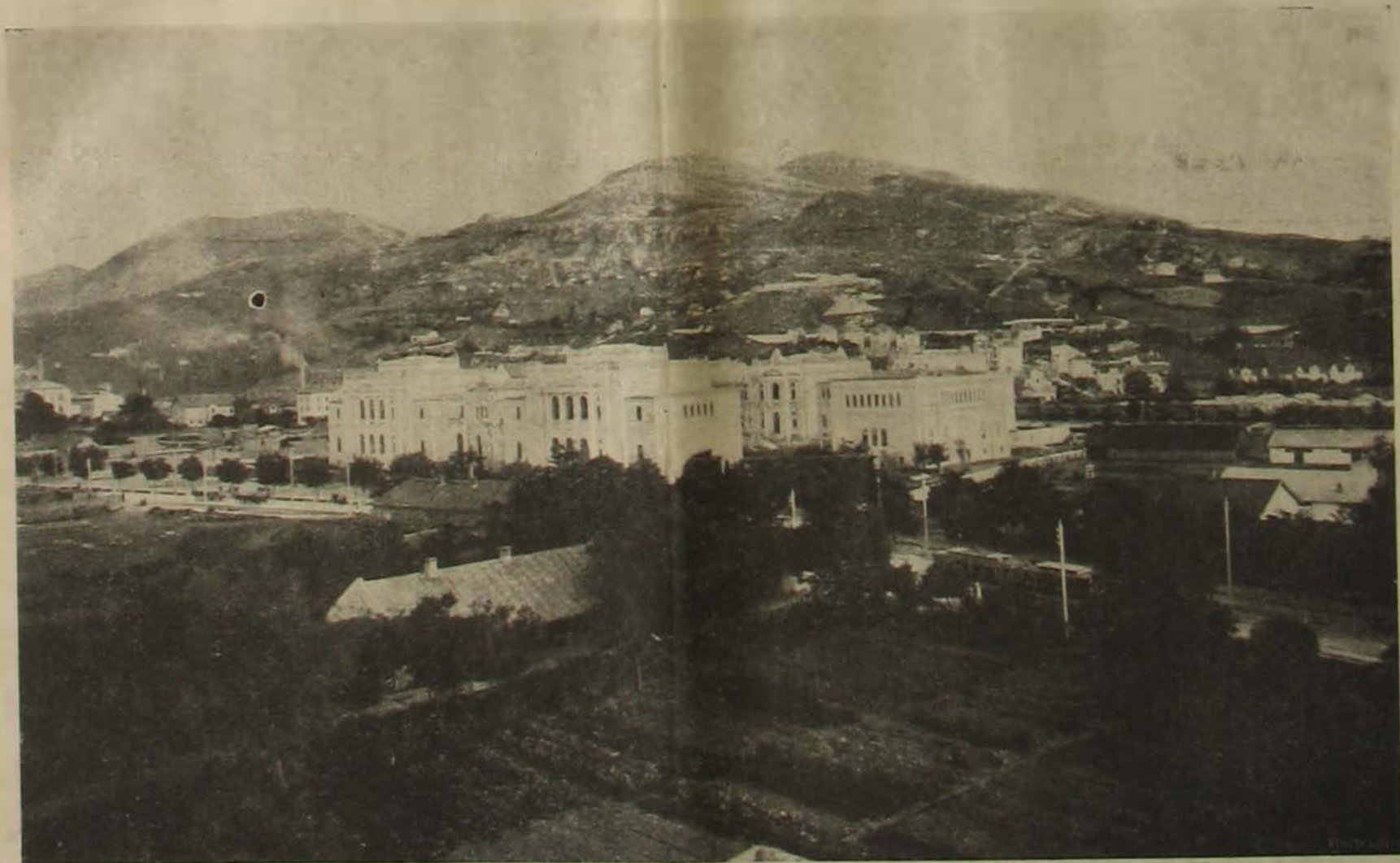
A szerajevói országos muzeum új épületei.