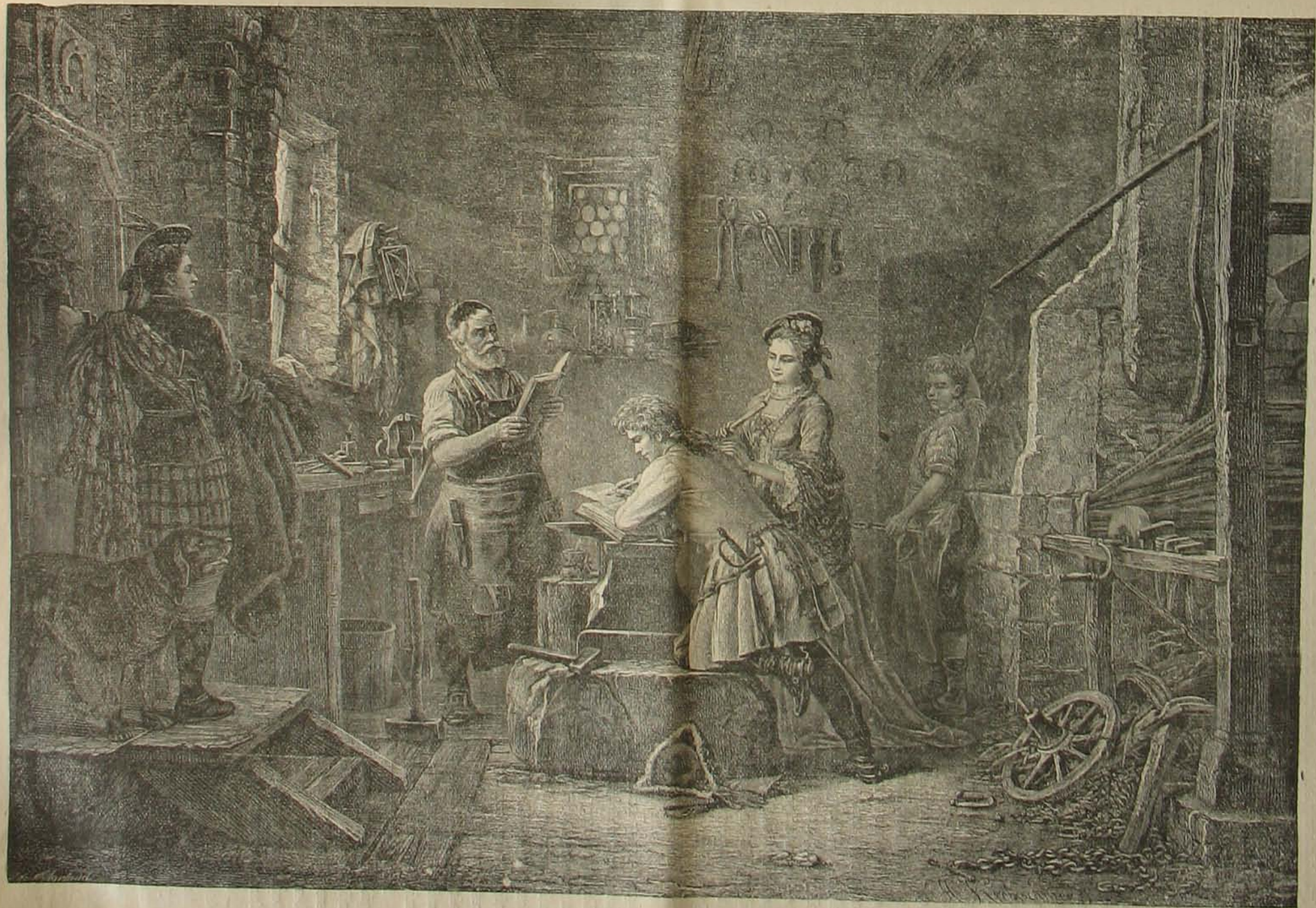
Skót polgári házasság Græna-Greenben.