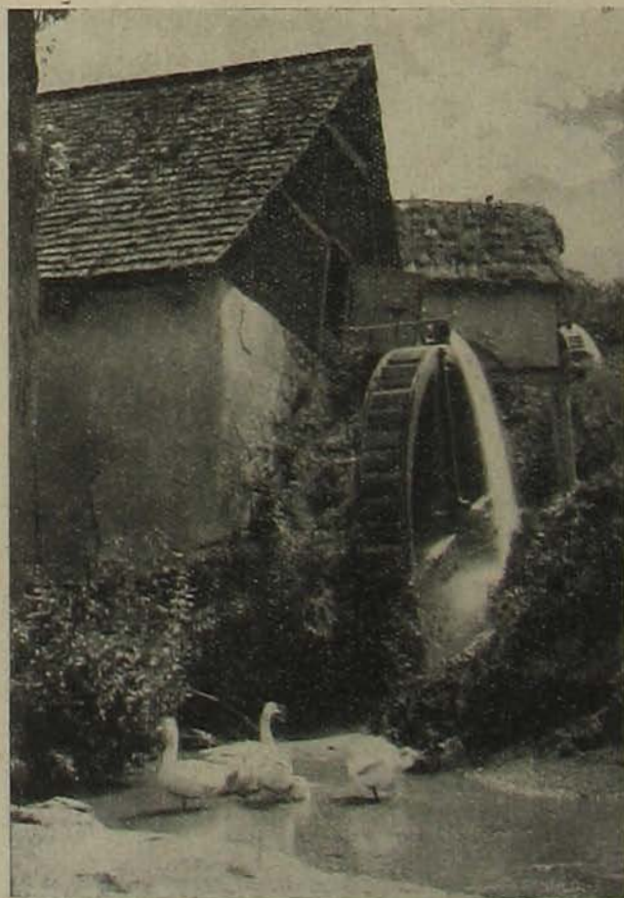
Vizes malom a borsodmegyoi Apátfalván.