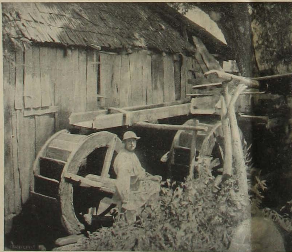
Oláh felülesapó vizimalom Hunyadmegyében.