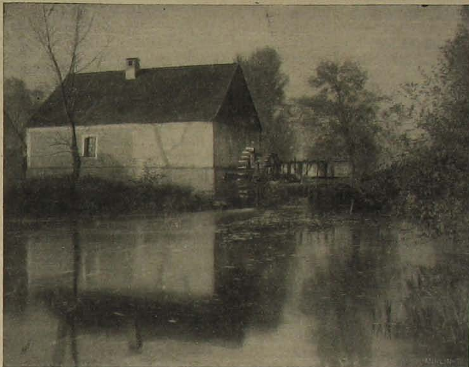
Régi malmok. — Keszthely-vidéki vízimalom.