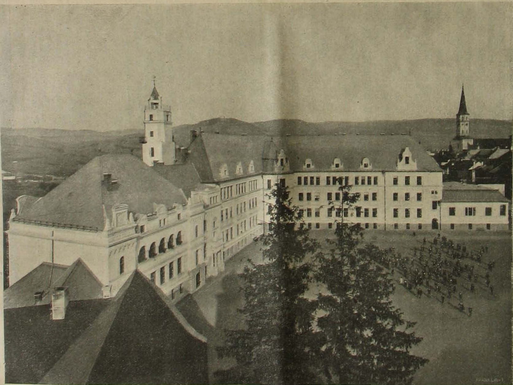
A lőcei főgymnázium új épülete az udvar felől.