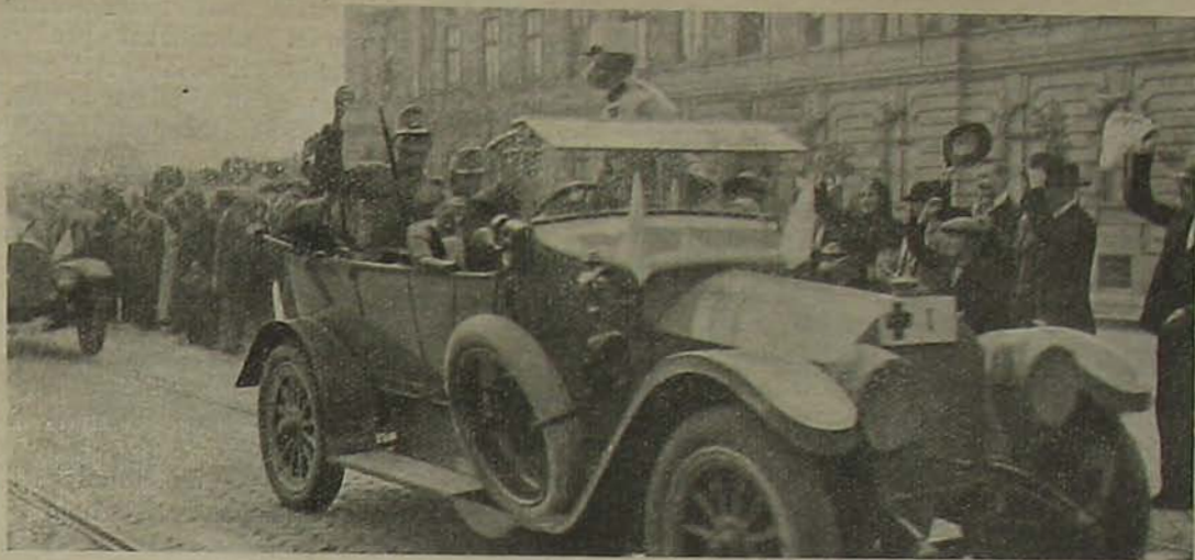
Háborus élet. — A sebesültek vidáman fogadják a közönség éljenzését.