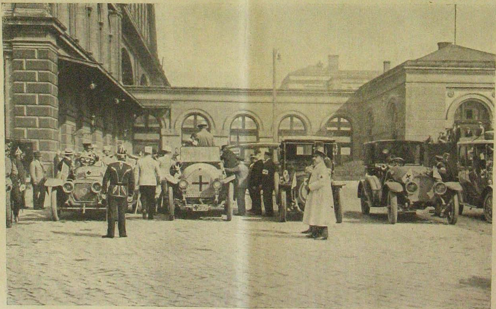
Háborús élet. — Sebésült-szállító autók a pályaudvaron.