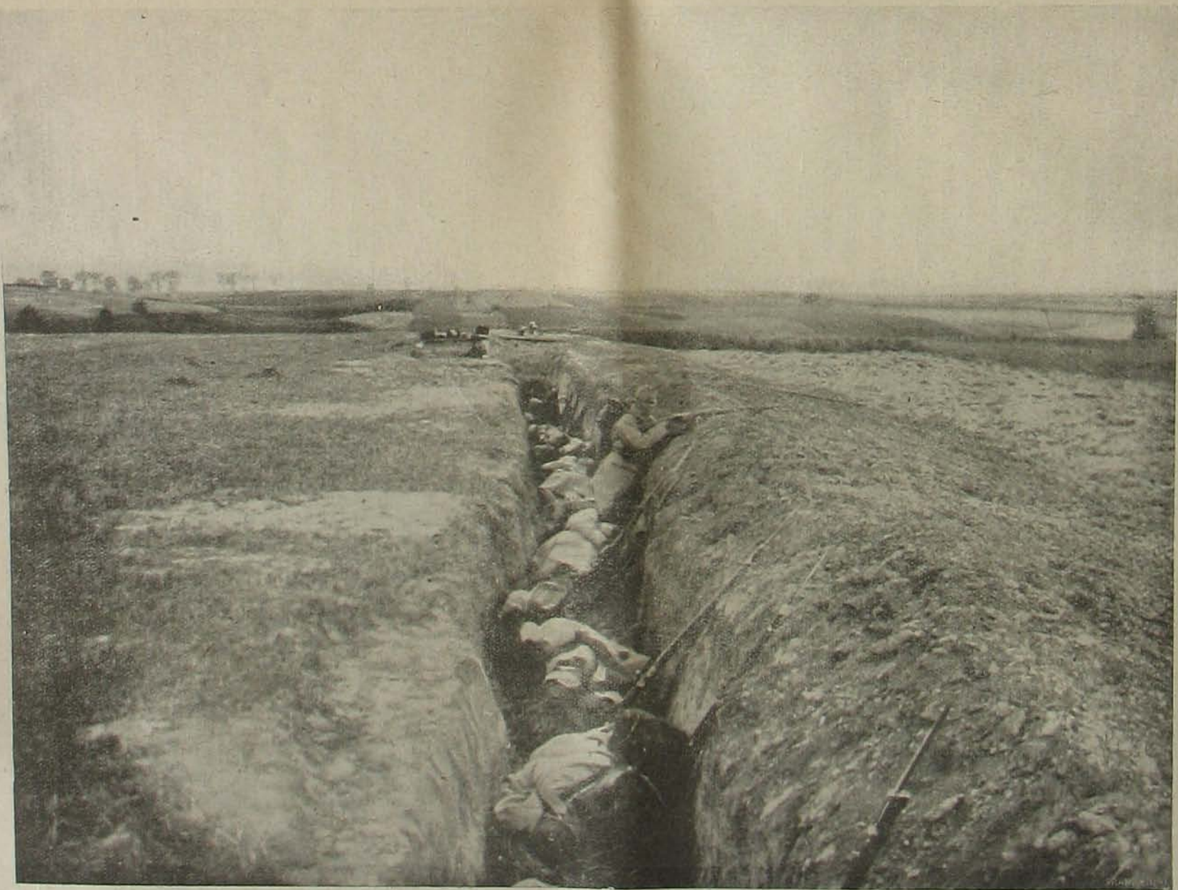
Harczíri képek. — A tűz-szünetet katonáink a vársra használják. (A lövészárokbau Lublin olótti.)