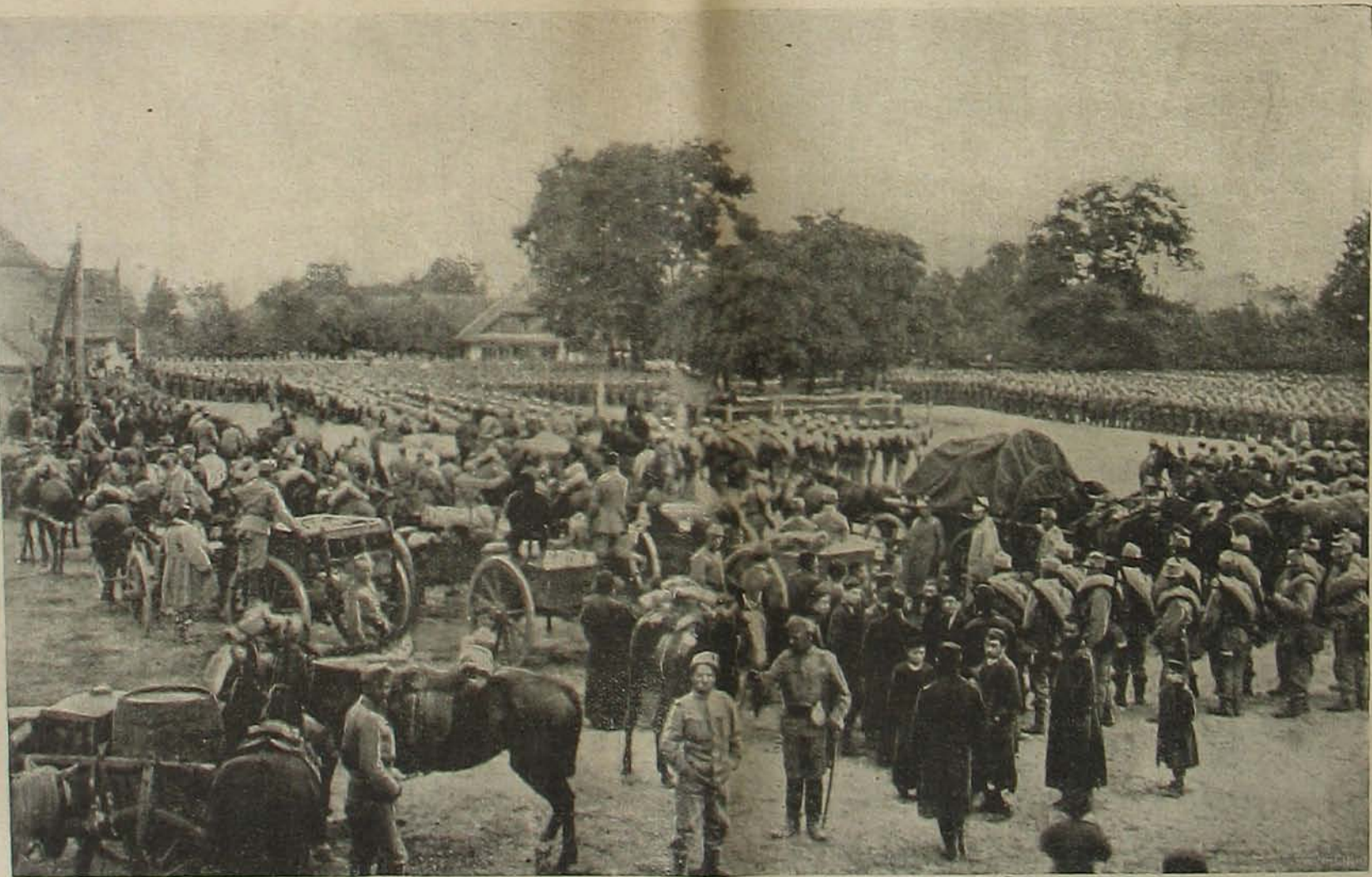
Harcztéri képek. — Egyik gyalogezredünk tábori mészéje augusztus 18-án, Franpolbau, Oroszországban.