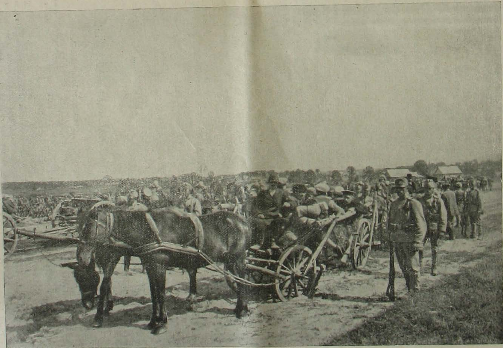
Harcztéri képek. — Katonáink csehszlovákiai tüzszokat szállítanak.