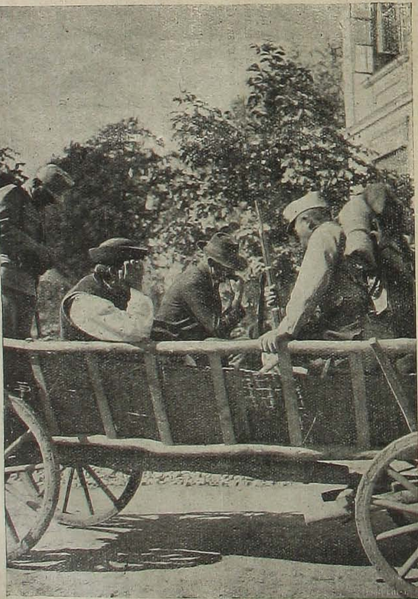
Galicziában elfogott gyanus alakok.