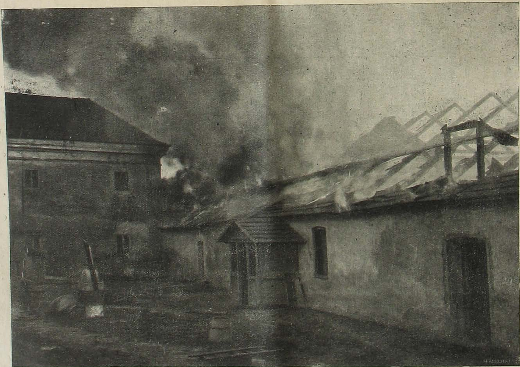
Harcztéri képek. — Kórnok által felgyújtott házak.