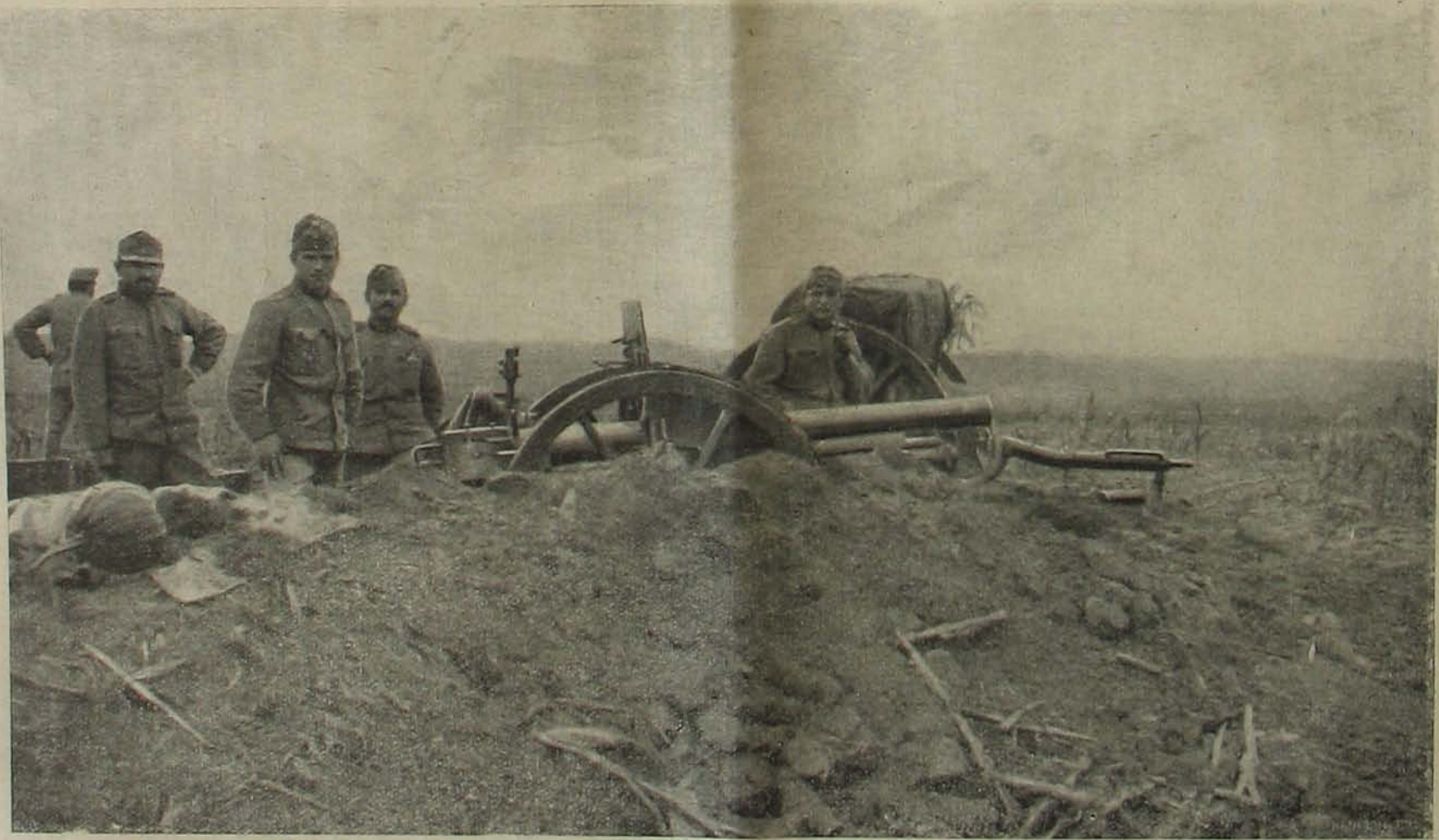
A szerbiai harcztérről. — Ágyúttog fedozékben.