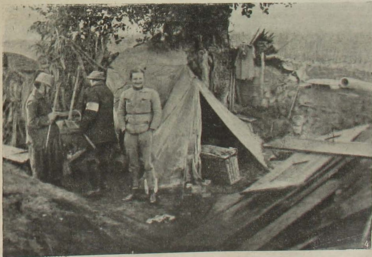
A szerbiai harcztérről. — 3. Pihenő. — 4. Űtegparancsnok sátra.