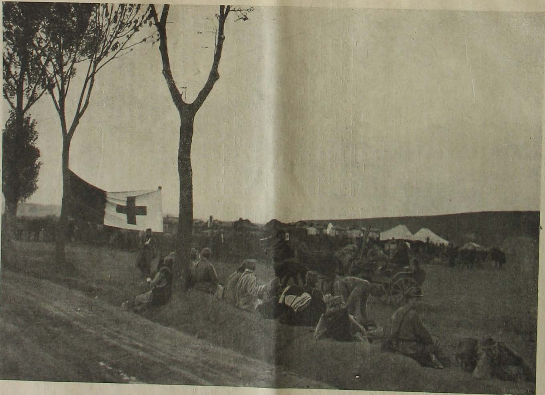
Az északi harcztérről. — Kötözőhely a segítőhely mögött.