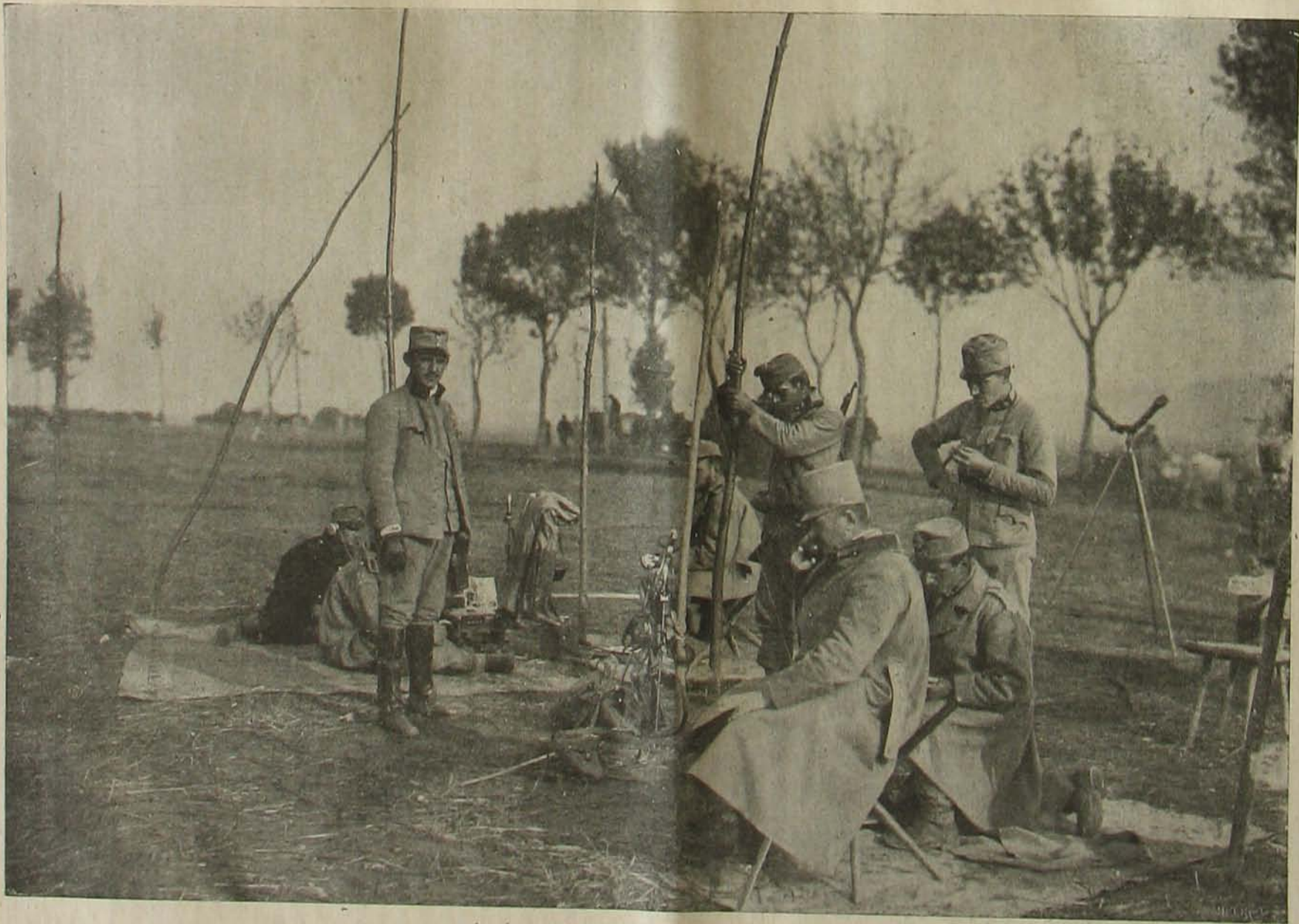
Az északi harcztérrel. — Törzs telefonja.