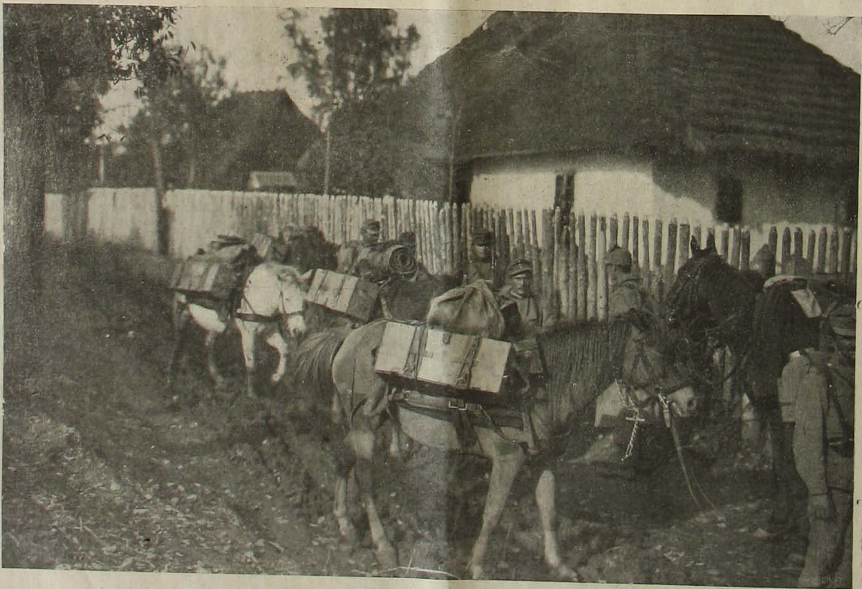
Az északi harcterről. — Műanyagok lovak seregében.