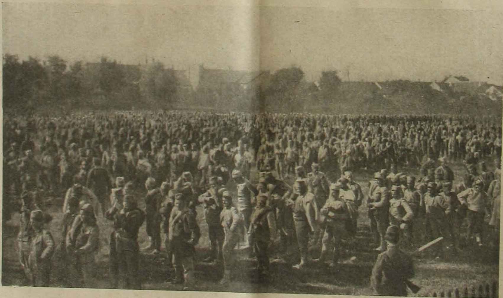
A szerbini harcterről. — Lefegyverzett szerb katonák elvonulása a magyar huszárok előtt.