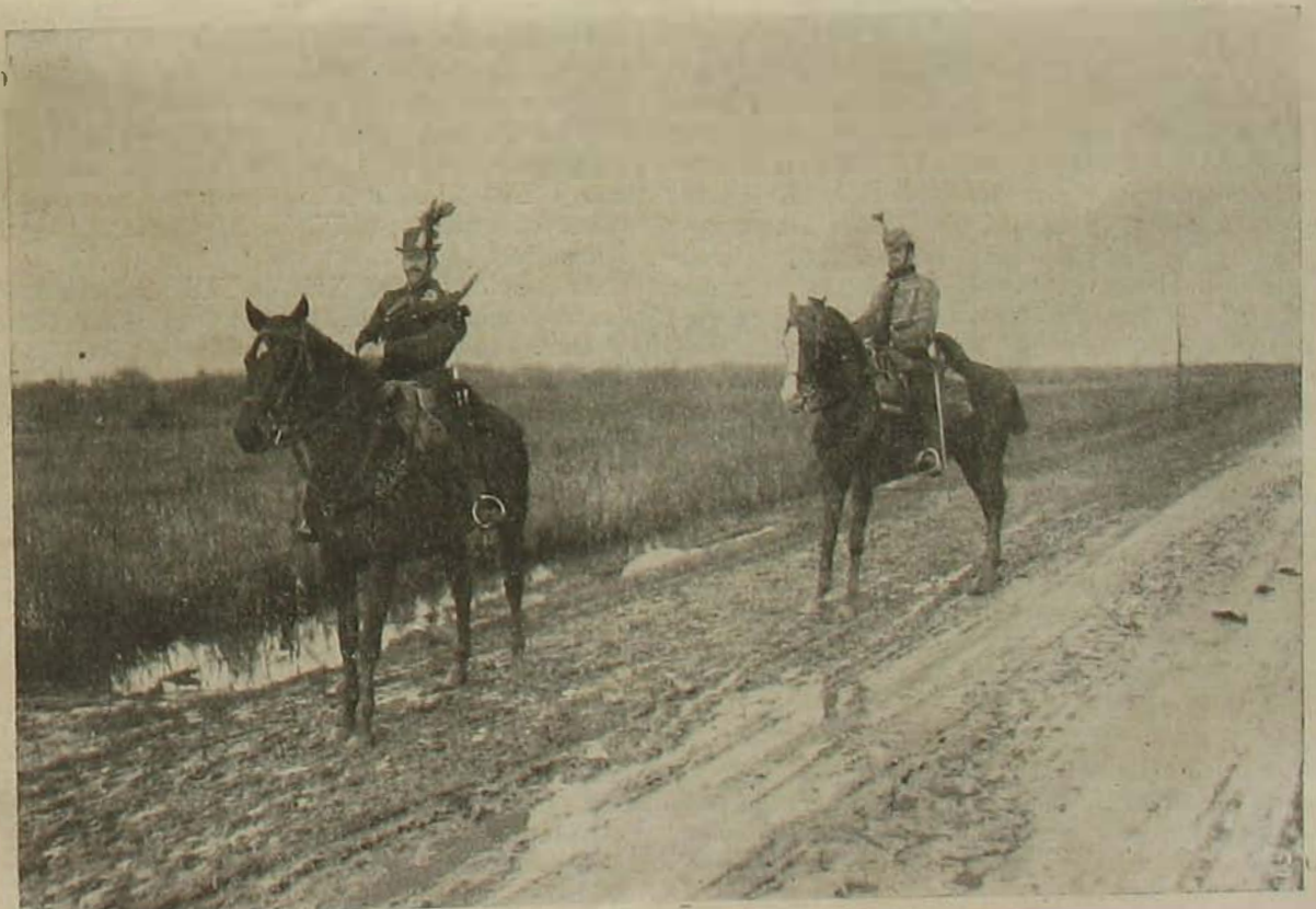
A szerblai harcztérről. — A mitroviczai összelőtt szerb vámépület. -- Magyar csendőr és huszár-júrőr szerb területen.