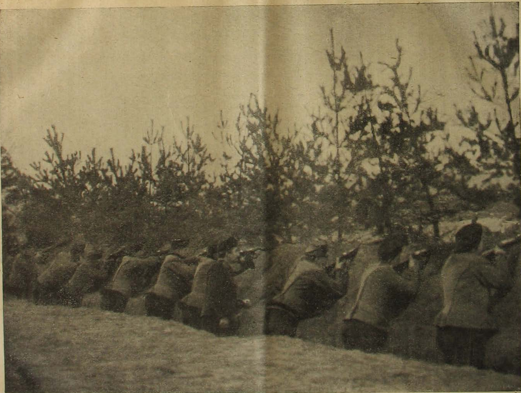
Gyalog harcoló magyar huszárok, fenyőágakkal fedett lövészúrokban.