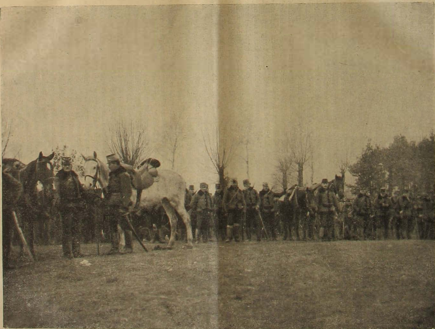
Magyar huszárok a tűzvonal mögött egyik orosz-longyelországi harcmezőn.