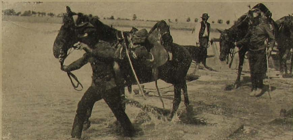
Honvédjárőr átkelése egy folyón.