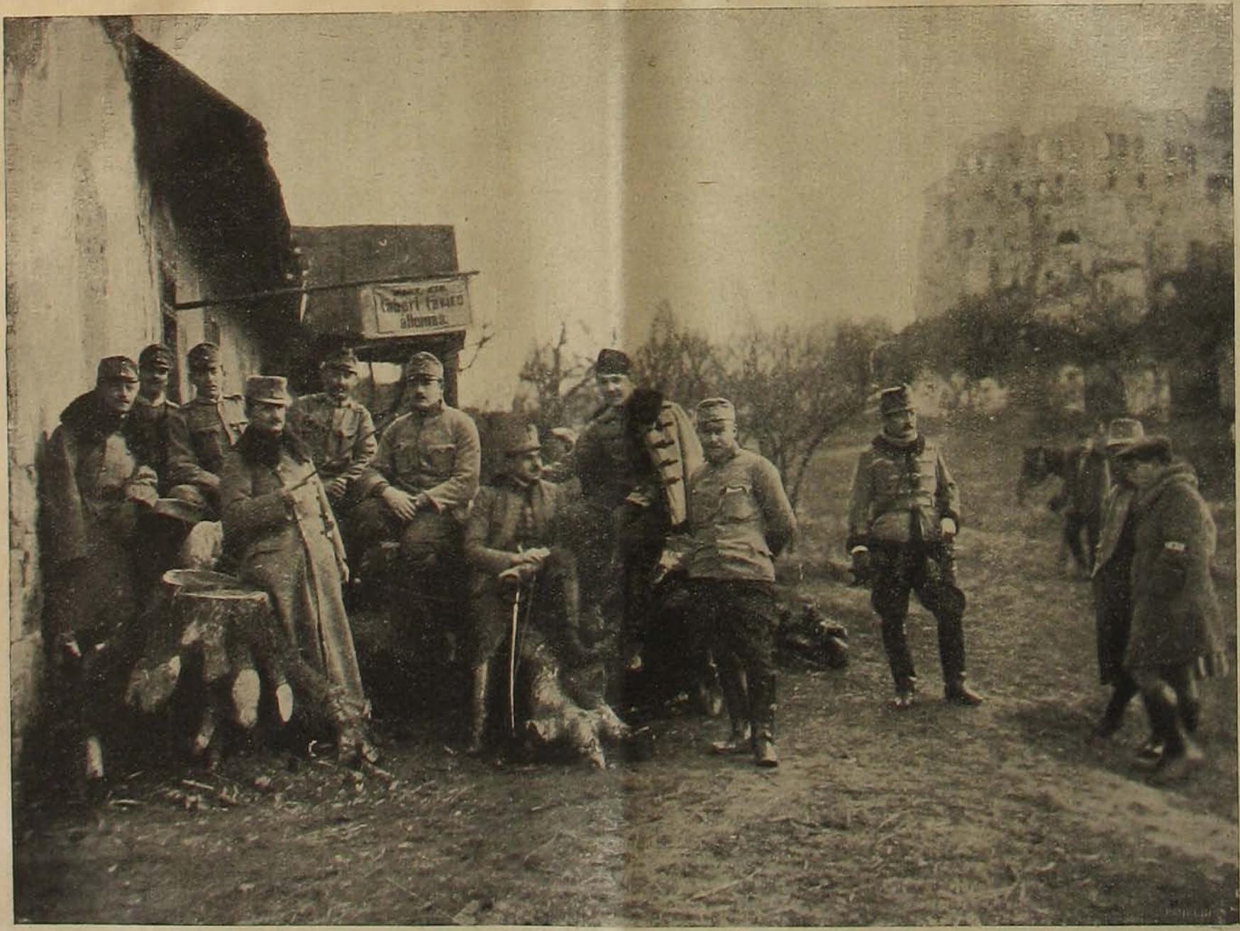
Egy magyar népfelkelő dandár törzskara Orosz-Lengyelországban.