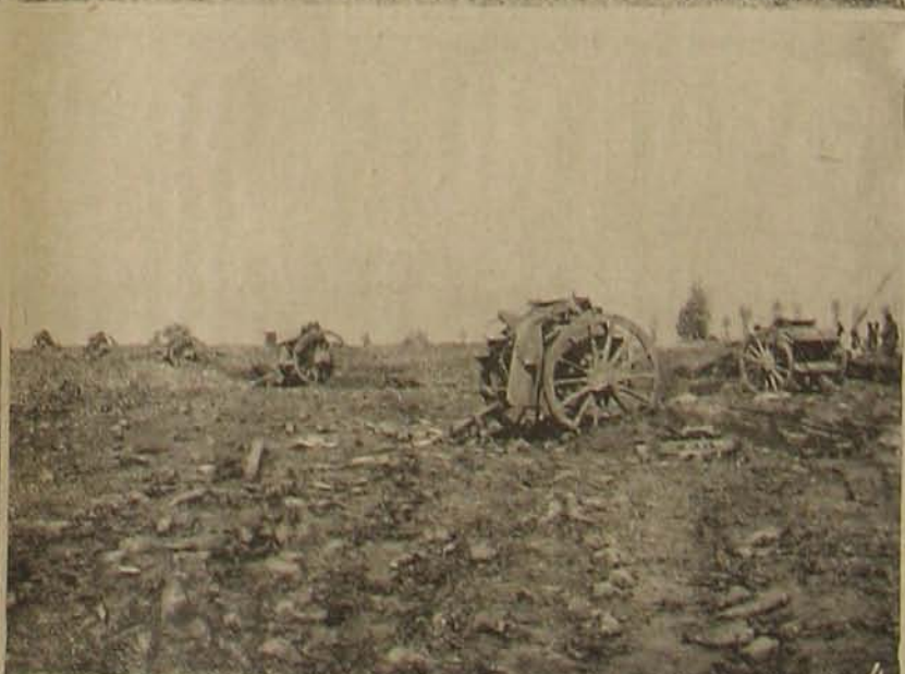
A háborús országokból. — Katonák át szállítása a folyón. 2. Visszatérő menekültek. — 3. Egy 30 és feles. — Elhagyott orosz útegek.