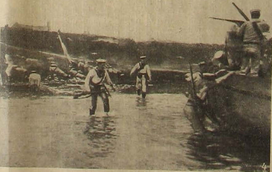
A háborús országokból. — 1. Batum. — 2. Cyprus szigete. — 3. La Havre, a belga kormány székhelye Franciaországban. 4. Angolok az Ysermenti harcokban.