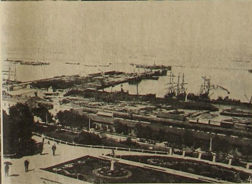
A háborus országokból. 1. Dover kikötője. — 2. Calais Angliához legközelebb eső része. — 3. Szobasztopol. — 4. Odessza.