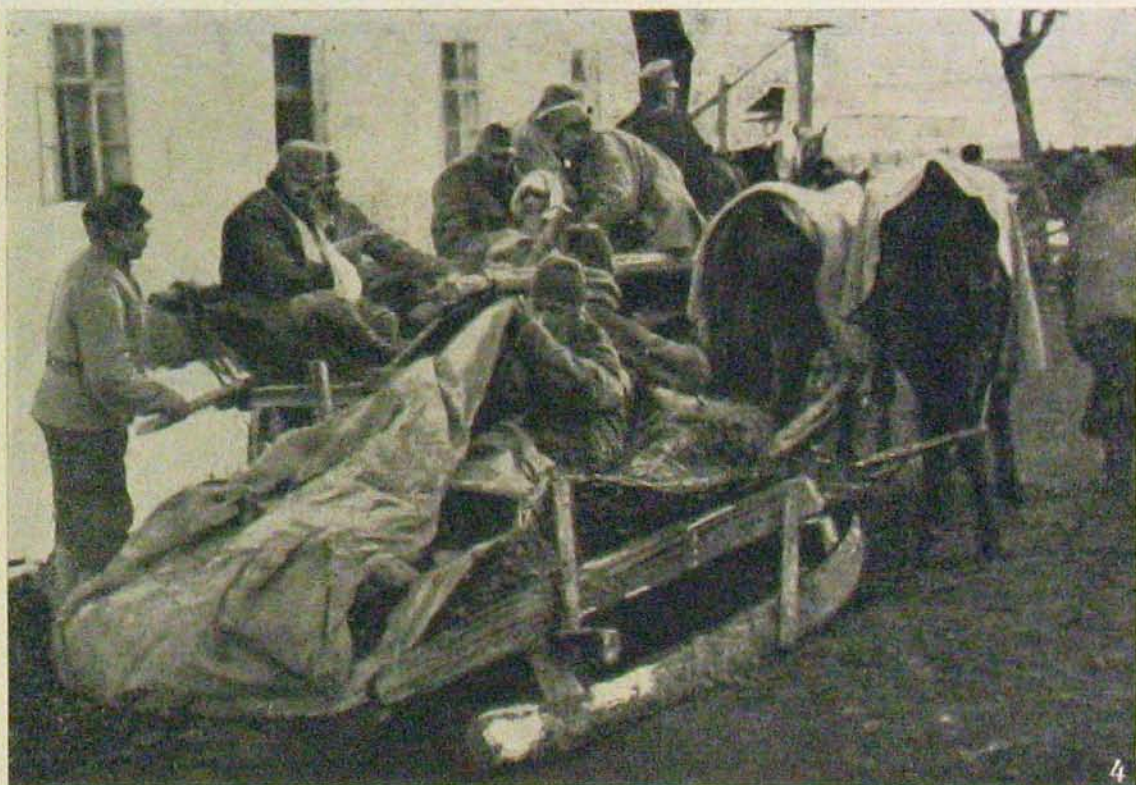
A bukovinai harczokból. — Román parasztaasszonyok Kirlibabán. — Sebesültek szállítása Jakobeniben.