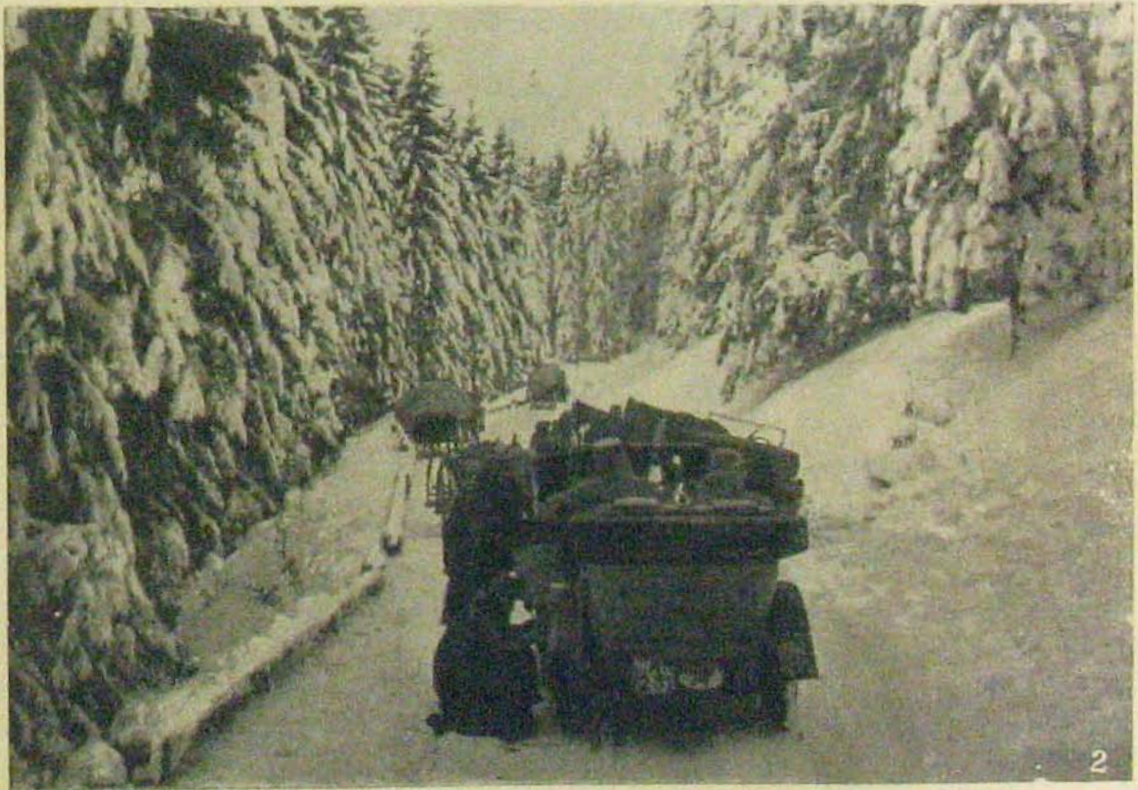
A bukovinai harezokból. — Trón Kirlibabáa. — Szemlélt a szorosokban.