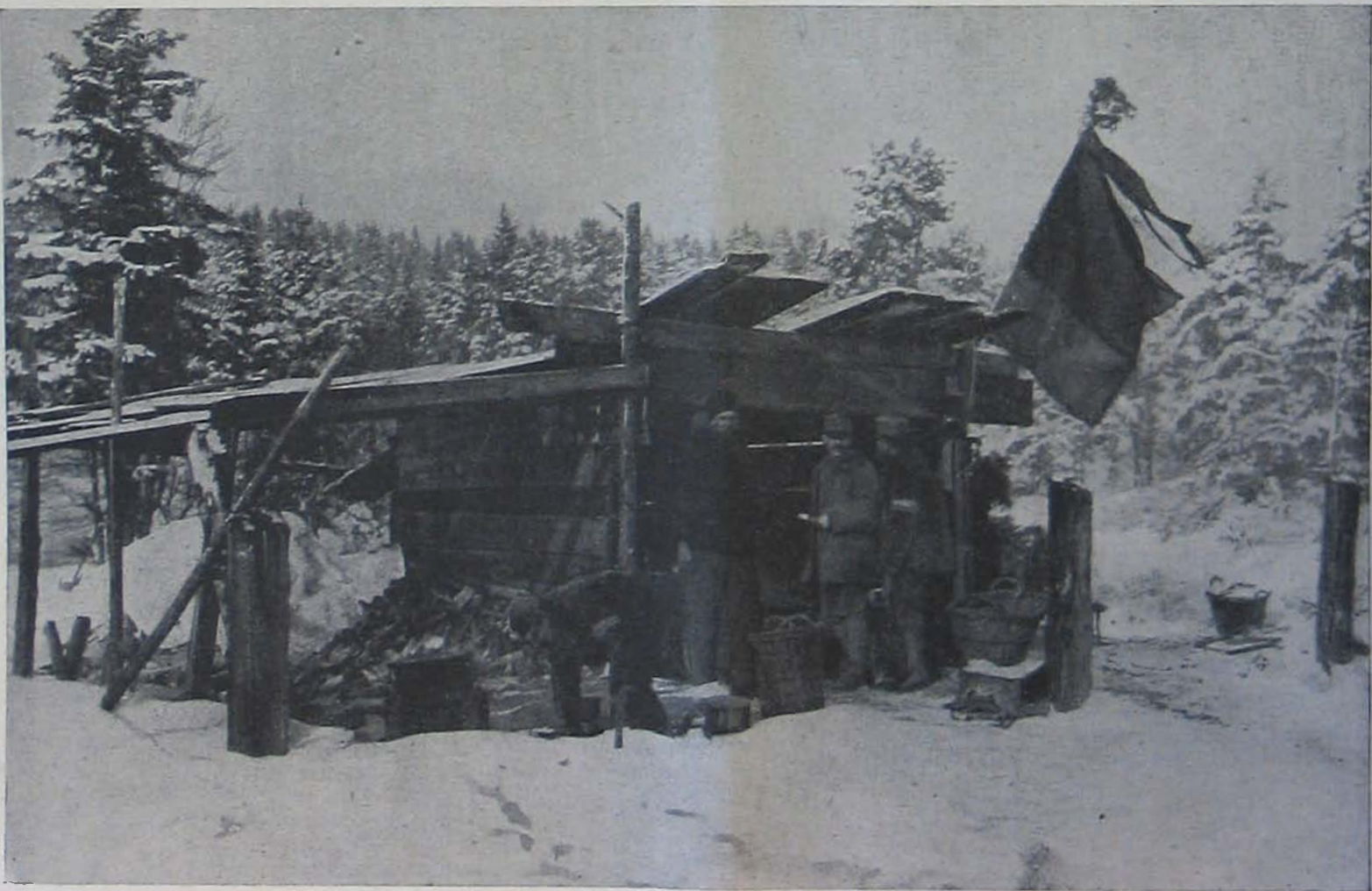
Az északi harctérről. — Tábori konyha az erdőben, német lobogóval.