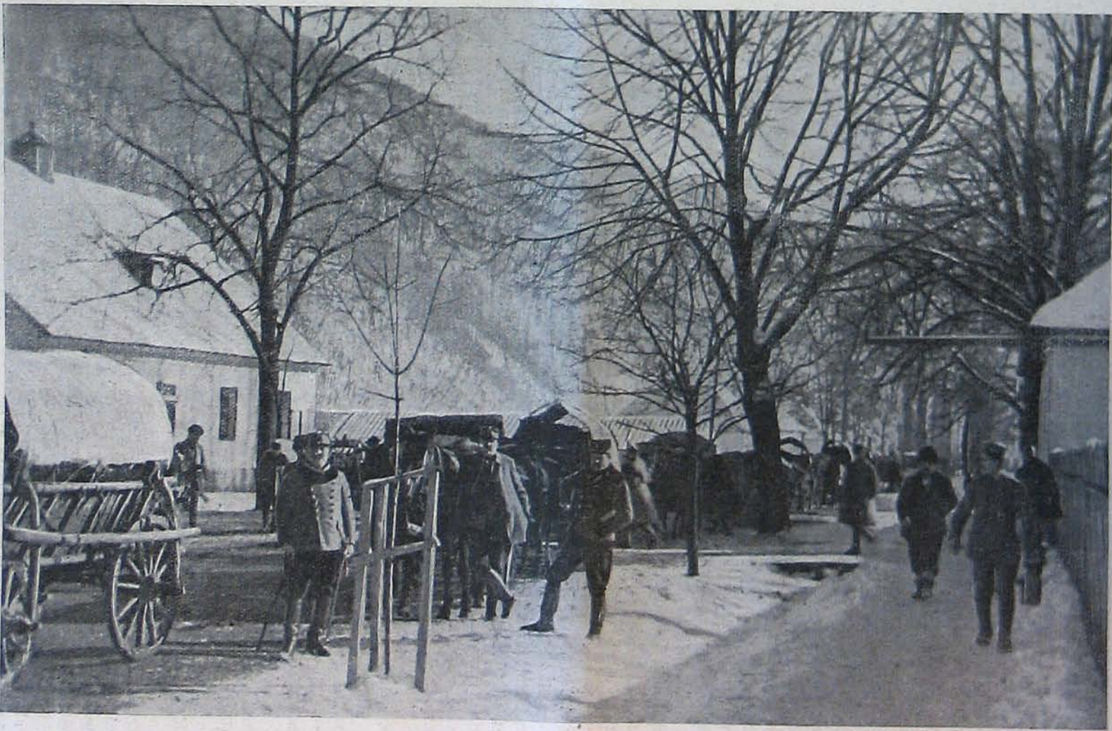
Az északi harctérről. — A train megérkezése.