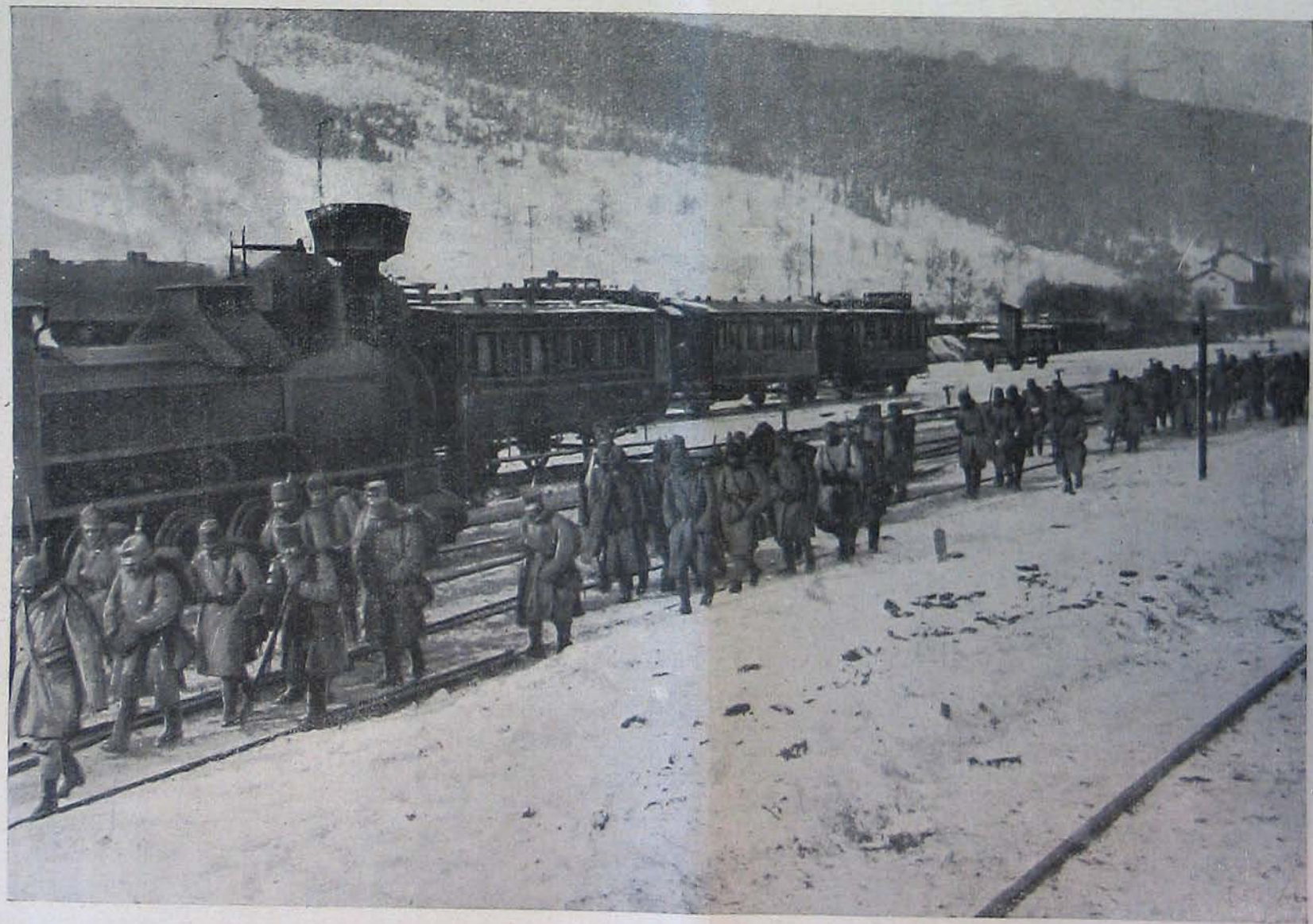
Az északi harctérről. — Csapatfelváltás egy vasuti állomáson.