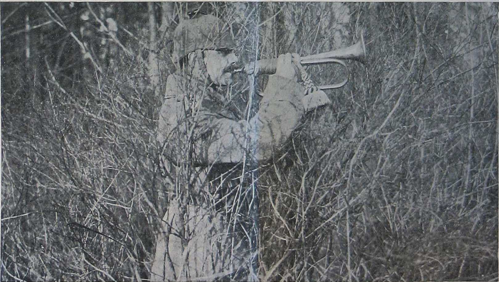
Az Argonneokban. — Német katona trombitával jelet ad.