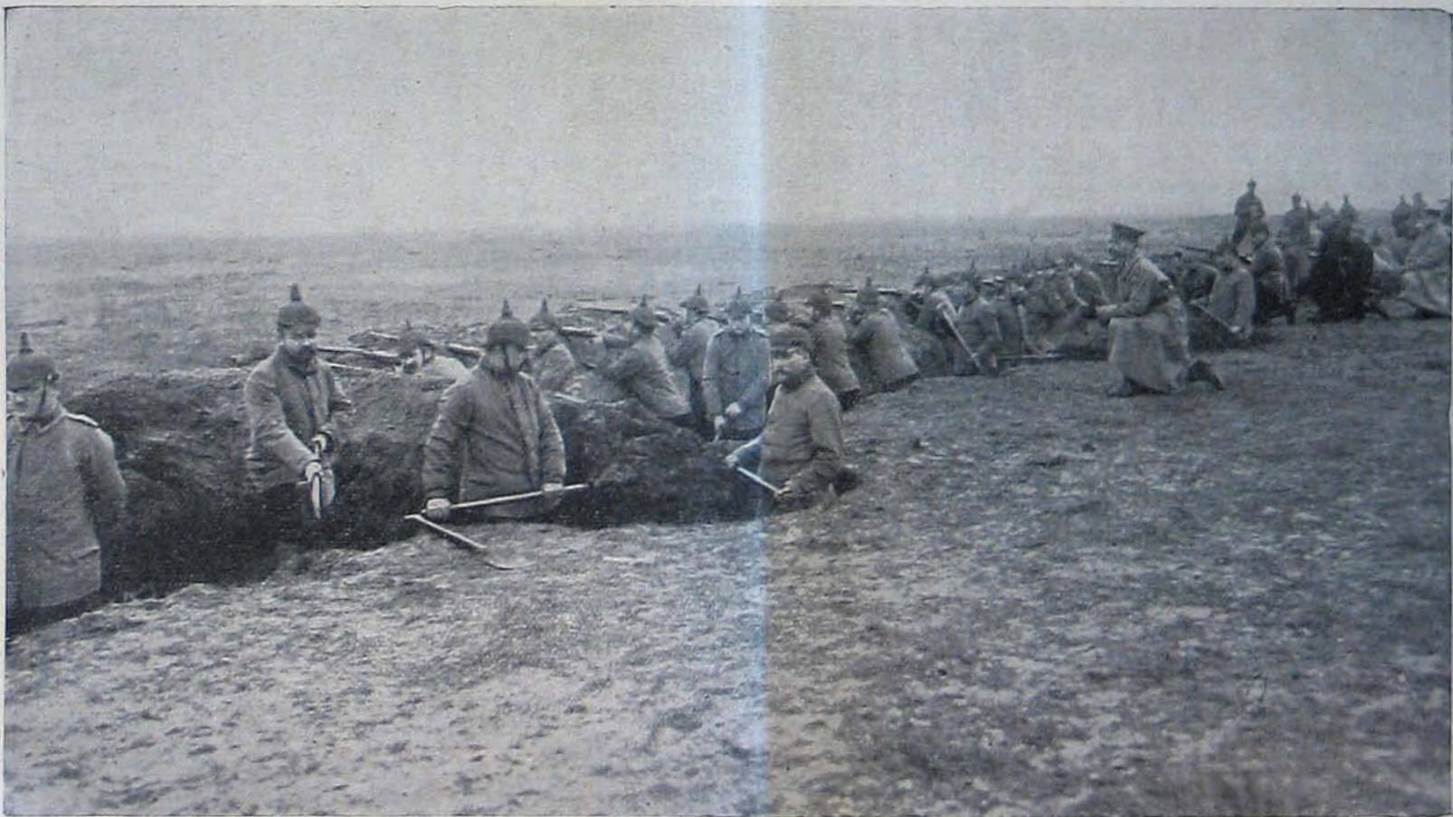
A nyugati harctérről. — Német katonák futó-árkokat ásnak, a melyeken át a lövész-árkokba lehet jutni.