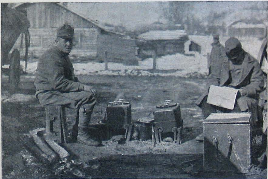
Az északi harsztérről. — Elfogott orosz gépfegyverek. — Főzőláda, melyet akkor használnak, mikor a közelben nincs konyha.