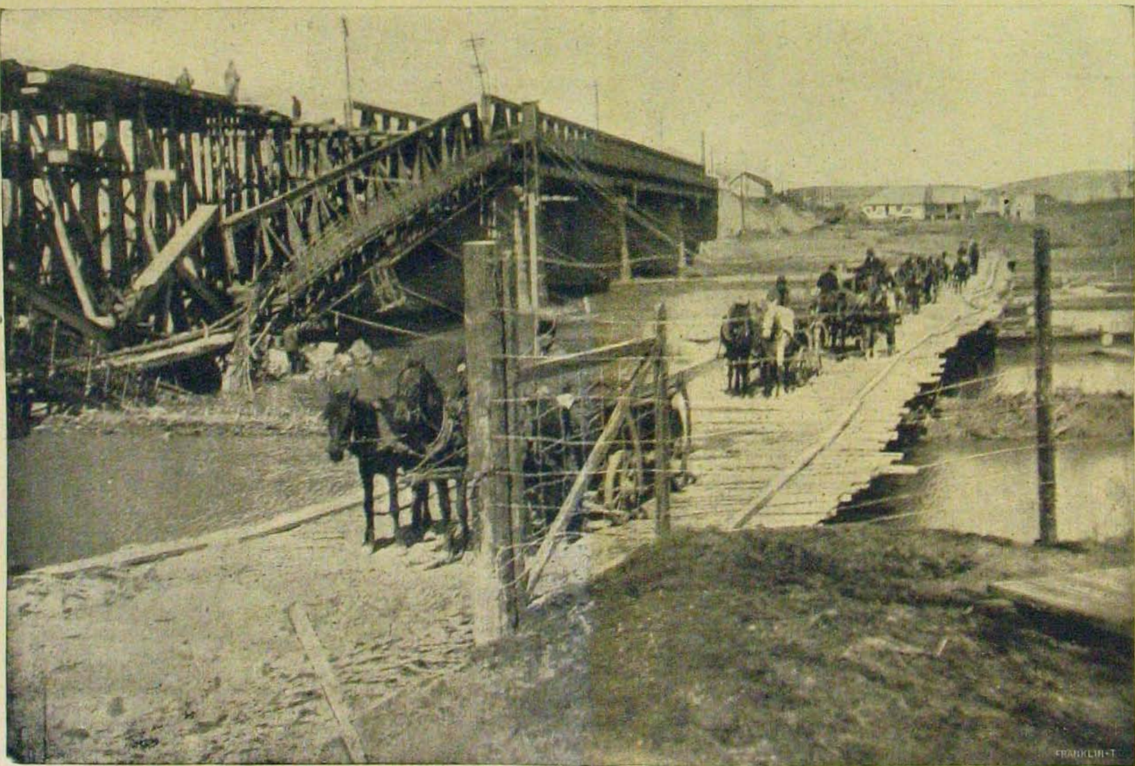
A bukovinai harcok színhelyéről. — Helyreállítás alatt levő fölrobbantott híd a Pruthon.