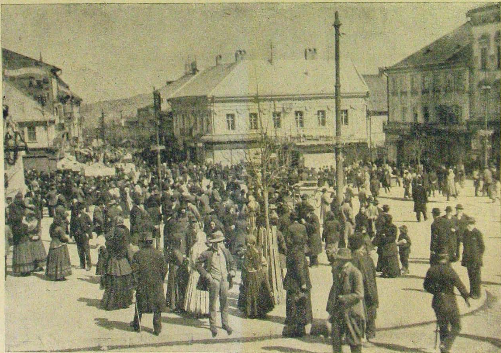
A bukovinai harezok színhelyéről. — Útcai látat Oseruovitz főterén.