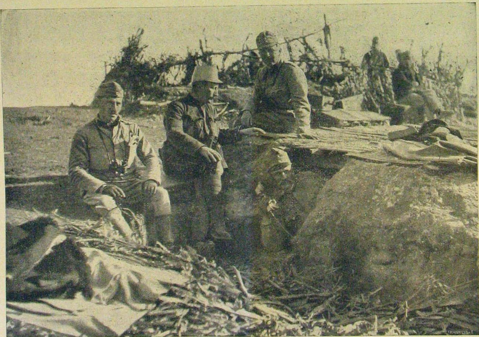
A bukovinai harcok színhelyéről. — Egy úgruüteg telefonfülkéje.