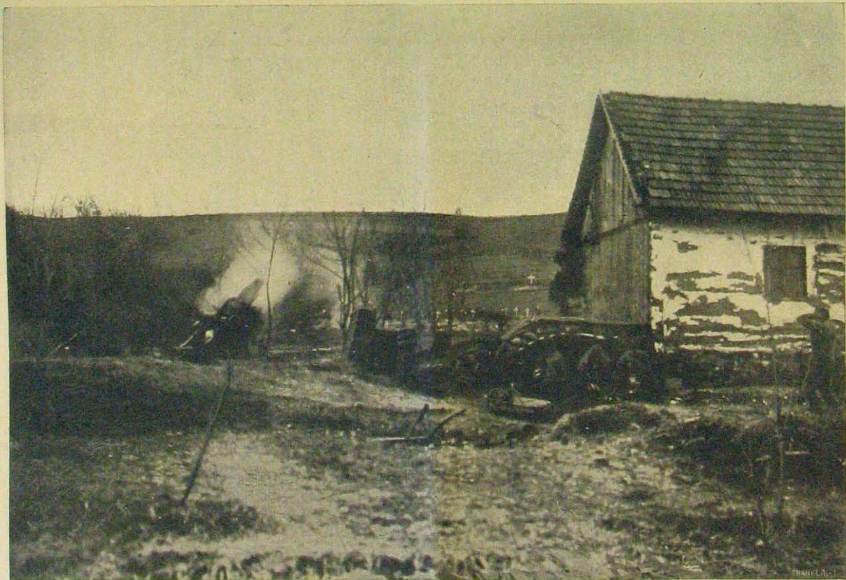
24 centiméteres taraczkjaink. A taraczk a lövés pillanatában.