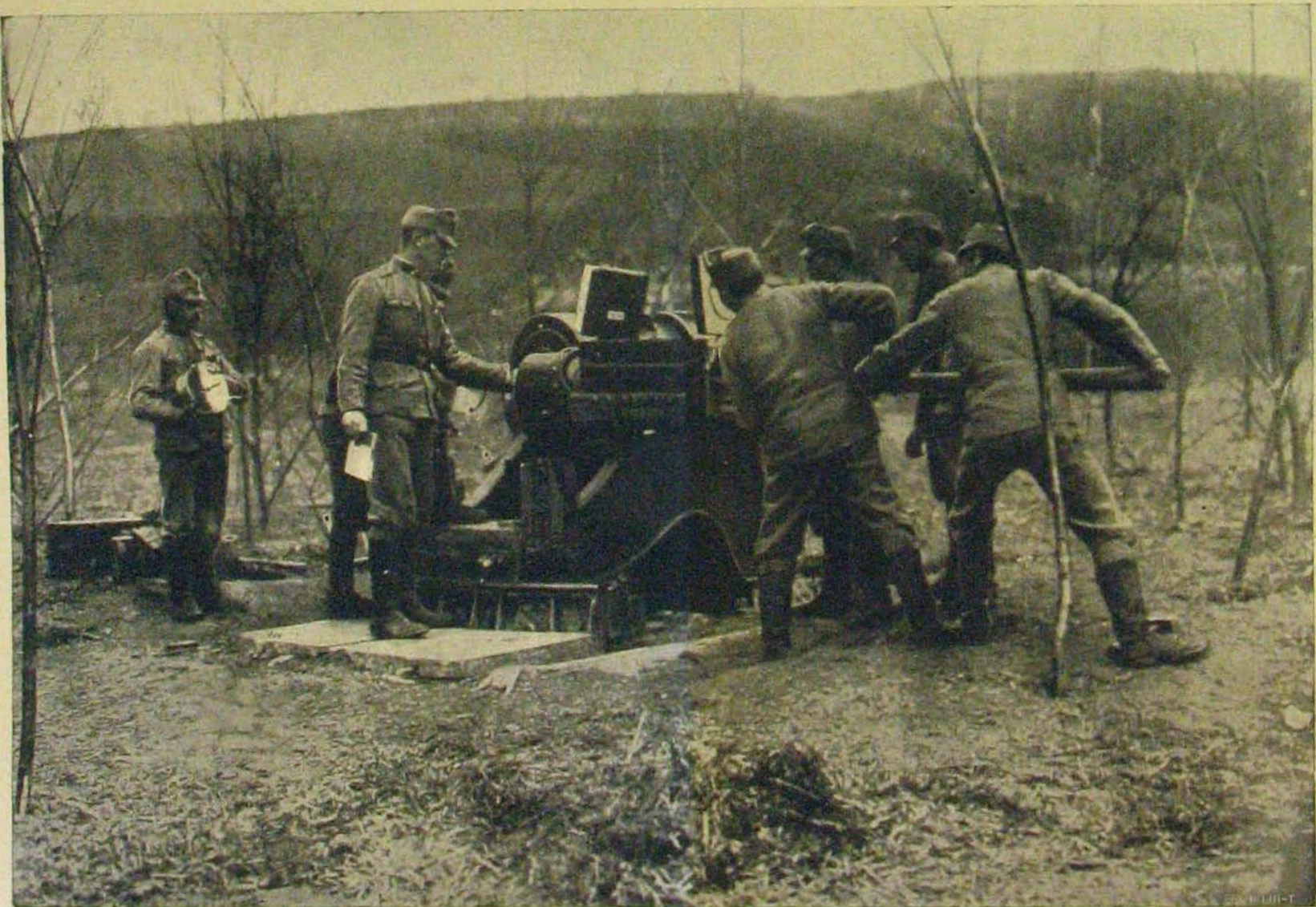
24 centiméteres tarackjaink. — A tarack töltése.