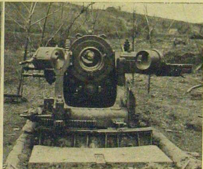
Lövés után megvizsgálják a taraczk csövét.