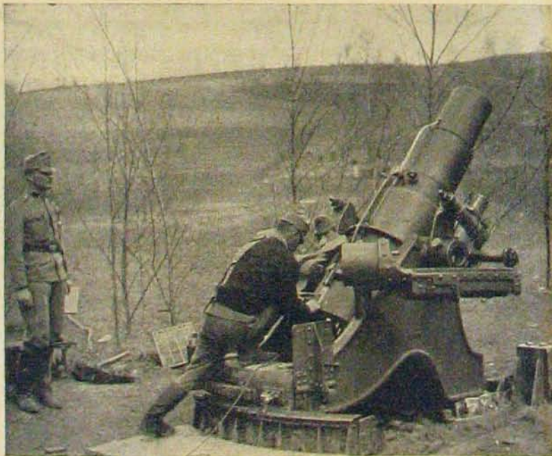
24 czentinéteres taraczkjaink. — A taraczk a hegy fölött lő át.