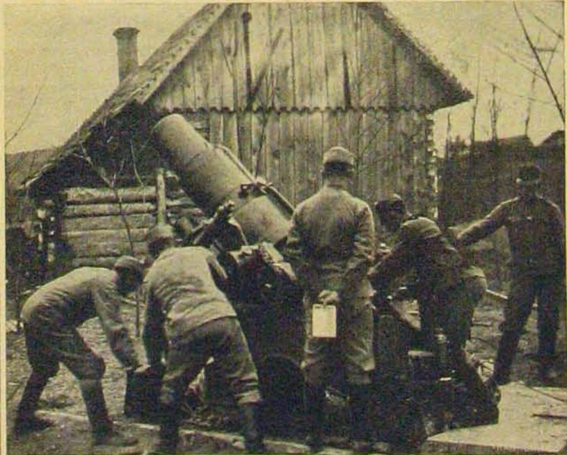
A taraczk irányítása.