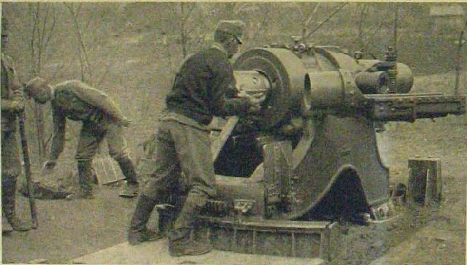
A taraczk töltése.