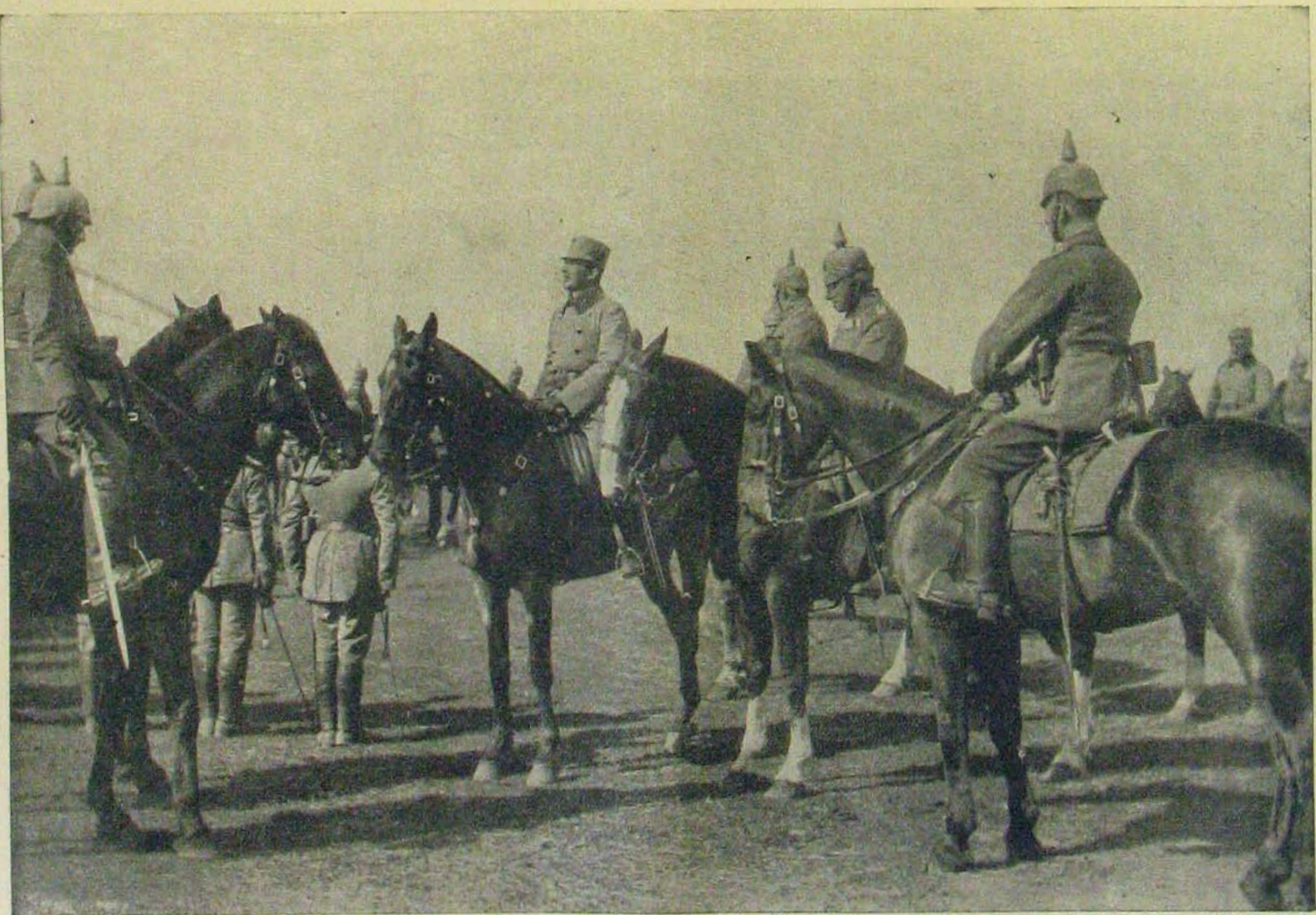
Az északi harcztérről. — Károly Ferencz József főherceg trónörökös szomlót tart a német lovasság fölött.