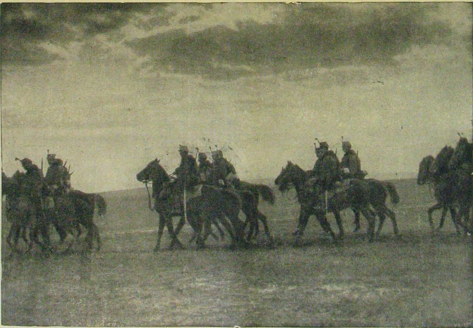
Az északi harctérről. — Éjjeli szolgálatba induló huszárijárőr Bessarábia határán.