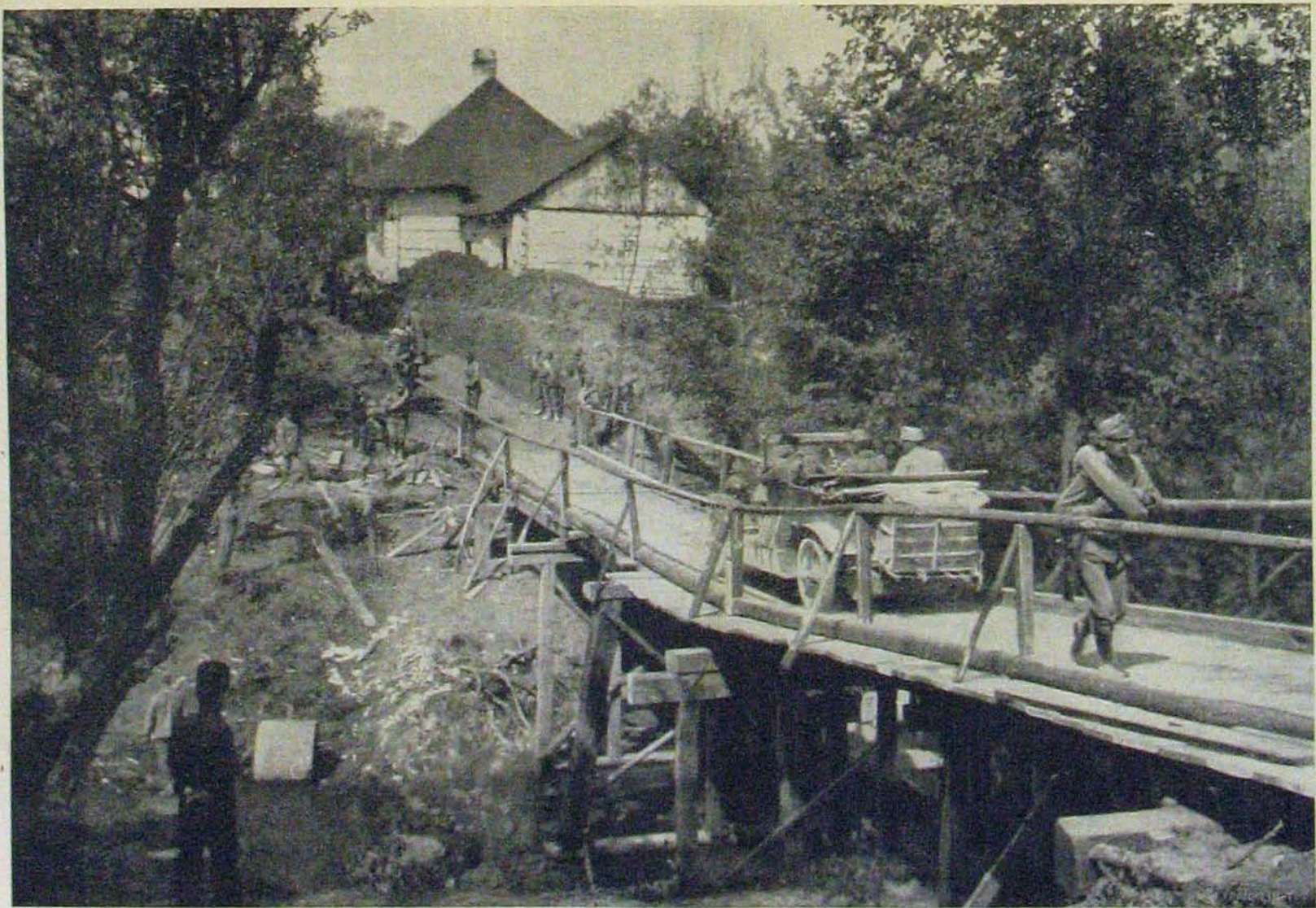
Galiczai győzelmes harcainkból. — A vihovcei hadi híd az oroszok elvonulása után.