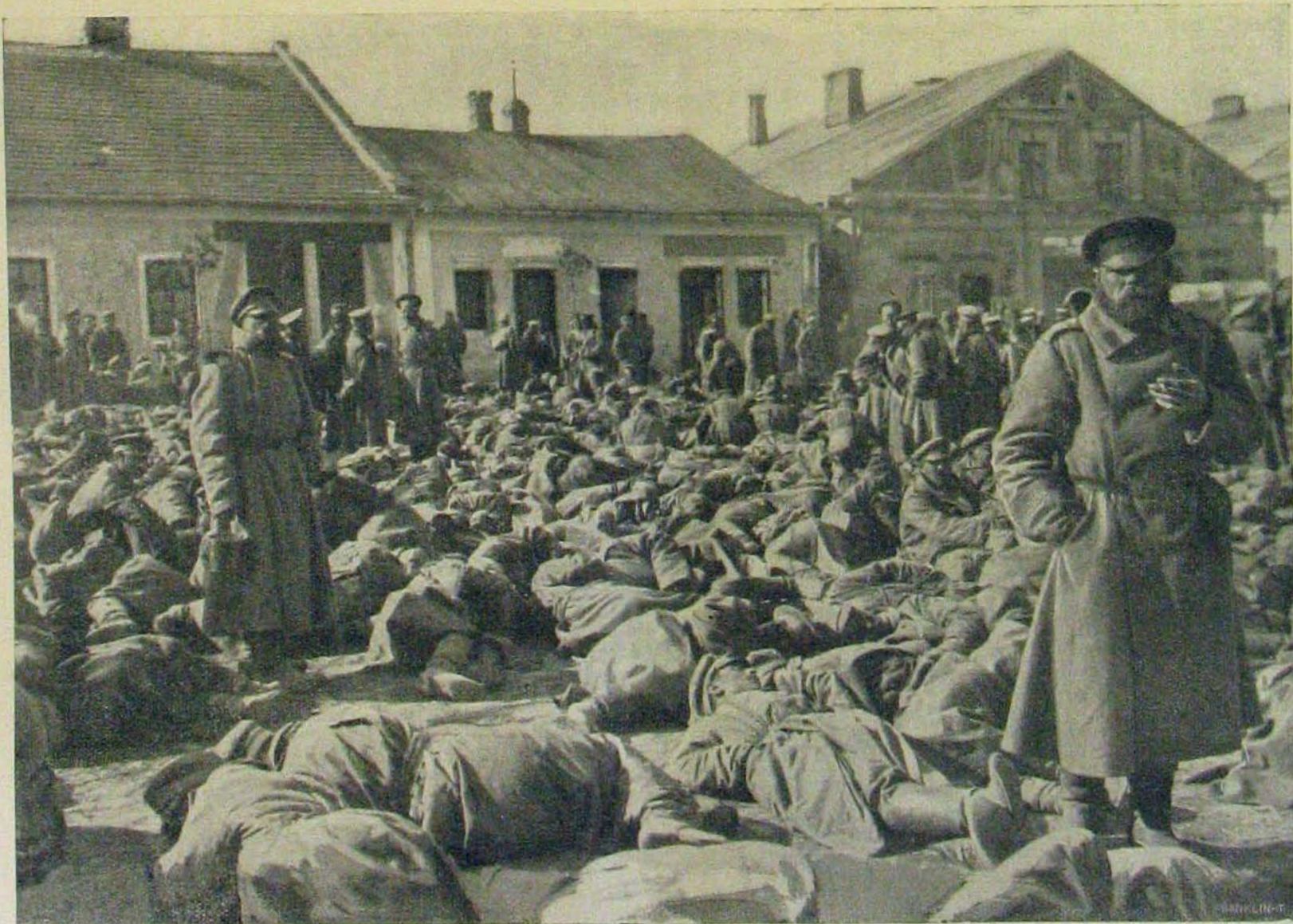
Galicziai győzelmes harcainkból. — Orosz foglyok.