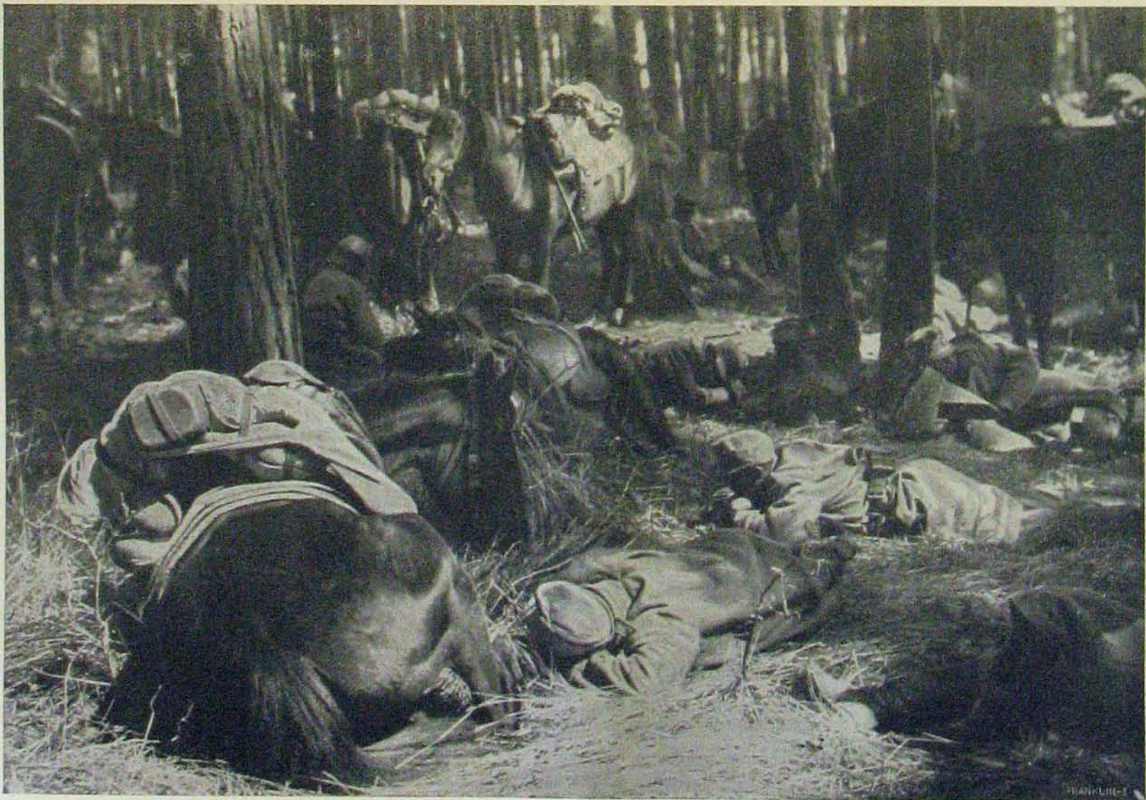
Galicziál győzelmes harcainkból. — Pihenő huszárok egy erdőben.