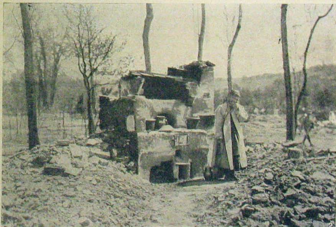
A dnyesztermenti harcokból. — Csak a tűzhely maradt meg.