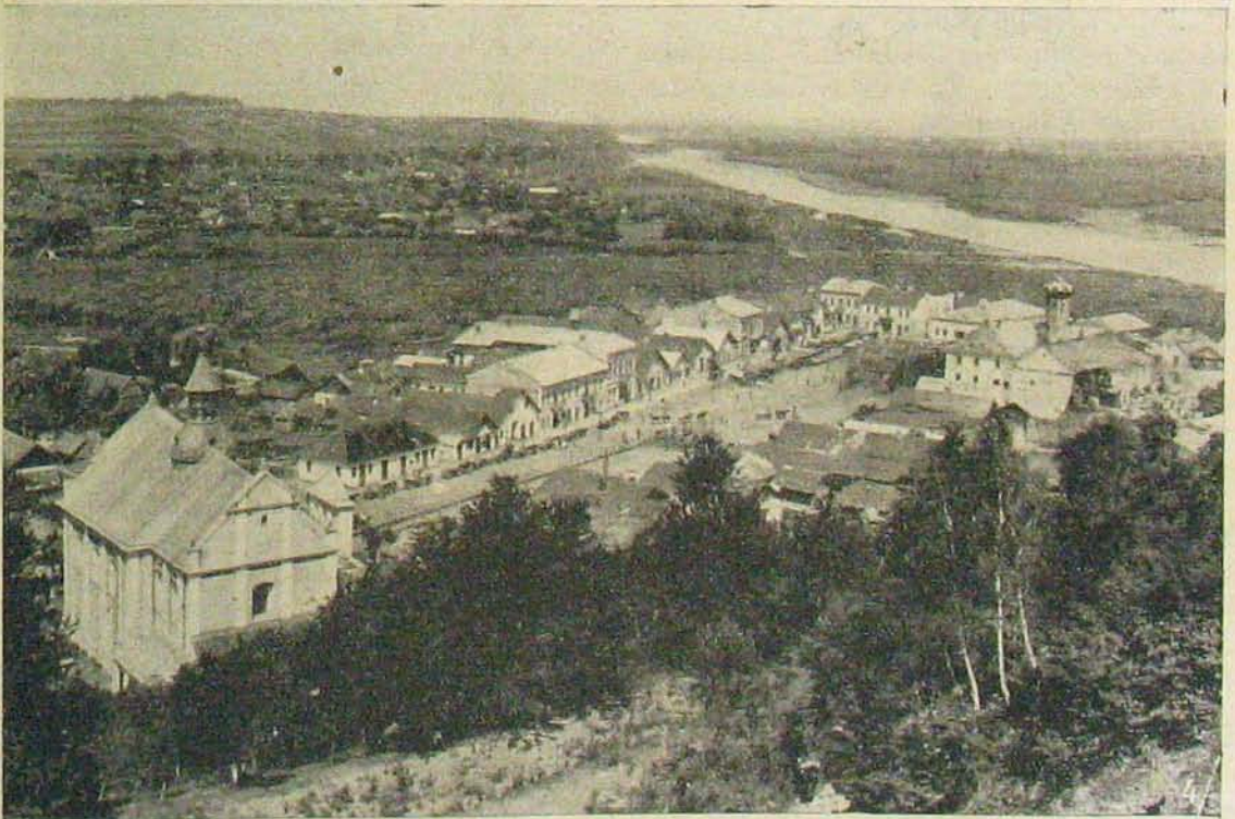
A dnyesztermenti harcokból Halicsa a Dnyeszter partján.