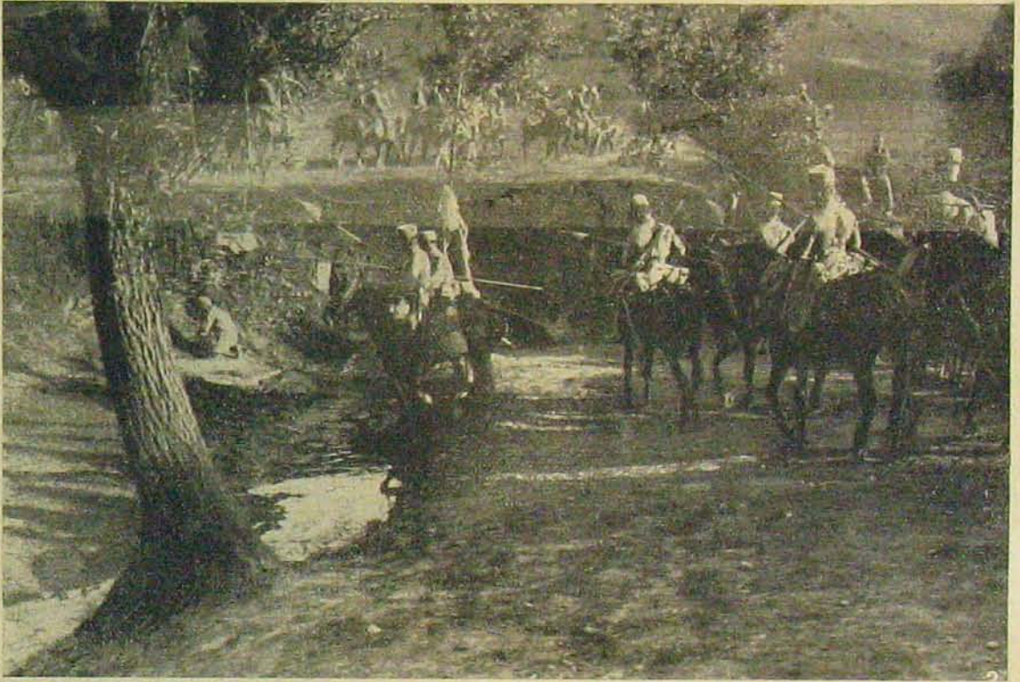
Német huszárok felvonulása.