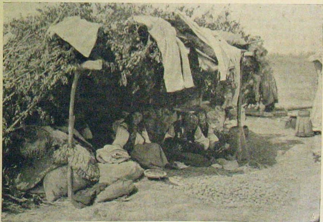
A dnyeszirementi harcokból. Földönfutók ideiglenes lakásai.