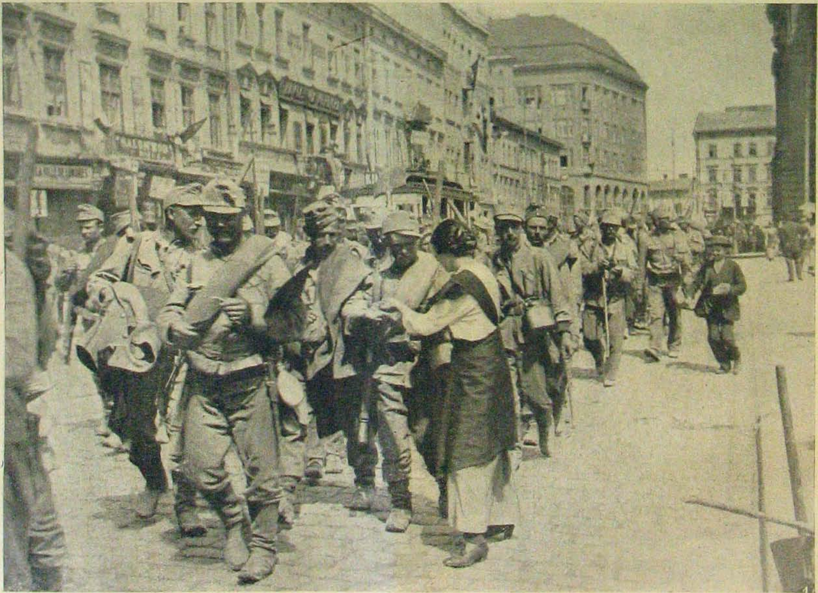
Lembergí képek. — Boyonuló katonák Lembergben.