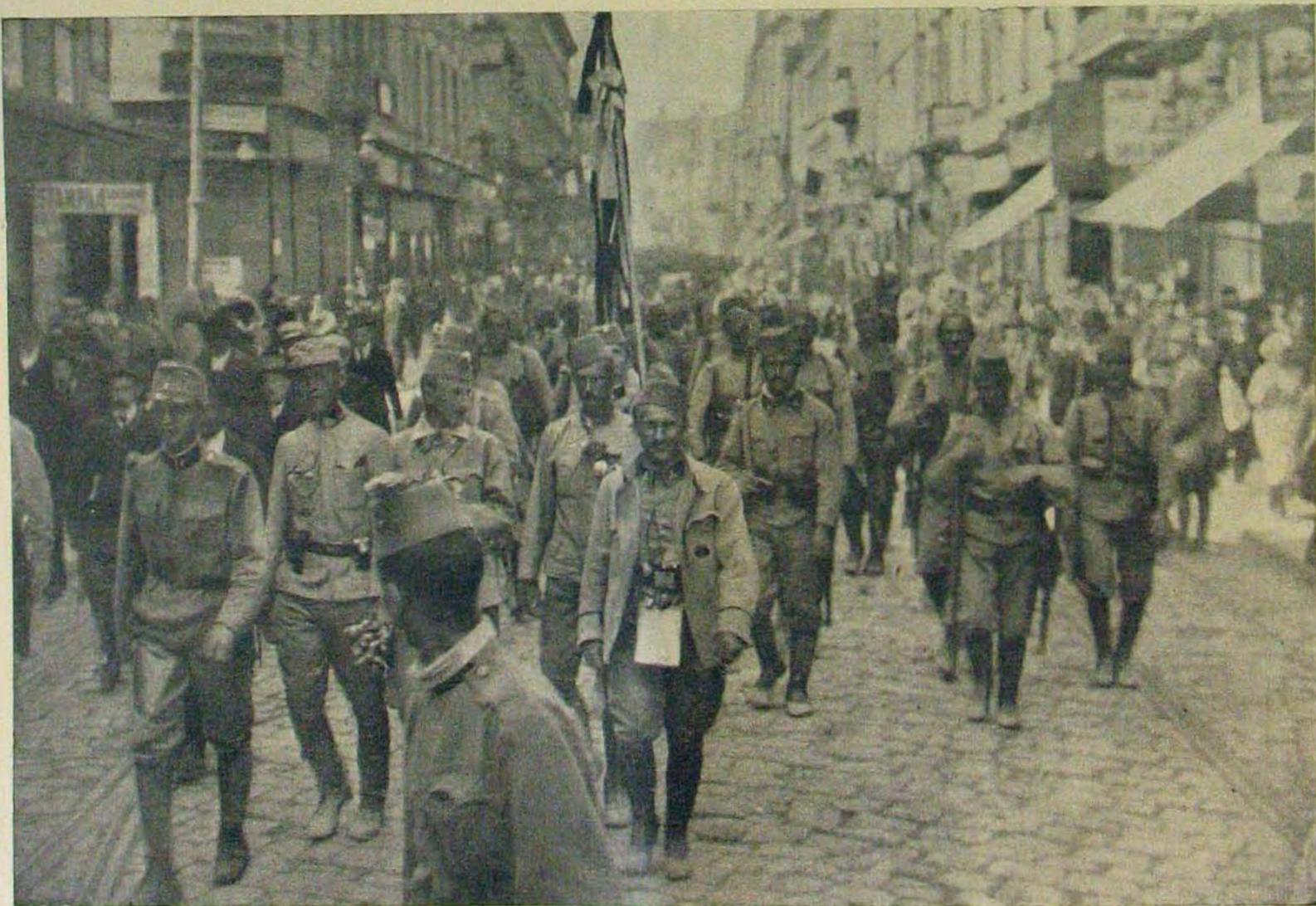
Lemberg képek. — Bosnyák katonák bevonulása Lembergbe.