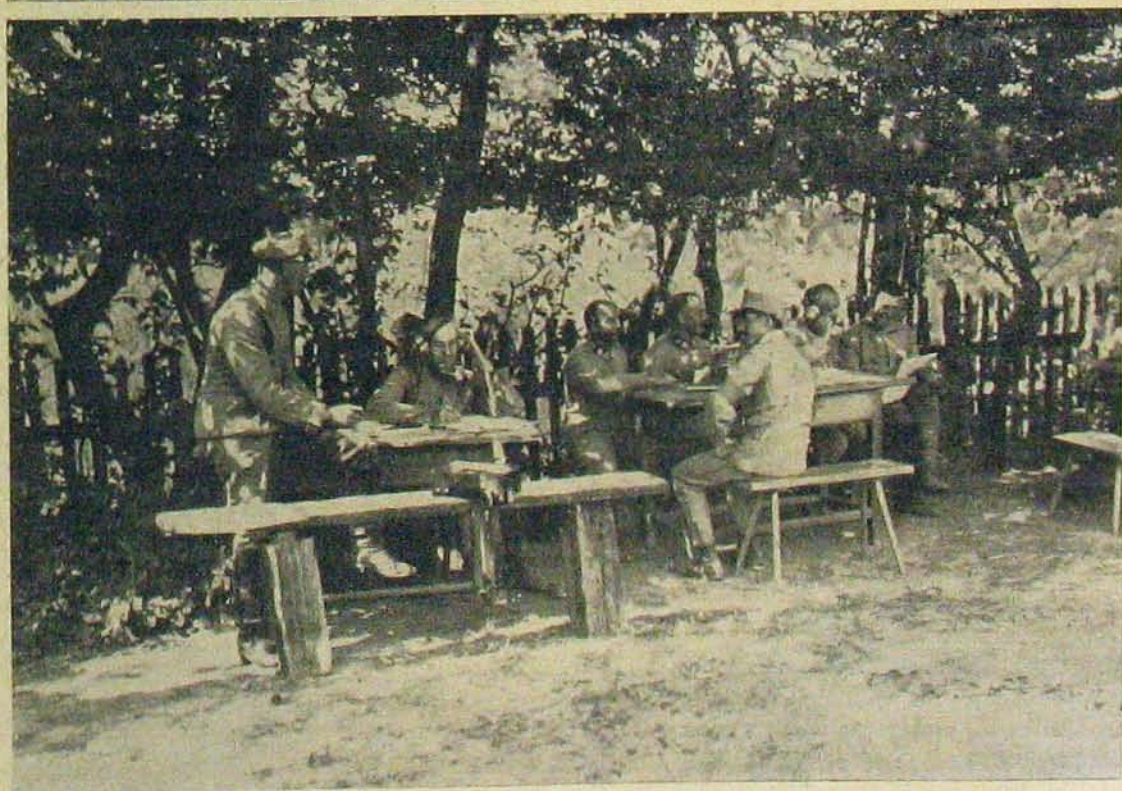
Az északi harsztérről. — Vörös Kereszt szekerei. — Német és osztrák-magyar telefon-állomások.