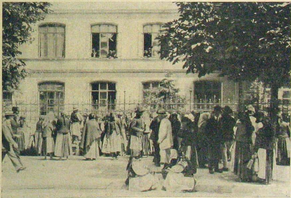
Az északi harcterről. — Málha- és élelmiszerszállító lovak. — Staniszluban soroznak.