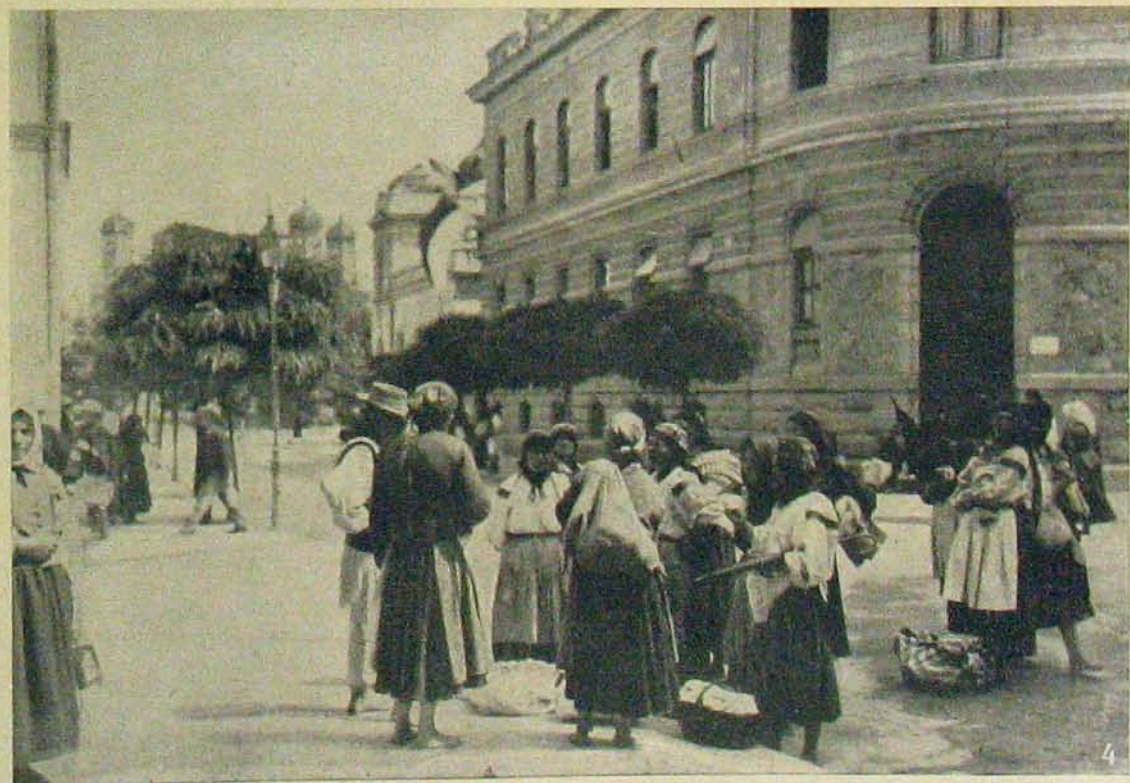
Az északi harcztérről. — Átkelés a Dnyzster egy mellékfolyóján. — Uteza Stanislaubau.