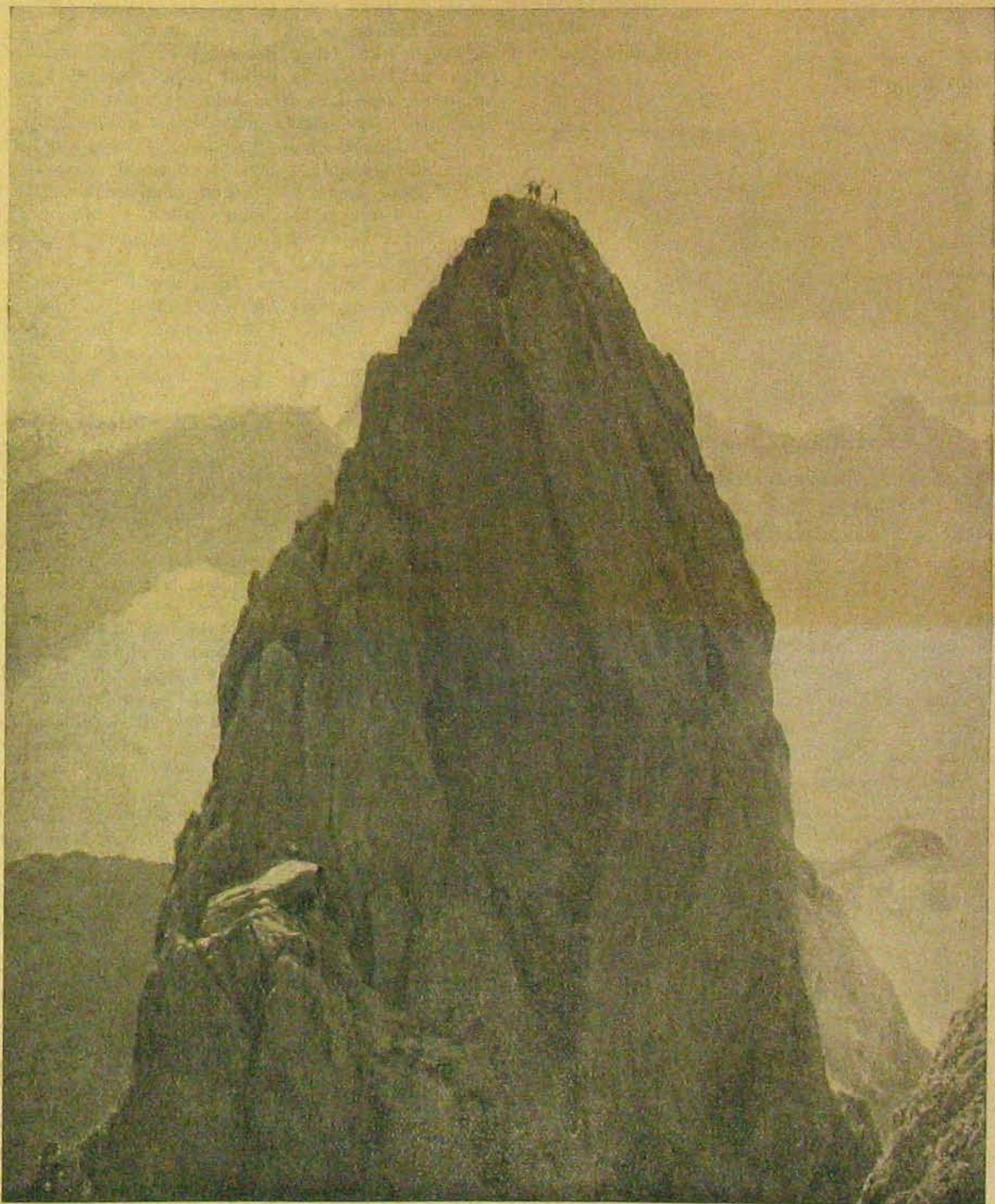
Az olasz háború színteréről. — A Cadin-csúcs a tiroli dolomitokban