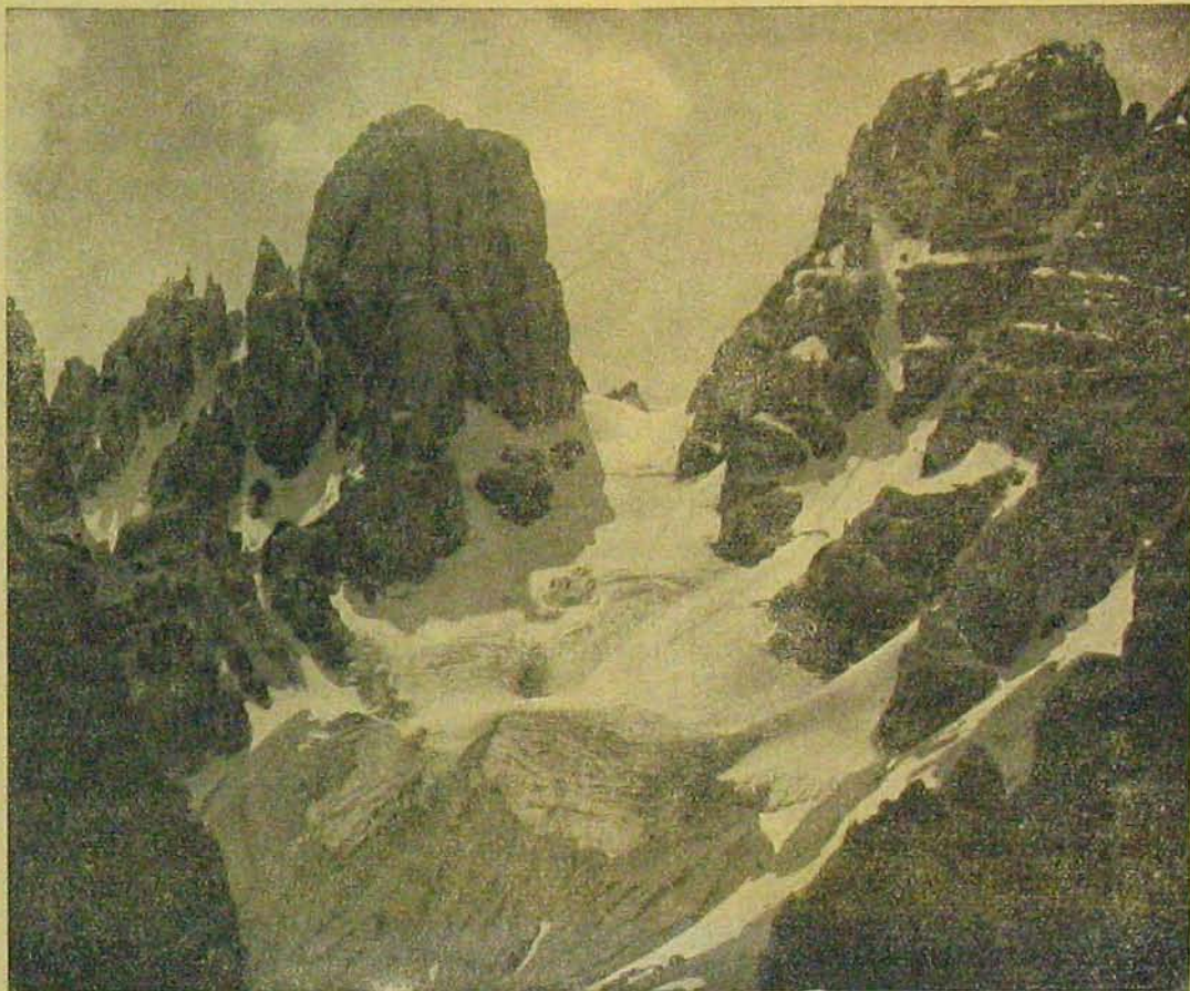
Az olasz háború színteréről. — A Monte Cristallo és a Piz-Popama Tiroiban.

lönbség a lopás és sikkasztás, rablás és csalás között. A lopásnál az idegen ingó dolog eltulajdonítása a más birtokából (birlalatából) való jogtalan elvétellel történik; a rablásnál ez az elvétel a birtokos személye vagy harmadik jelenlété ellen alkalmazott erőszak vagy fenyegetéssel történik. A csalásnál az idegen dolog megszerzésének módja és eszköze a fondorlatos megtévesztés. Míg a sikkasztásnál a tettes már a dolog birtokában (birlalatában) van, a dolog birtokát tehát feltétlenül jogos uton kellett megszereznie és csak ennek hovatartása bűnös és jogtalan.