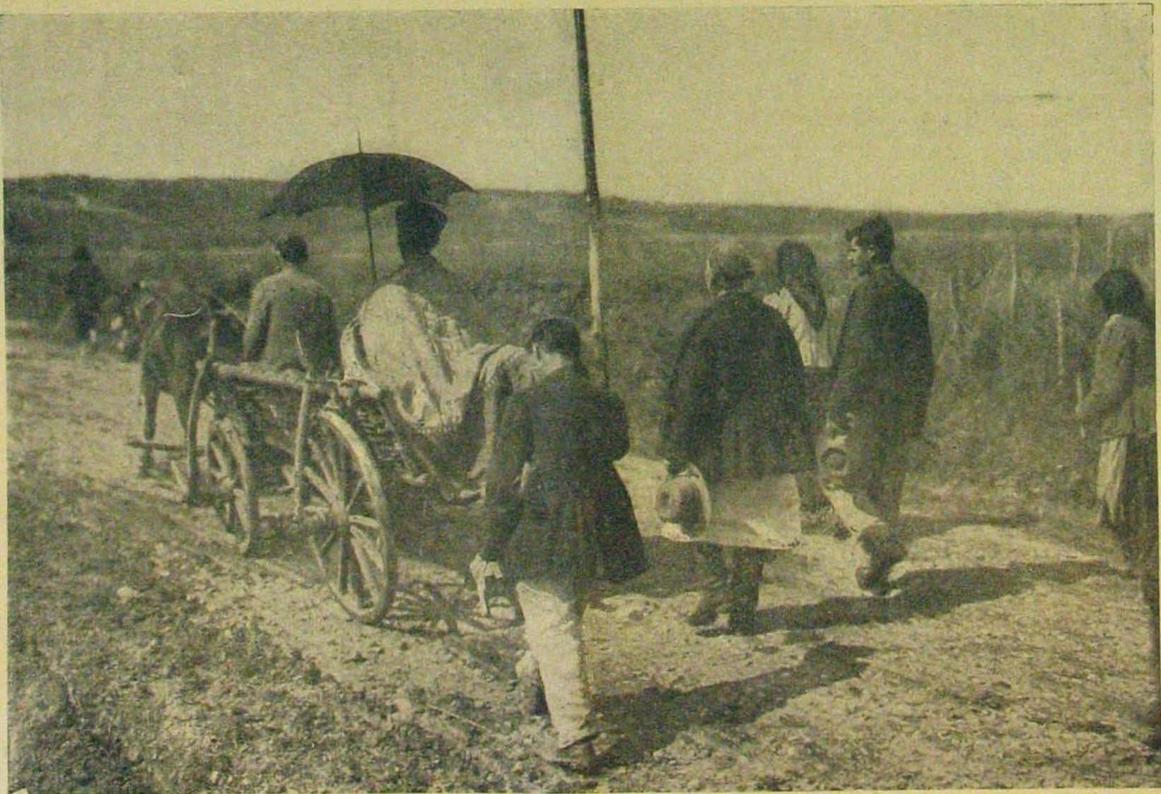
A Tarnopol körüli harcokból. — A zawalowi pap visszatér falujába.