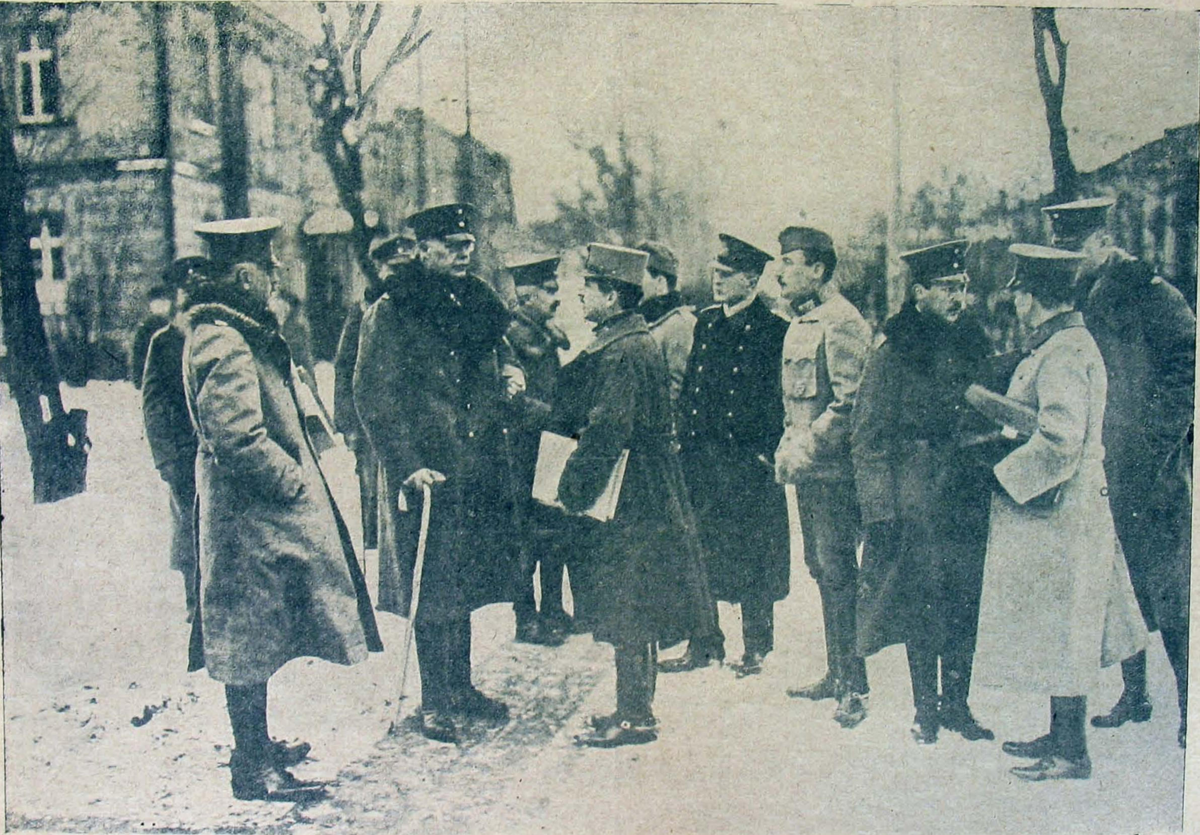
A német és osztrák-magyar megbizottak az orosz küldöttekre várakoznak.