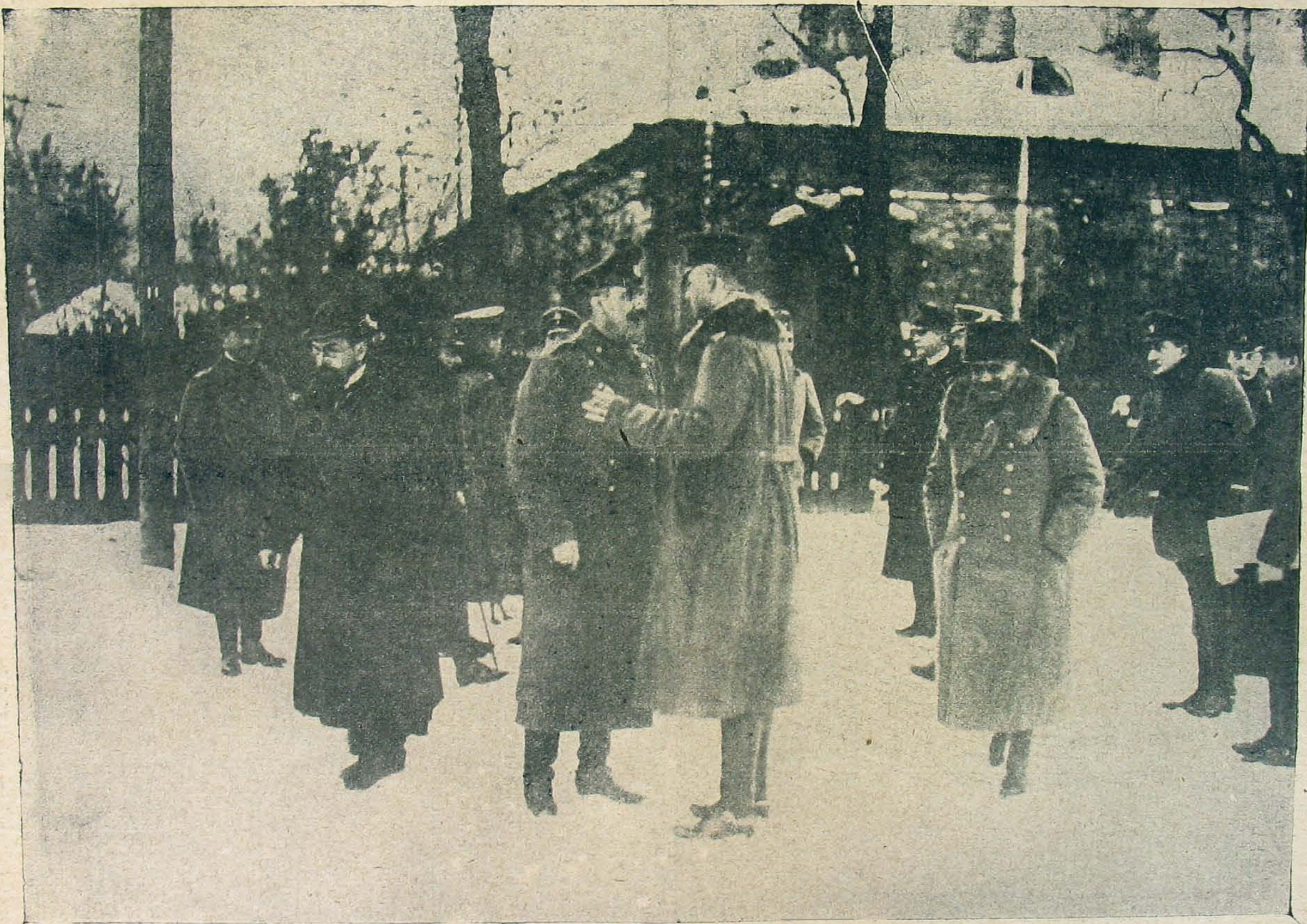
A tanácskozó épület előtt.