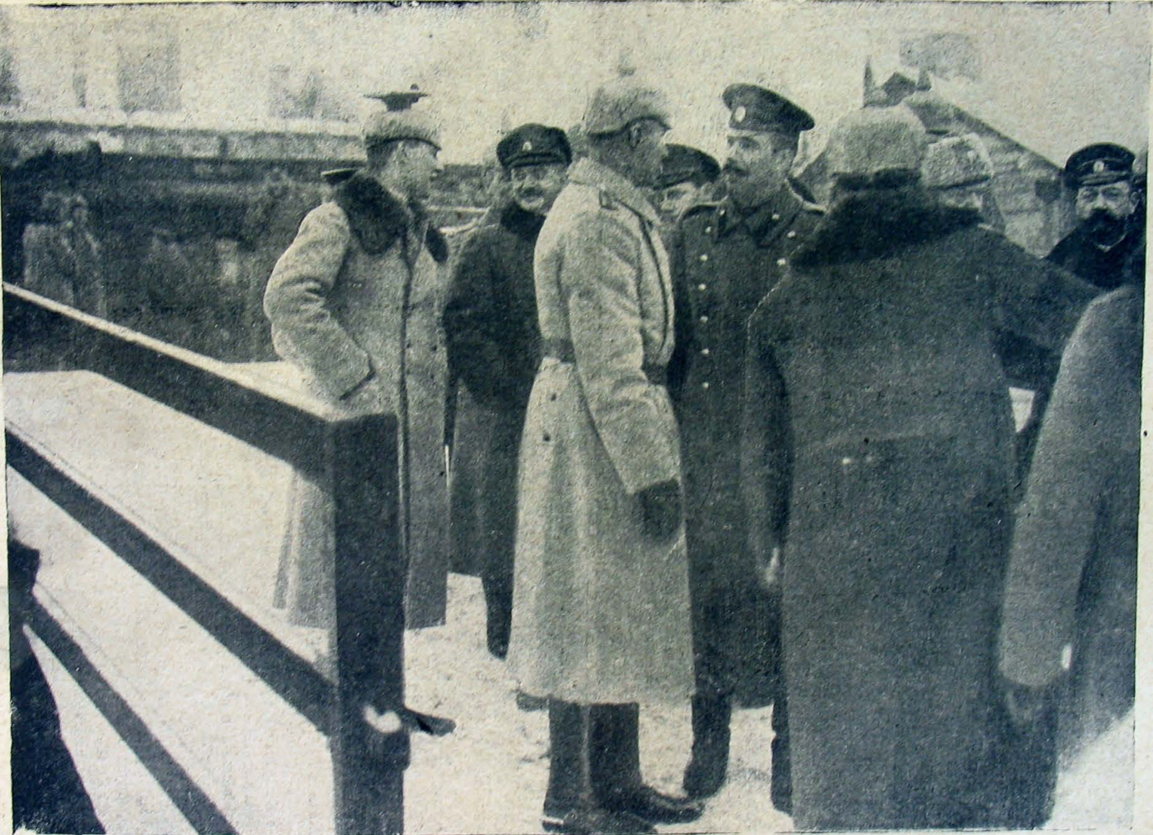
Az orosz küldöttek fogadtatása a pályaudvaron.