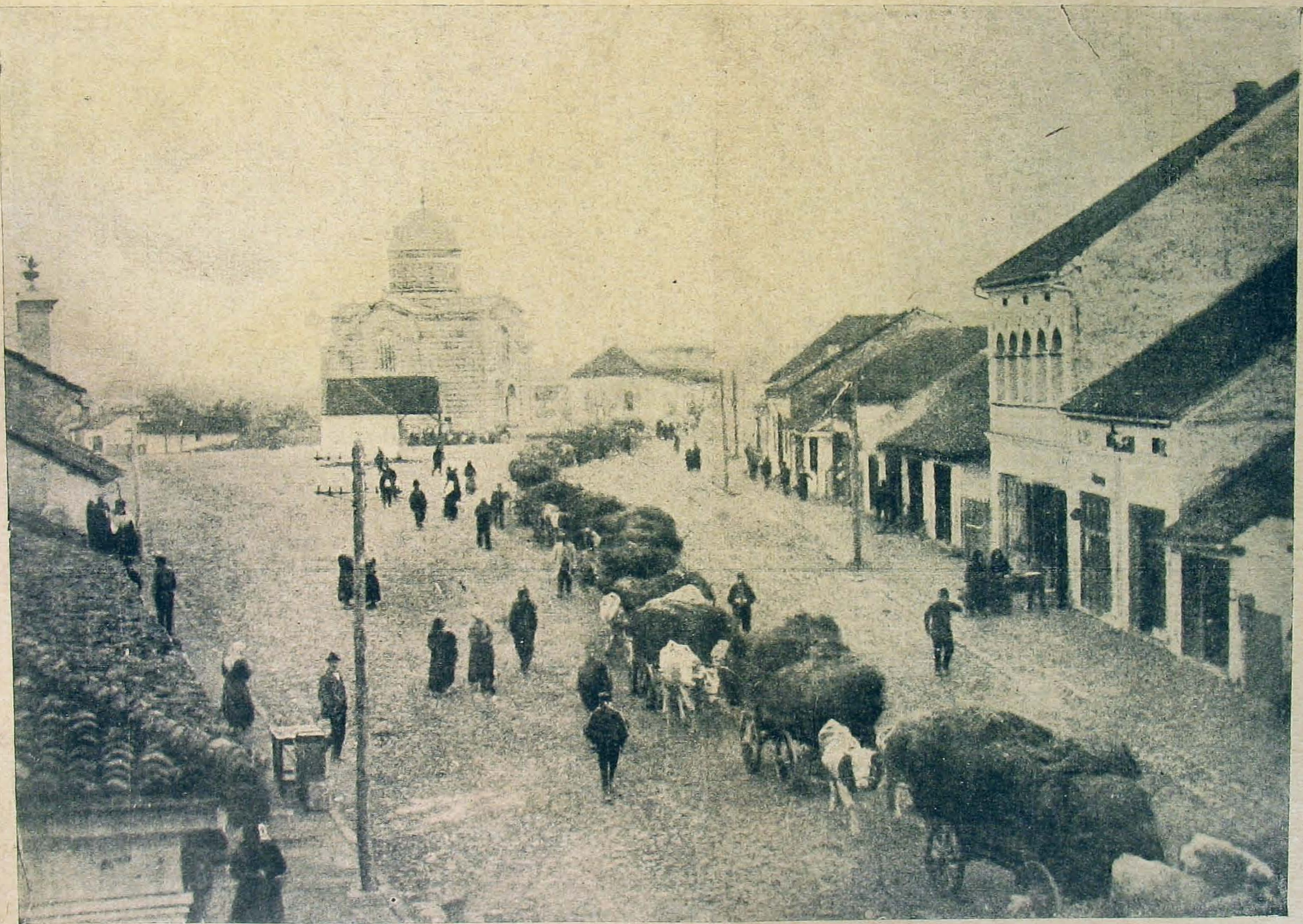
Szerb parasztszekorcken hordják a terményeket egyik gyűjtőállomásra.