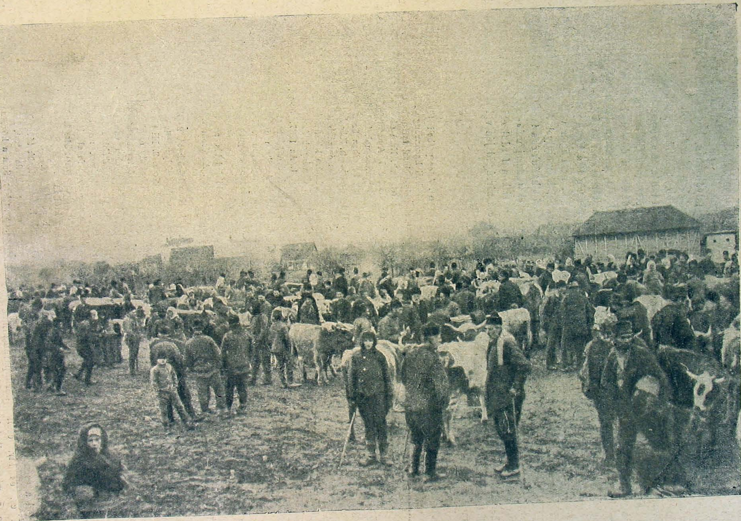
Marhavásár az általunk igazgatott Szerbiában.