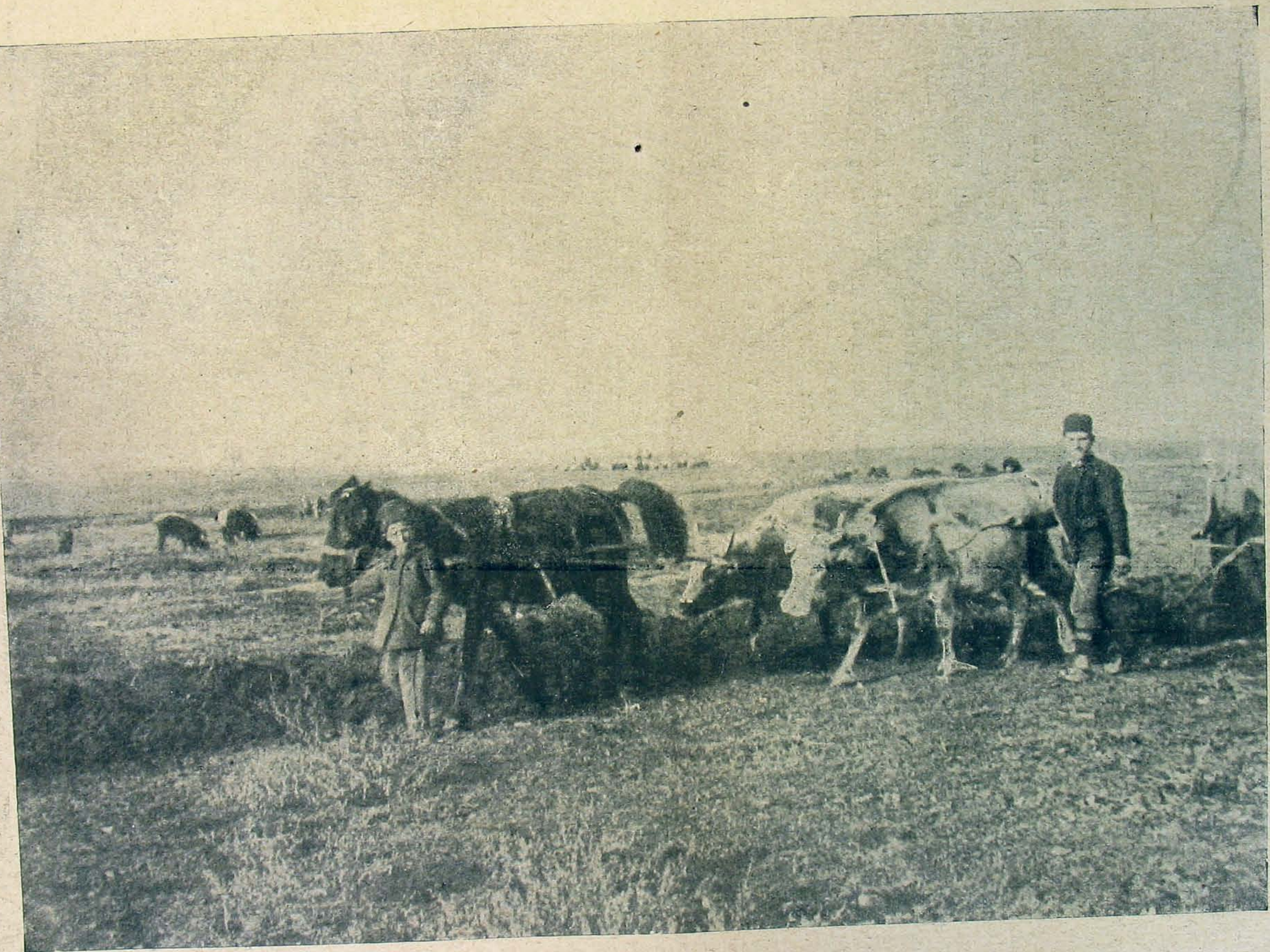
Tavaszi szántás Szerbiában.