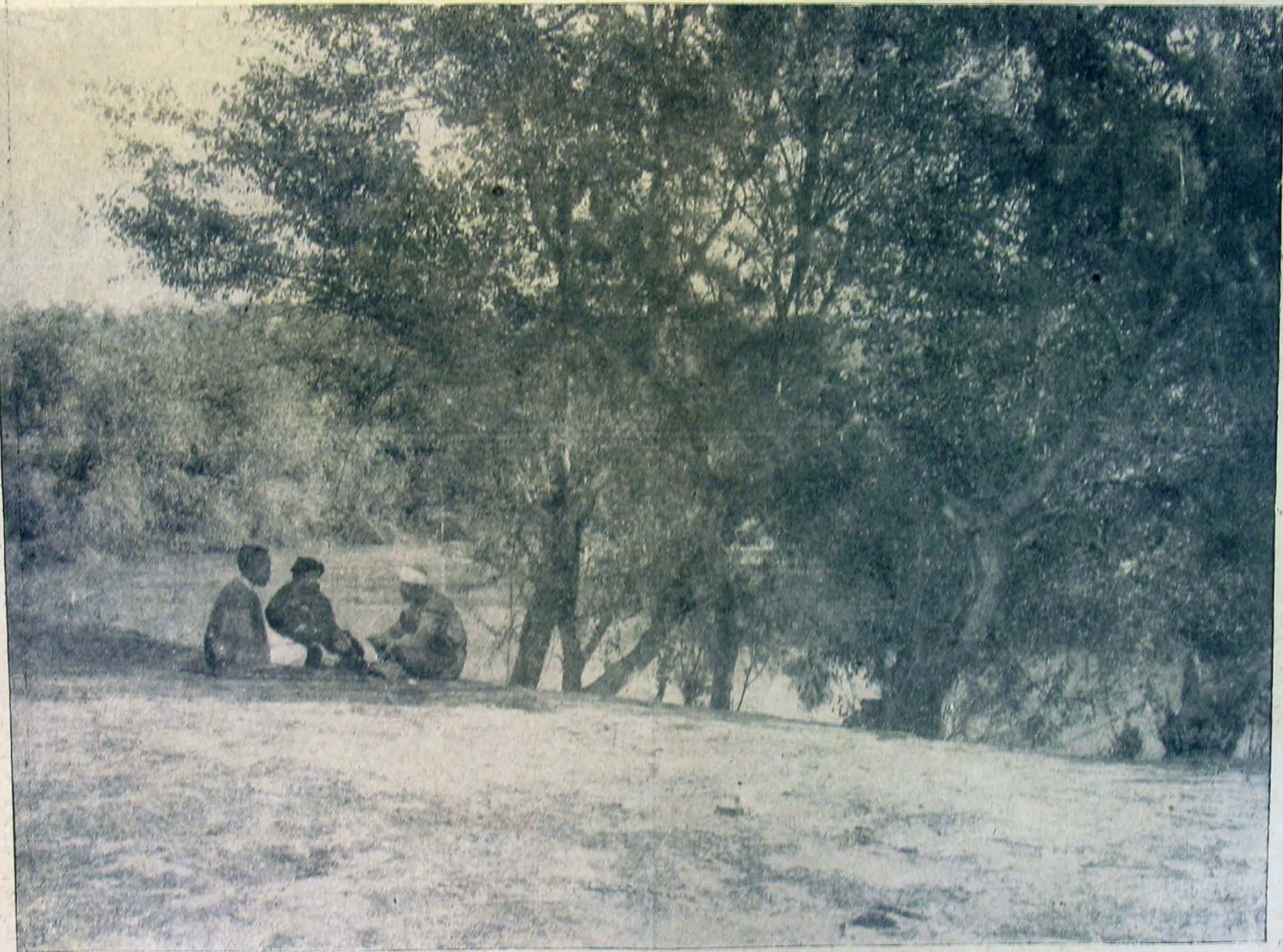
A Jeruzsálem és Jericho közötti uton, a merre most az angolok állnak.