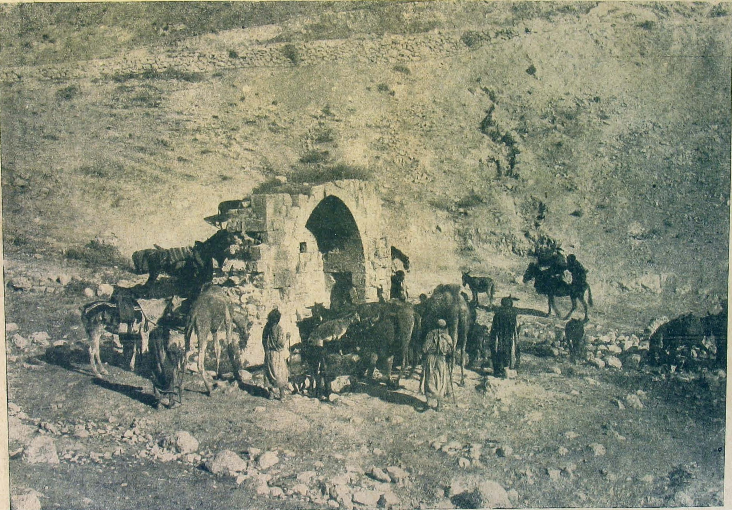
A Jeruzsálem és Jericho közötti út.