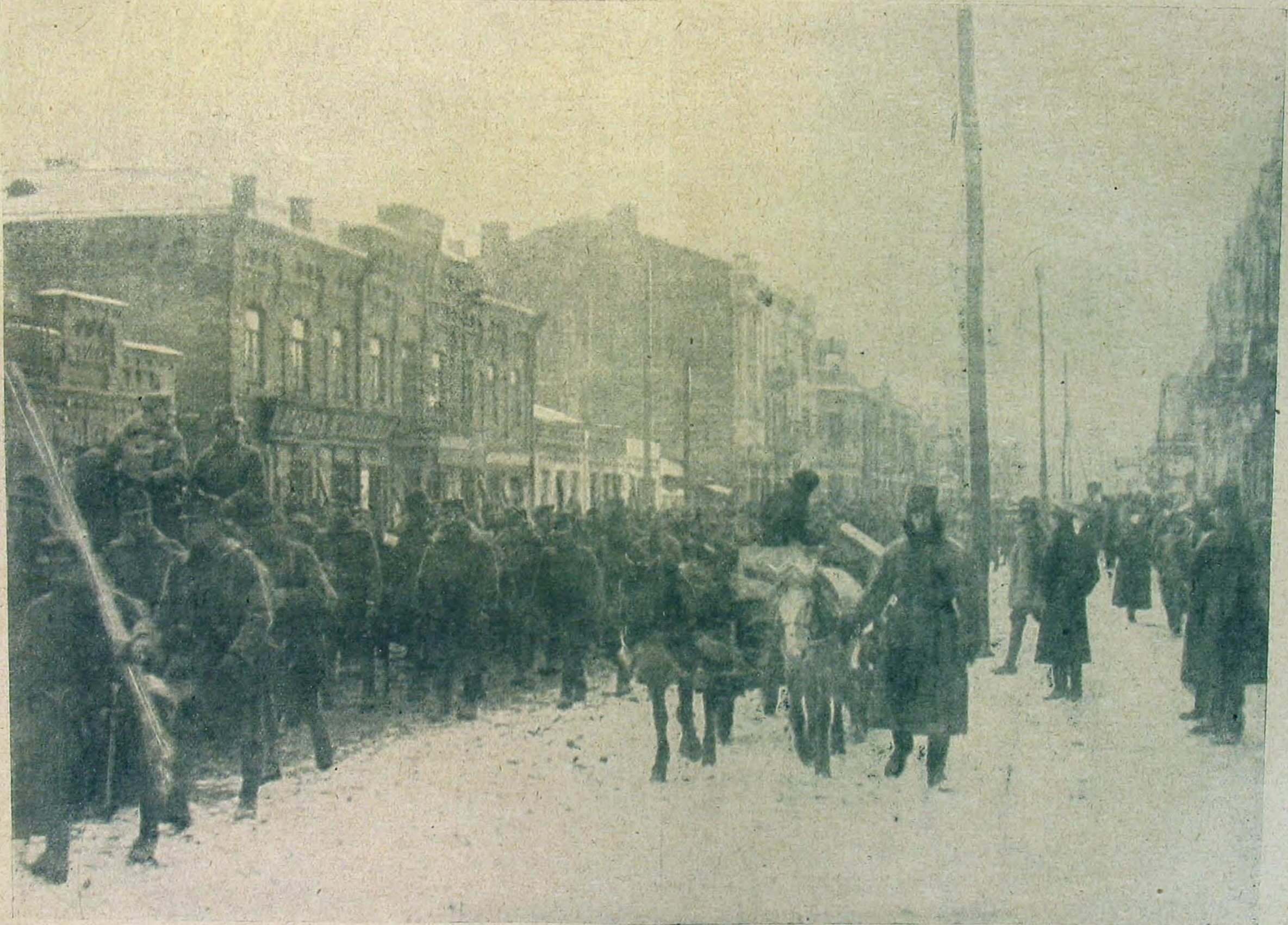
Csapataink bevonulása Odesszába.