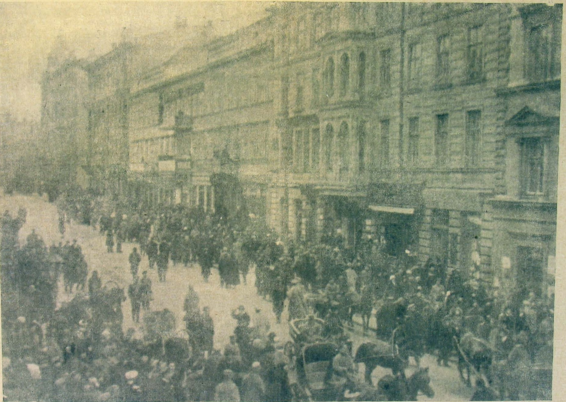
Utozai élet Odesszában csapataink bevonulása után.