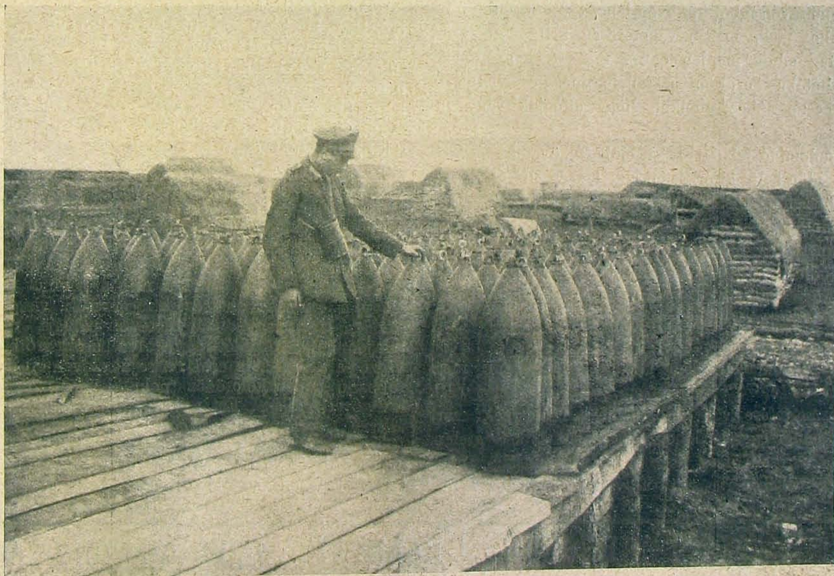
Nehéz angol gránátok egy sértetlen állapotban zsákmányolt raktárban, Aubignyben.