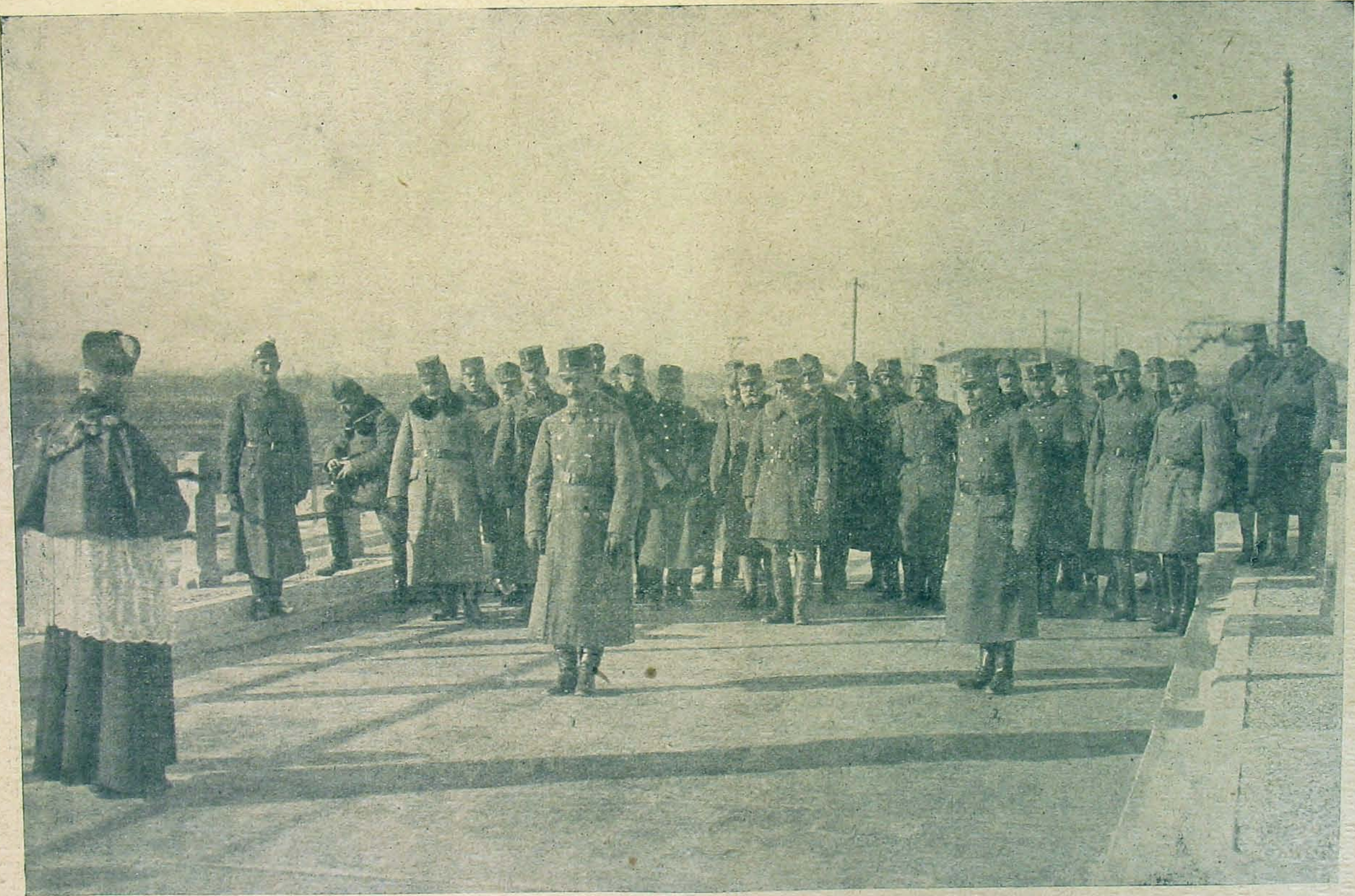
Katonáink által épített Tagliamento-híd felavatása. (Közepén Boroevics tábornagy és Wurm vezérezredes.)