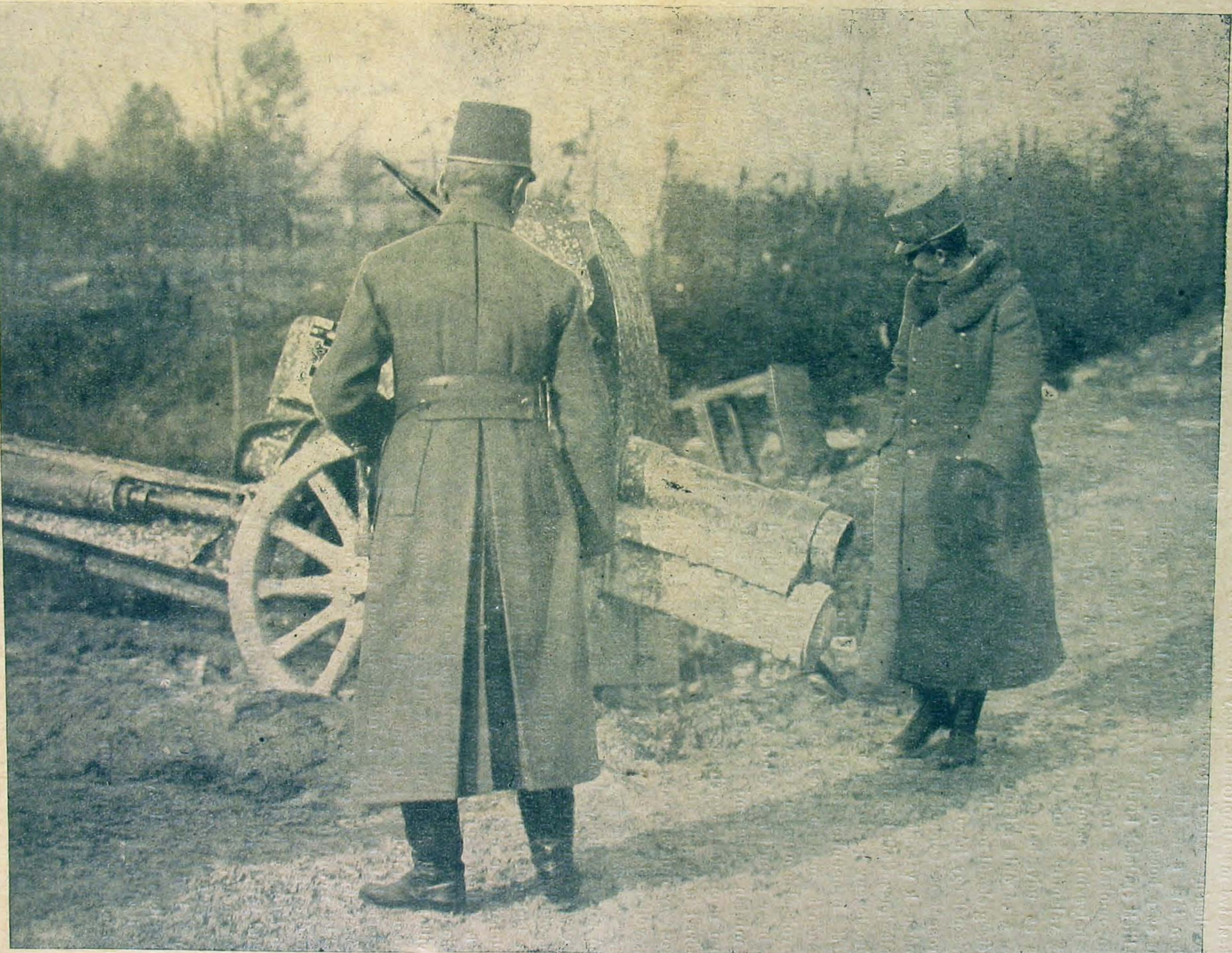
A király egy zsákmányolt ágyut szemlél.