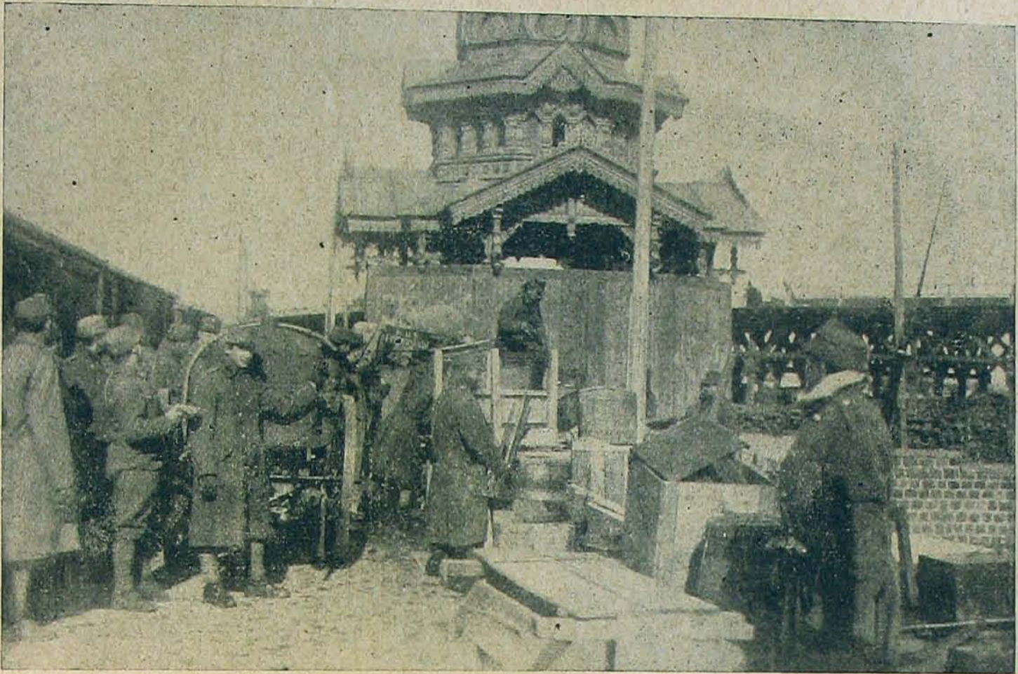
Tábori postahivatalunk az odesszai kikötőben.