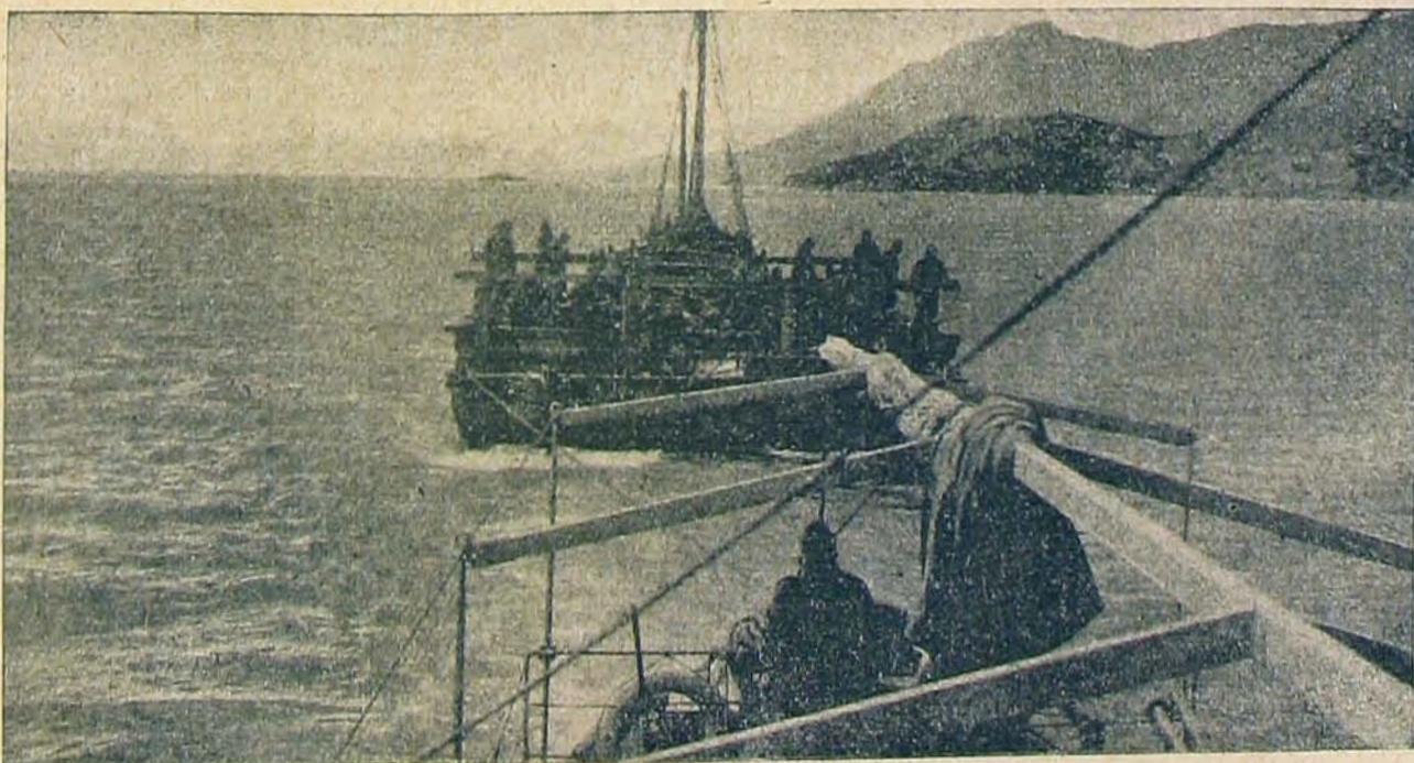
Csapatszállítás a Skutari-tavon.