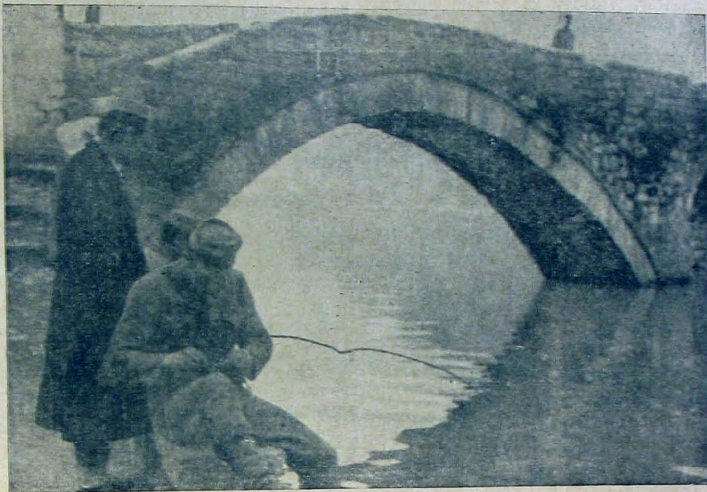
Horgászó bakák a Rijake hidjánál Montenegróban.