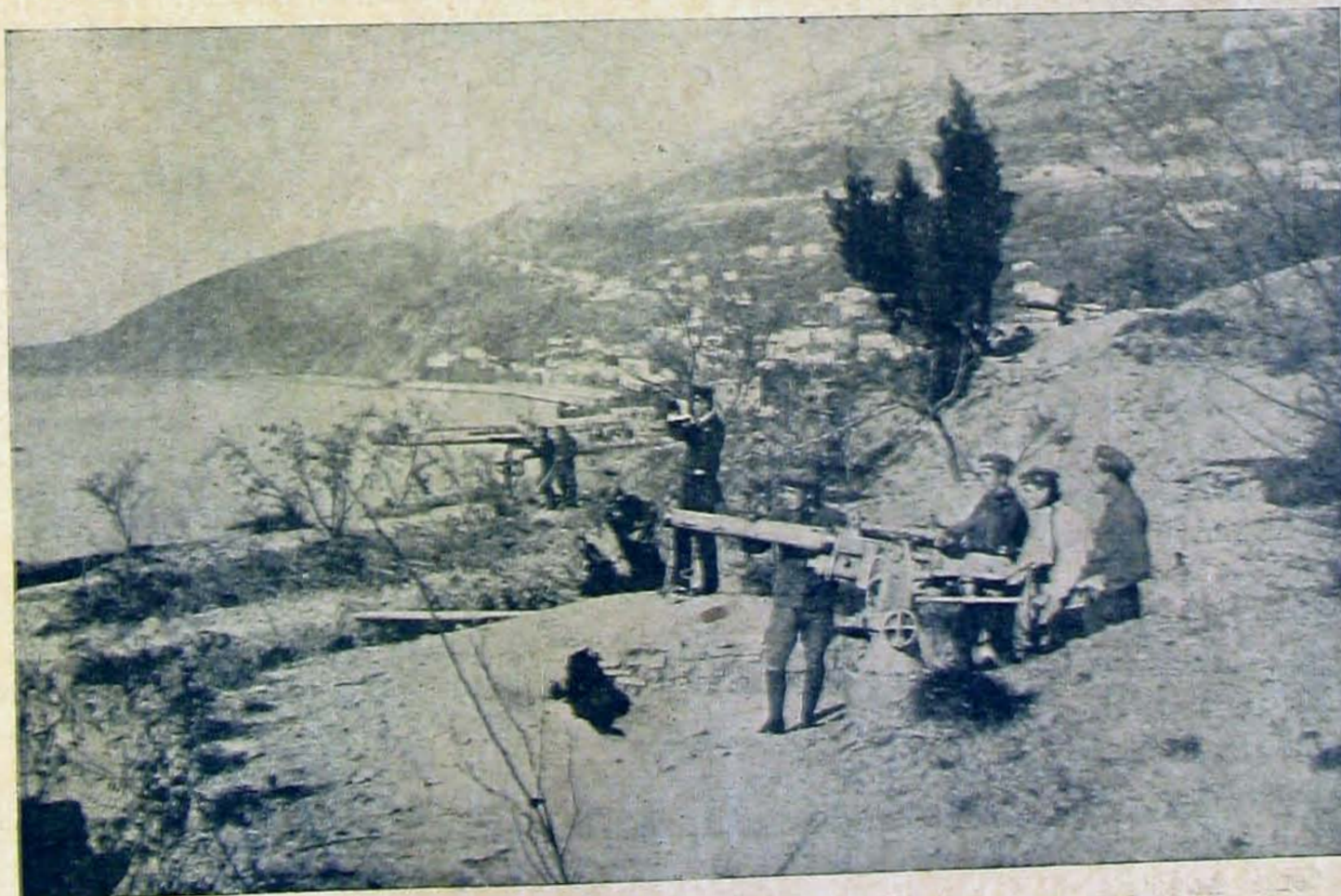
Őrség az Adriónál.