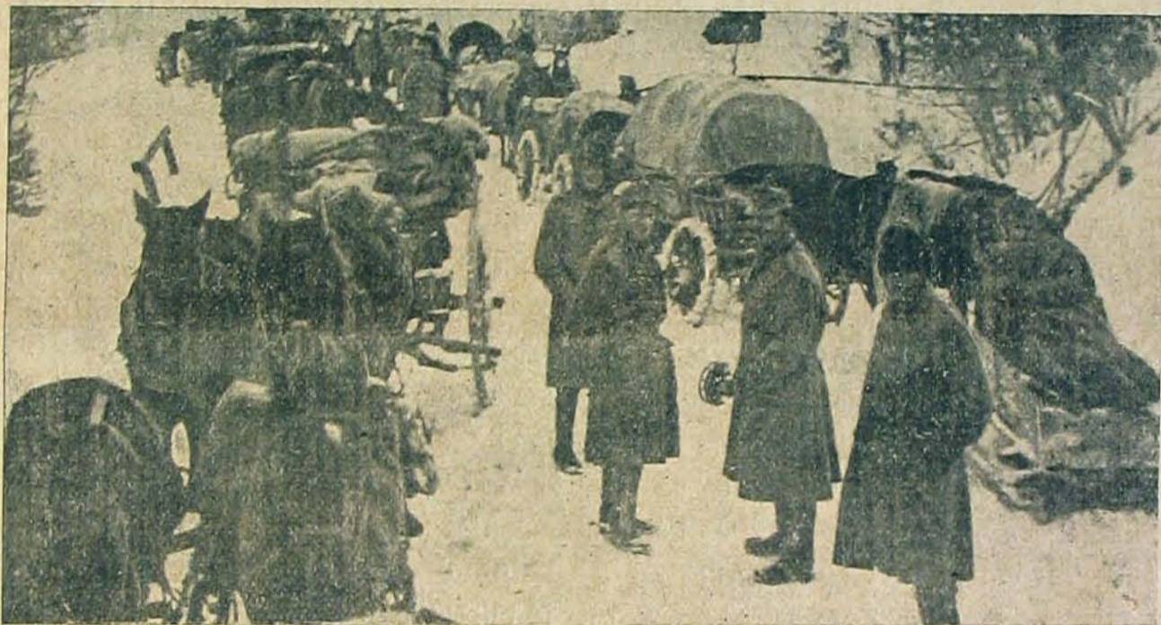
Train a dukovinai havasokban.