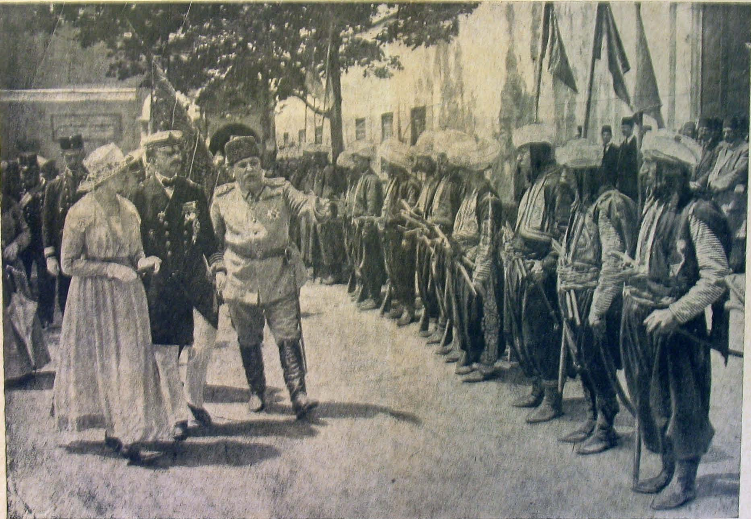
A hadi muzeum előtt a gárda régi janicsár egyenruhában várja az uralkodóért.