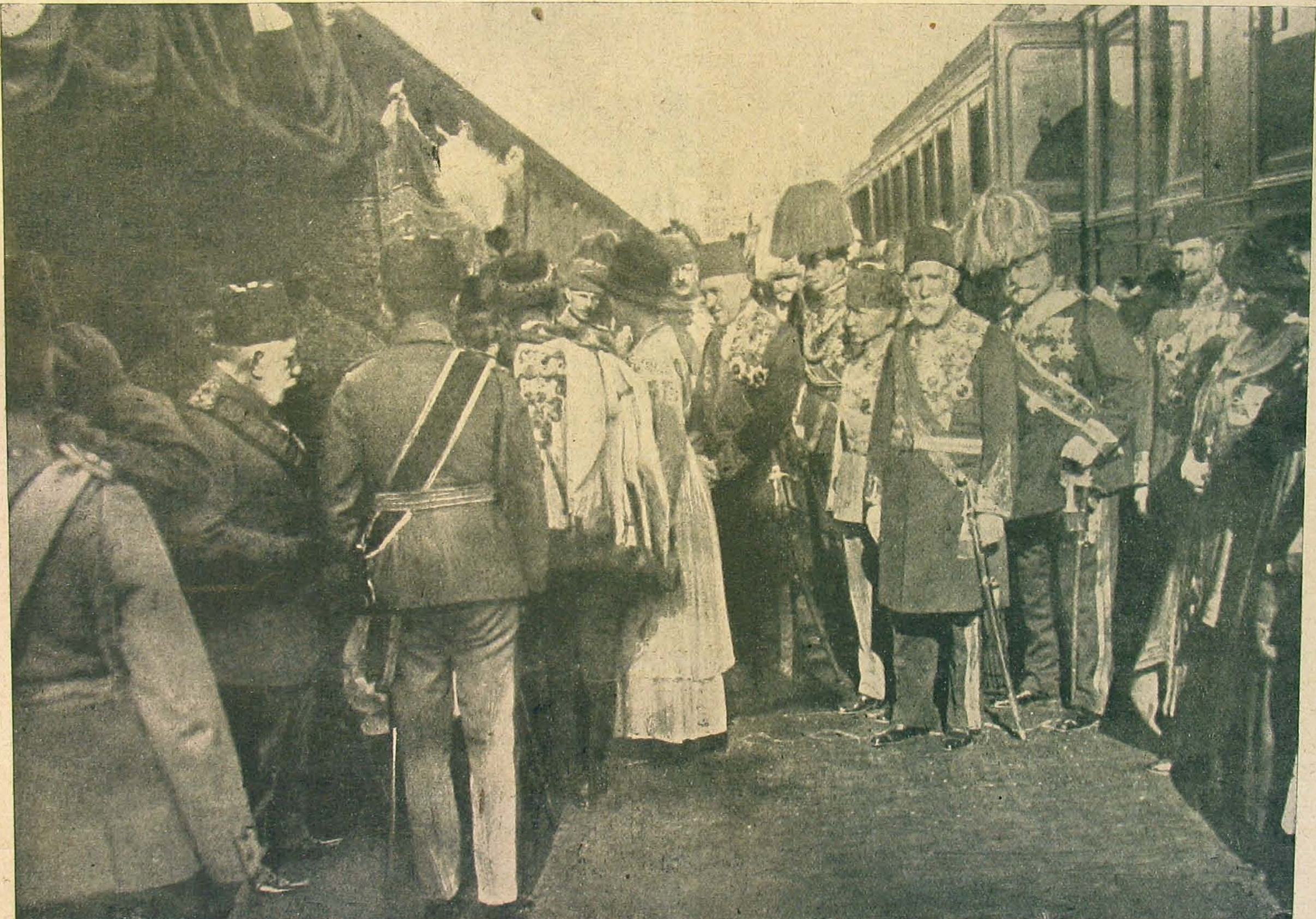
A szultán fogadja a királyi párt megérkezésekor.