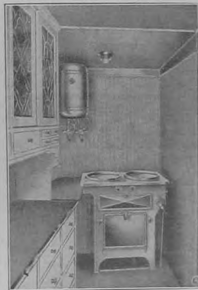
A Zeppelin III. léghajó elektromos konyhája. Az áramot egy hat lóerős dinamó szolgáltatja, amelyet szélturbína hajt.

Hogy a cigányok mire képesek, arról beszámol a csendőrök közt közzsájon forgó sok legenda. X. községben hallottam egy idősebb cigány szökéséről, melyet az kétségtől nagy ügyességgel és szívóssággal hajtott végre. Ezen községben egy csendőrijárőr egy idős, törődött cigányt szabadított ki a nép kezéből, kit tolvajlás miatt már felholtra vertek. Ez az ember a saját lábán nem tudott az őrszlaktanyába bemenni, úgy, hogy