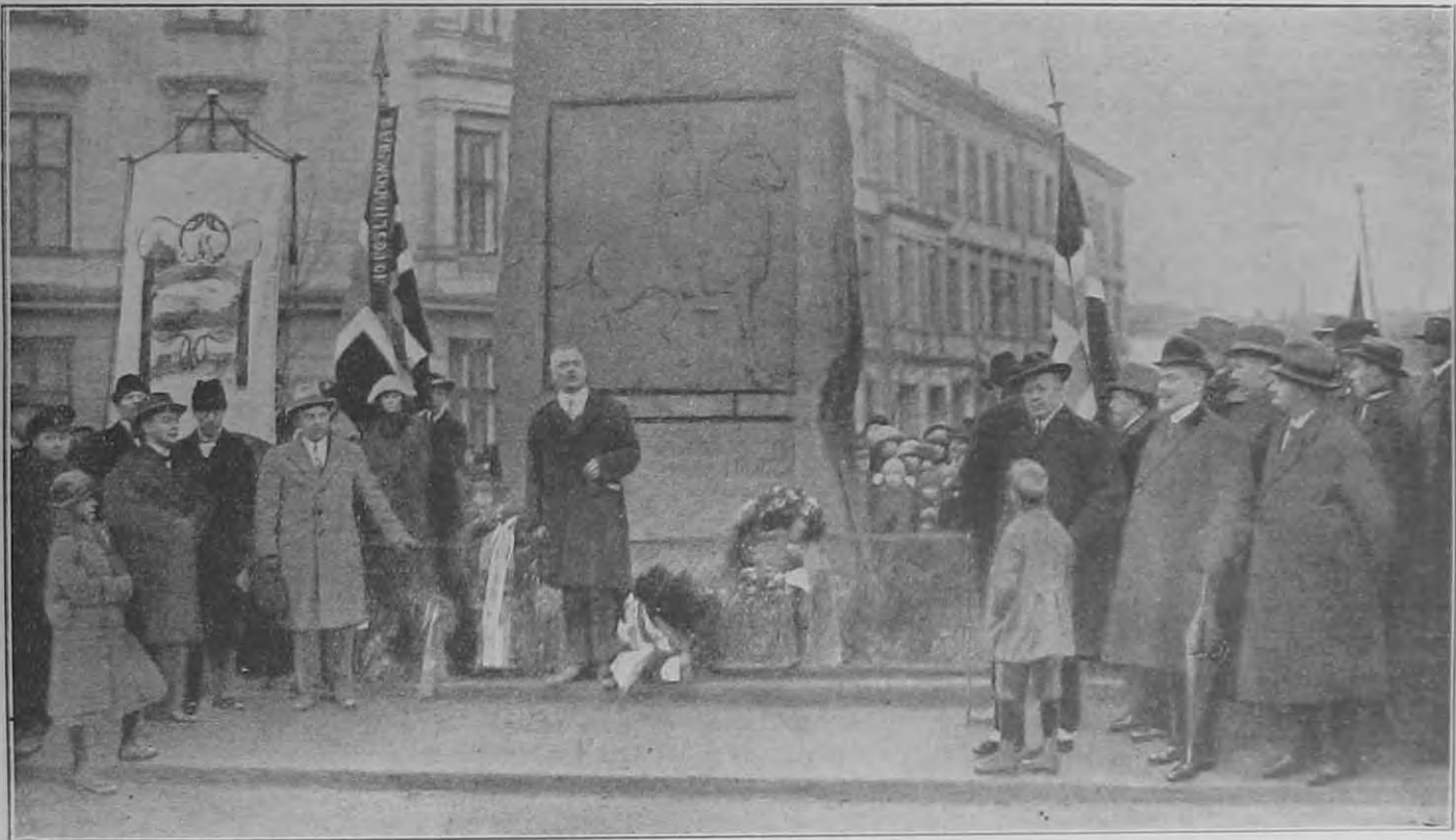
Krisztiania, Norvégia fővárosa, visszakapta régi nevét. Január elsején Kohl tanár Harald király szobra előtt hivatalosan bejelentette, hogy a főváros neve ezentúl Oslo.

„A vezetőnek először is tudnia kell, hogy mit akar, azután pedig szilárd jellemmel állandóan gondoskodnia kell arról, hogy akarata tetté is váljék.“