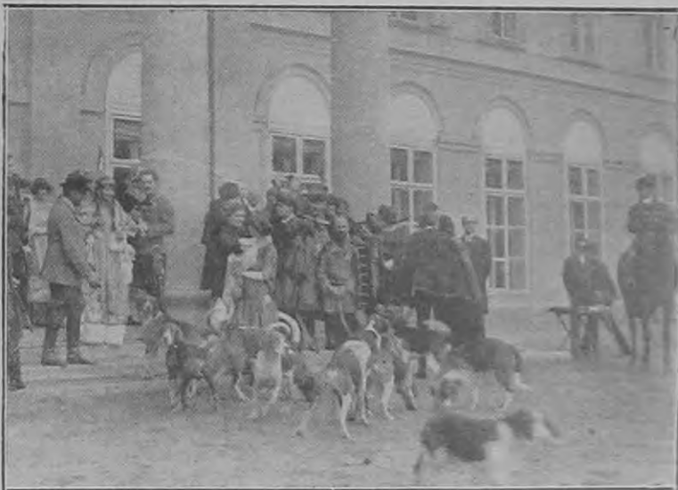
Falka-búcsu a főthi kastély előtt. A vadászati idény vége.

Feltéve ugyanis, hogy a fegyelmi fenyítő hatalomra vonatkozó szolgálati utasítások szerint alkalmazható fegyelmi fenyítés legnagyobb mértéke az adott esetben kielégítőnek mutatkozik, fegyelmi úton torolható meg mindazok a vétségek, (kihágások), amelyekre az alkalmazandó büntetési tétel szerint csupán pénzbüntetés vagy olyan szabadságvesztés-büntetés van szabva, amelynek legnagyobb mértéke hat hónapot, legkisebb mértéke pedig egy hónapot