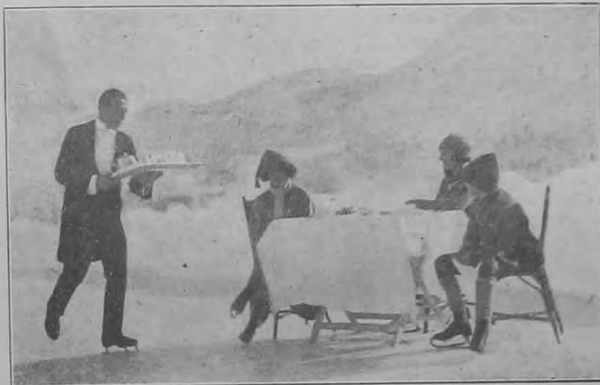
Tavaszi a télben St. Moritzban.

rosokban, különösen Milánóban, Firenzében, Rómában és Bolognában most szinte példásan szigorú utcai fegyelem és rend uralkodik. Egészen különleges szerencse kell hozzá, hogy ezen városok valamelyikében az ember koldussal találkozzon. Nápolyban s Délolaszországban szintén jelentősen javultak ugyan a viszonyok, de úgy látszik, hogy a koldulás itt kiirthatatlan. A sok koldus ma is elég gyakran zaklatja az idegent és bérkocsisok, gyöngy-