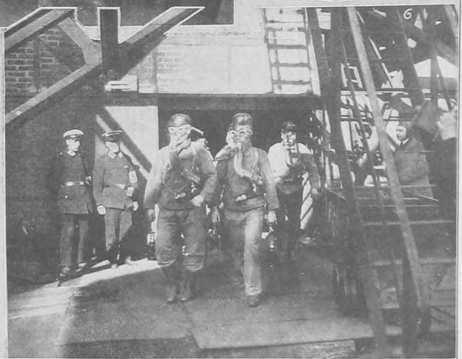
Aktuális képek. — Jókai Mór születésének százados évfordulóját a magyar főváros ünnepelte meg elsőnek; 1. Jókai Mór arcképe életének utolsó éveiből; 2. Rákosi Jenő beszél Jókai sírjánál, a Kerepesi-temetőben; 4. a Jókai-Centenáriumi Bizottsága által terjesztésre elfogadott dombormű-émlék (Borszékeny F. keramiája). — Két kép a borzalmas dortmundi bánya-katasztrófáról: 3. síró asszonyok és gyermekek remegve várják a mentési munka eredményeit a tárna előtt; 6. a fölváltott mentőesapat kimerülten megy pihenni a „Miniszter-tárná”-ból. — 5. Dr. Viroztek György, a Mentőegyesület igazgató- főorvosa összeesett az utcán és hirtelen meghalt.