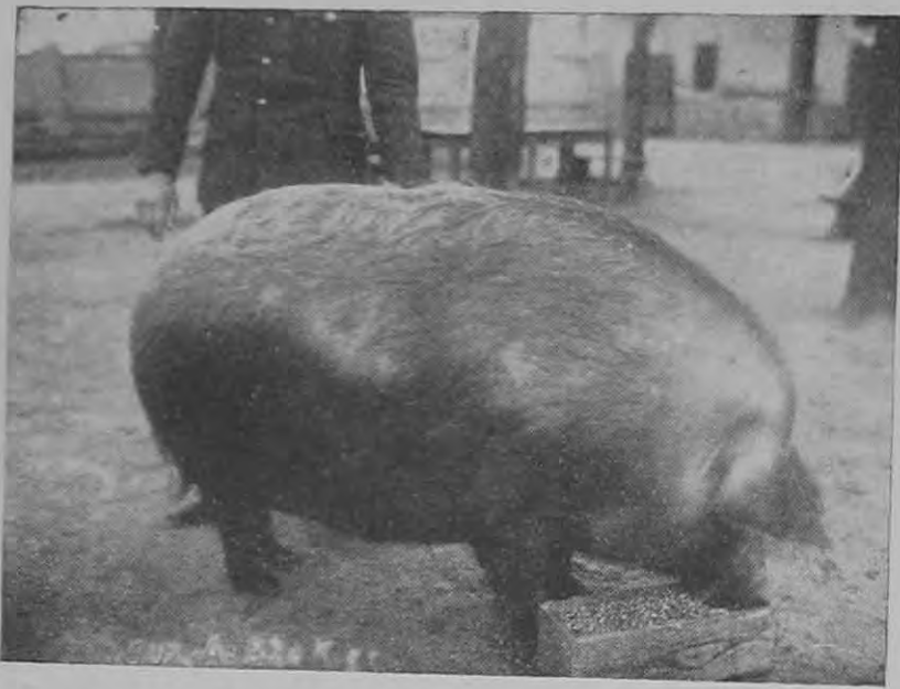
A tatai csendőriskola 320 kg.-ra hizlalta egy sertését. Kiállításon is díjat nyerne vele.

Az erdő lakói ijedten kapták fel fejüket erre a esodálatos kérdésre s az egyik bokorból ujjongva