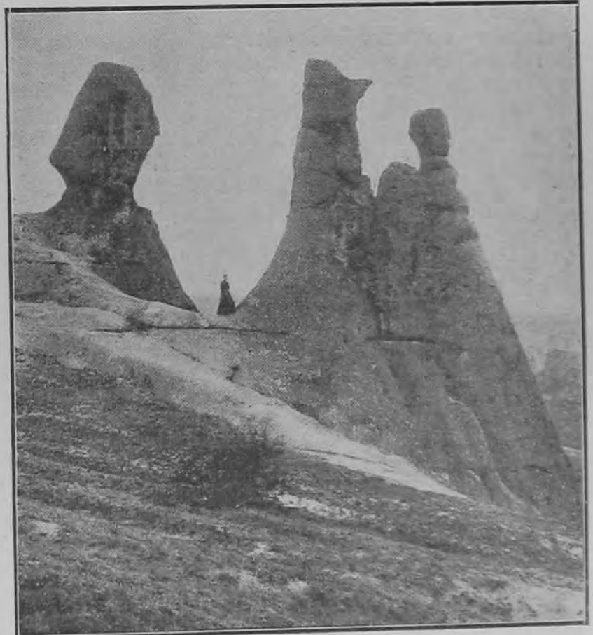
Szikla-esodák: Siroki kövek.

Mert a csendőröknek csak csekély töredéke lett a hadsereg kötelékében hivatásszerűen alkalmazva, teljes értékében kihasználva. A harcoló alakulatokhoz beosztottak, épp úgy szerepeltek, mint a tartalékból bevonulók s így csak a puskaállományt szaporították.