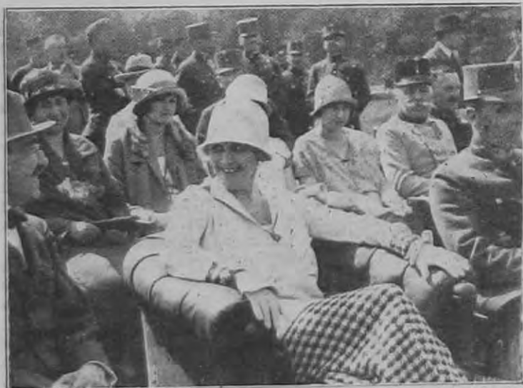
Az Országos csendőrségi lovasverseny: Horthy Miklósné Öfömméltósága a versenyen.

Ha valaki ellen azonban olyan bizonyítékok vannak, vagy ha olyan félre nem magyarázható dolgokat lehet észlelni, amelyek után már nem férhet hozzá kétség, hogy az illető kém és ártalmatlanná tételére más alkalom nincs, akkor iparkodják őt minden körülmények között a legközelebbi csendőrség vagy rendőrség kezére adni. Ilyen esetek lehetnek, ha valaki kémjelentést, kémkedés céljából felvett fényképet lát az illetőnél, vagy ha rajtakapja, hogy titkos katonai parancsokat, utasításokat, szolgálati könyveket vagy terveket akar ellopni, illetve ilyen ellopott dolgokat rendeltetési helyére akar juttatni stb.