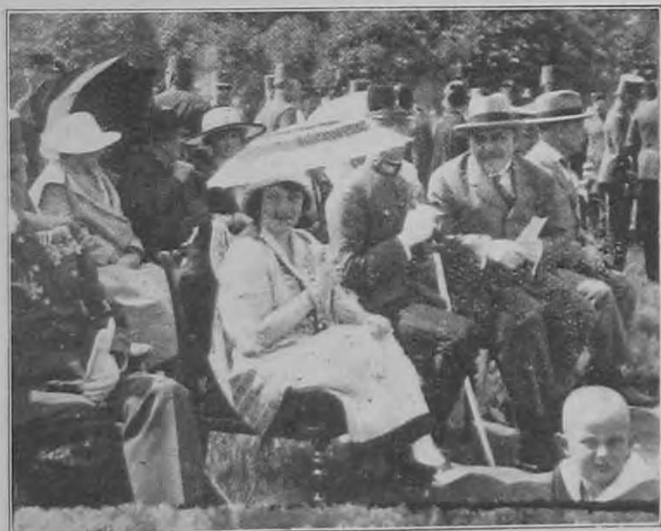
Országos csendőrségi lovasverseny: A közönség egy része.

A 4. pont a 12. §. 3. pontjának a megfelelője, de más szövegezésben és változtatásokkal. Az ellentállás célja mindkét helyen a csendőr szolgálatának a megakadályozása; csak hogy a Tervezet hozzáteszi, hogy a szolgálat fontos és halaszthatatlan legyen. A magyarázat szerint „fontos” az a szolgálati ténykedés, amelynek elmulasztásából a közbiztonságra nagy hátrány, vagy valakire súlyos jogsérelem háramlana. Ezt az indokolást nem tudom helyeselni, mert megfeledkezik arról, hogy a fegyverhasználat alapja az állam kényszerítő joga, és az ezt gyakorló csendőrség tekintélye. A csendőrnek minden jó oka megvan arra, hogy azt a szolgálati ténykedését, amelynek