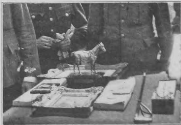
Országos csendőrségi lovasverseny: A díjak.

Ez a végrehajtható rendelet azonban semmiesetre sem valami felsőbb megerősítése az ítéletnek, amire, minthogy az ítélet jogerős, ép oly kevéssé van szükség, mint a felmentésre szóló vagy a bíróság illetéktelenségét kimondó, avagy oly ítélet esetében, amely a vádlottat bűnösnek nyilvánítja ugyan, de rá (például, mivel a vizsgálati fogsággal a büntetést kitöltöttnek vette) még végrehajtható büntetést nem szab. A végrehajtható rendelet tehát csupán közigazgatási jellegű, az ítélet jogerejét semmi tekintetben sem érintő intézkedése az illetékes parancsnoknak, mely intézkedés a polgári bünvádi eljárásban az igazságügyi igazgatás más közegeit illeti. Hogy azt perrendünk az illetékes