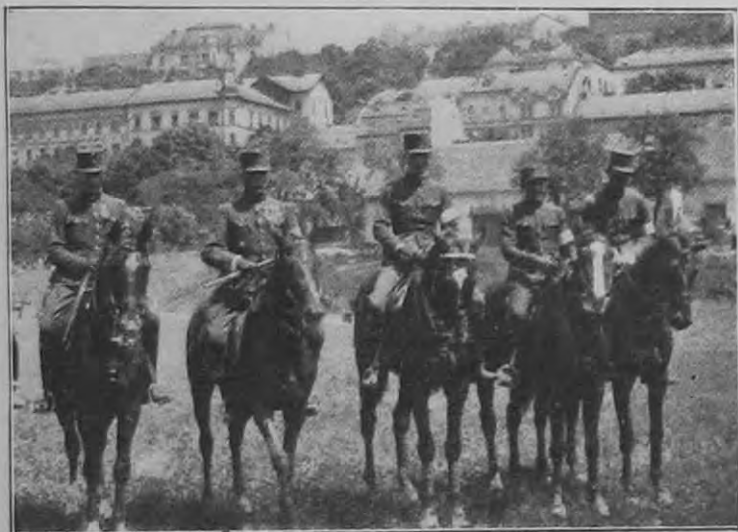
Orsz. csendőrségi lovasverseny: A versenyzők egy csoportja.

A legfelsőbb honvédtörvényszéknek ama semmisségi okok elbírálására kell szorítkoznia, amelyeket a perorvoslat használója kifejezetten avagy világos utalással érvényesített. De ha bárki által emelt semmisségi panasz alkalmából arról győződik meg a legfelsőbb honvédtörvényszék, hogy a honvédtörvényszék a honvéd büntető bíraskodást helytelenül állapította meg (358. §. 6. pontja), vagy hogy a törvény vala-