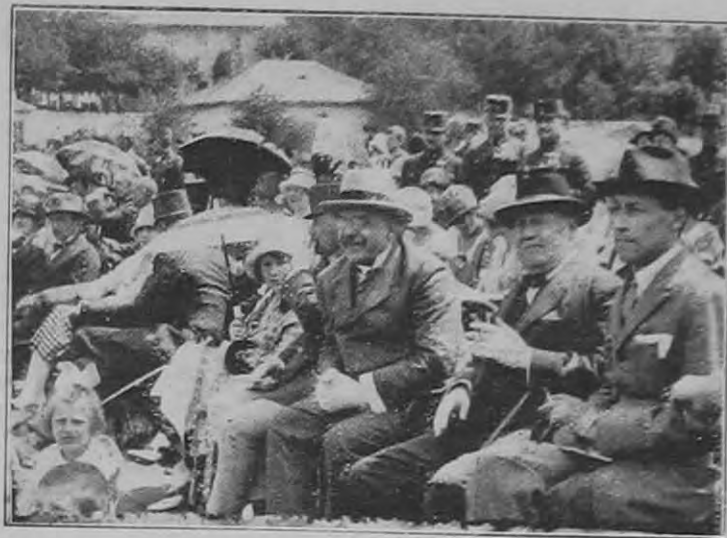
Országos csendőrségi lovasverseny: A közönség egy része.

Ha valaki ismerős egyénben sejt kémeket és erre már esetleg bizonyítékai is vannak, habozás nélkül tegyen jelentést közvetlen előljárójának (tisztnek, hivatali főnöknek) vagy a legközelebbi hatóságnak (csendőrségnek) és közölje velük a gyanuokat, illetve adja át a kezében levő bizonyítékokat.