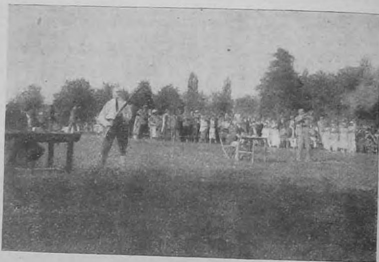
Üveggömb-lövészet a gödöllői sportversenyen.