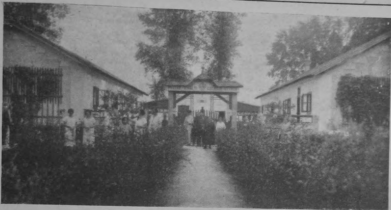
A hévizi esendőr-otthon.

ama felfogás között, mely a becsület, mint életelem szükségességéről a polgárság és a hadsereg körében uralkodik.