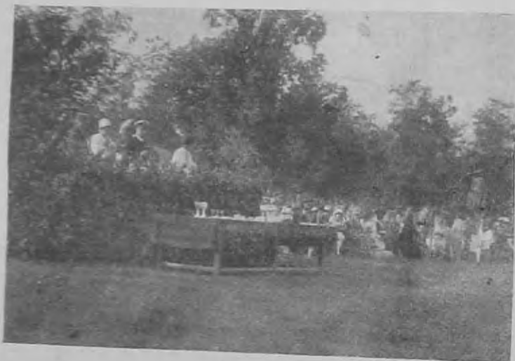
A kormányzó úr a gödöllői sportversenyen.