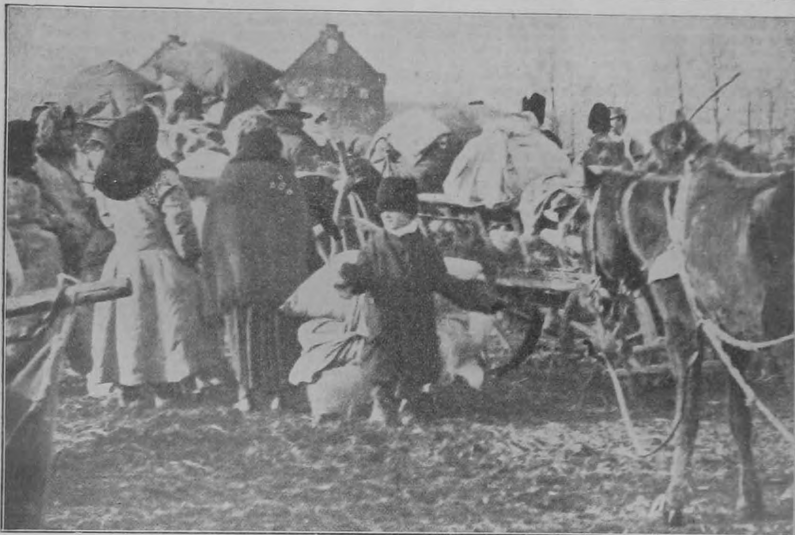
Képek az alföldi nagy árvizről. A trianoni határon túli lakosok, akik az ár elől hozzánk menekültek.

nak benne, hogy a csendőr adós nem maradhat. Ez a bizalom tehát nem is a személyének, hanem a testületnek szól. Bajtársai előtt titkolja zilált anyagi helyzetét s azoktól nem meri kölcsönkérni megtakarított pénzeszközüket.