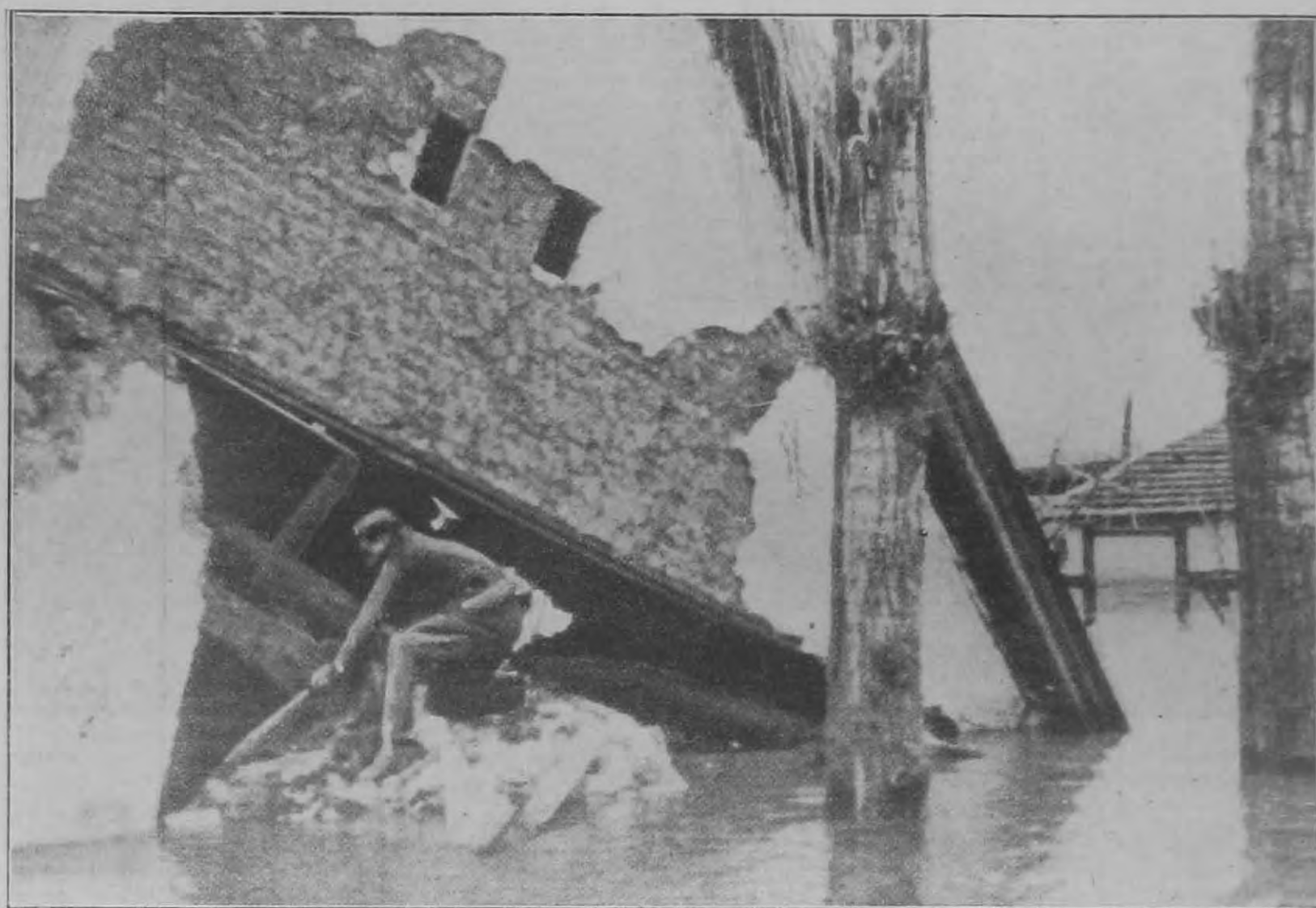
Képek az alföldi nagy árvízről. Egy, az árviztől összedőlt ház. Vészto községben.

Maradjunk azonban az alkohólnál, a többihez, hála Istennek, nekünk, esendőröknek, semmi közünk nincs. Az alkoholhoz azonban — sajnos — van. Mert mi sem tudunk neki ellentállani, ha elbűnk kerül. Sőt egyesek azt sem várják meg, hogy elbűnk kerüljön, hanem mennek utána maguktól. Vannak, akik csak étkezés után isznak meg egy-két pohár bort, vannak aztán olyanok, akik napközben is felhajtanak egy-egy poharat és vannak végül olyanok, akik a nap és hold járására való tekintet nélkül és mindenkor megisszák, csak hozzájussanak. Az utóbbiak száma éppen közöttünk — szerencsére — csekély.