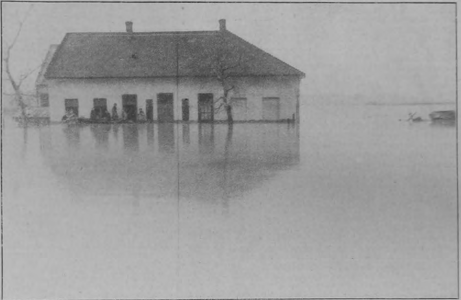
Képek az alföldi nagy árvizről. Vasúti őrház víz alatt a Sarkad—Gyula közötti vasútvonalon.

A napokban olvastuk, hogy Oroszországban a szovjetkormány új „véderőtörvényt” léptetett életbe. Elrendelte az általános hadkötelezettséget 5, azaz öt évi tényleges szolgálattal, de bizonyos katonai kiképzésen már tizennyolc éves korától kezdve mindenkinek részt kell vennie, úgy, hogy a kötelező hadgyakorlatokkal együtt tulajdonképpen mindenkinek hat évet, vagyis éppen kétszerannyit kell szolgálnia, mint nálunk a háború előtt és hozzá egy olyan hadseregben, amelyben bottal fenyítene! Schwartz úr most valószínűleg megint a túlzó militaristák közé tartozik Oroszországban. No, igen, hiszen mindjárt kezdetben is úgy gondolta, csak elfelejtette mondani, hogy ő is kizárólag csak magyar katonát nem akart látni. Az orosz, az más.