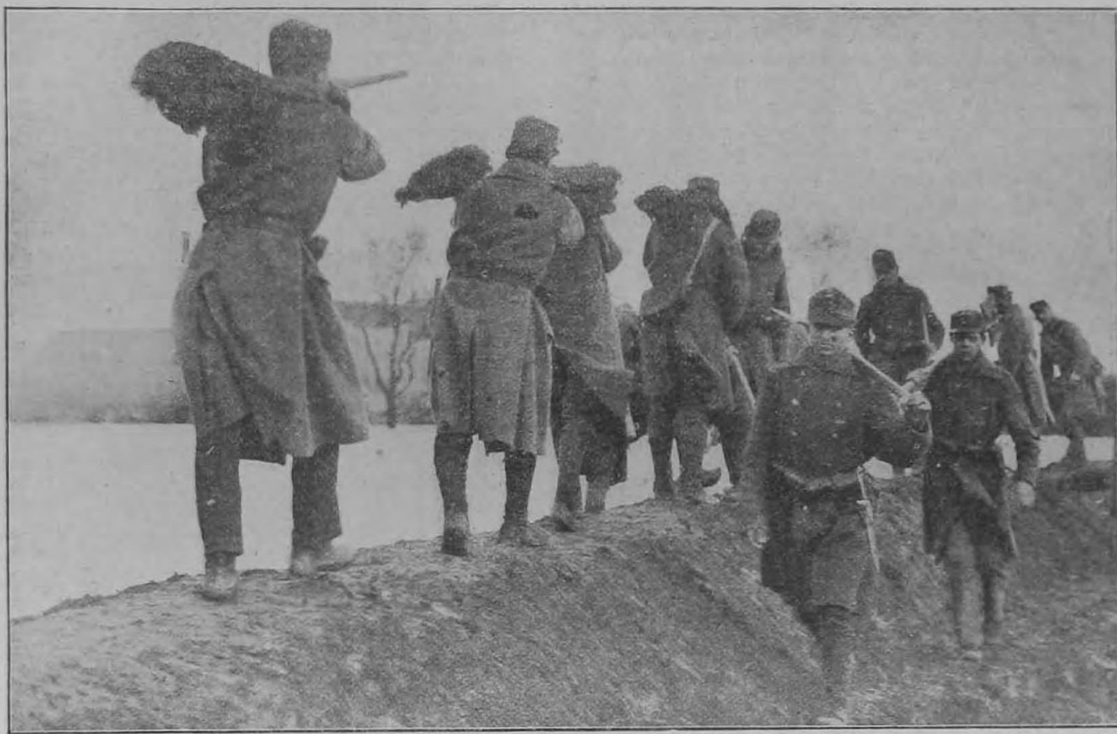
Képek az alföldi nagy árvízről. Utászok erősítik a gátakat.

csendőr fegyverét vagy karja legalább is annyira ellankad, hogy a megtamadott csendőr fegyverét a támadó kezéből könnyen kiránthatta volna. Az utasítás a szuronyt csak akkor jelzi kevésbé veszélyes fegyvernek, ha karok vagy lábszárak ellen van irányítva; dulakodáskor azonban a szurony használatának is lehet végzetes következménye, ha pl. a karcsontról lecsúszik s a támadó mellét éri.