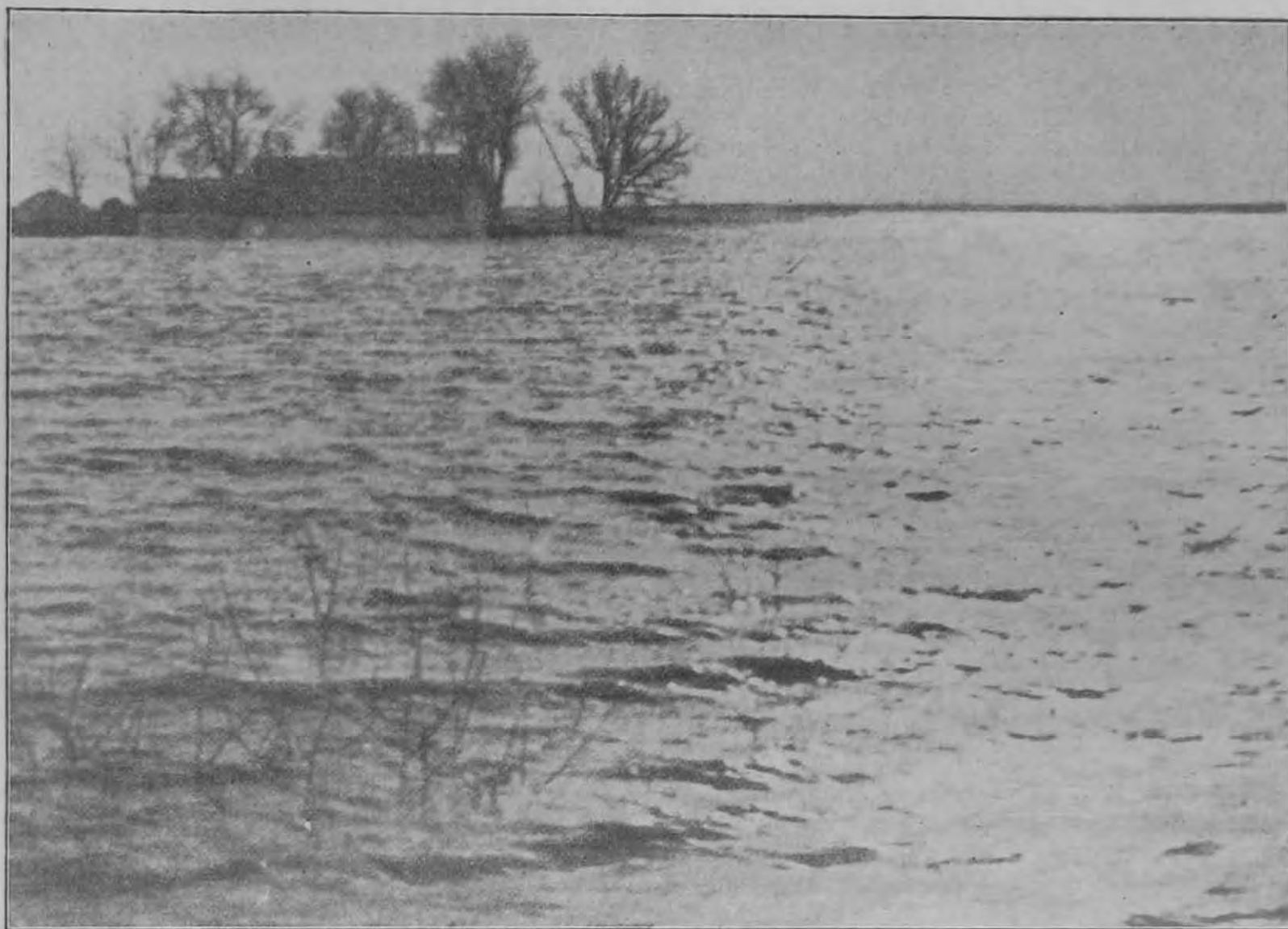
Képek az alföldi nagy árvízről. Az elöntött tanyavilág a Körös mentén.

Vonalban az emberek, illetve a szintén vonalban sorakozott vagy gyülekezett alegységek egymás mellett állnak.