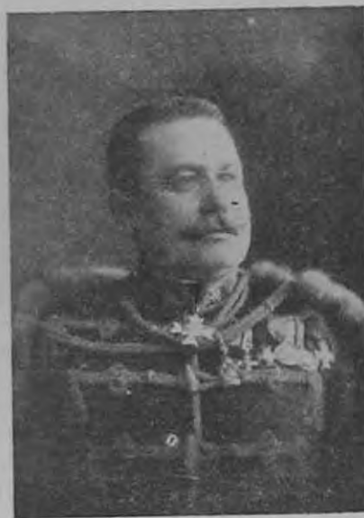
Fery Oszkár, altábornagy