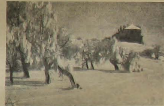
Galyatető — menedékház.