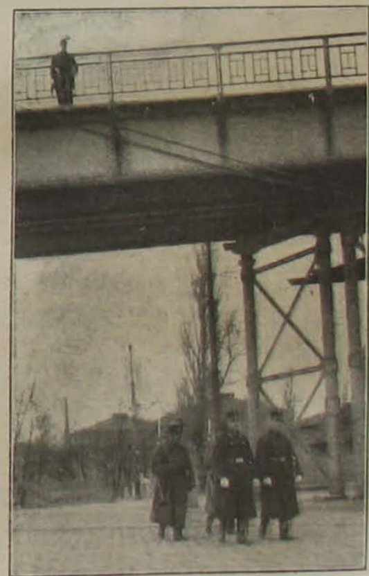
A csendőrség Budapestén: március 7-én a budapesti rendőrséget támogatta.