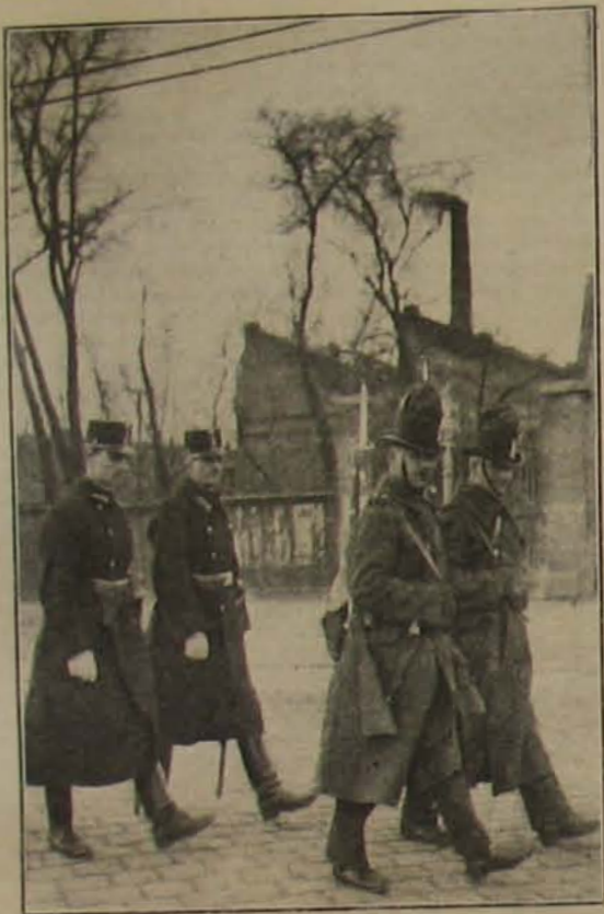
A csendőrség Budapestén: március 7-én a budapesti rendőrséget támogatta.