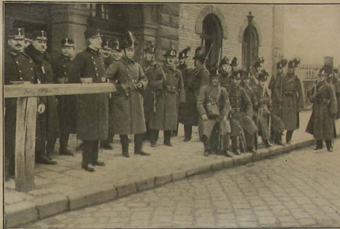
A Magyarországi Szocialista Párt azelőtt fenyegetőzött, hogy Budapesten március 7-én nagyarányú tüntetést fog rendezni. A rendőrség a felvonulást nem engedélyezte, a kormány pedig megtette a szükséges intézkedéseket, hogy minden rendezés eszrajában elfojtassék: a főváros fontosabb pontjait csendőrséggel megerősített rendőrség szállotta meg.

A munkára, szigorú kötelességtudásra, az igazmondásra és lemondásra.