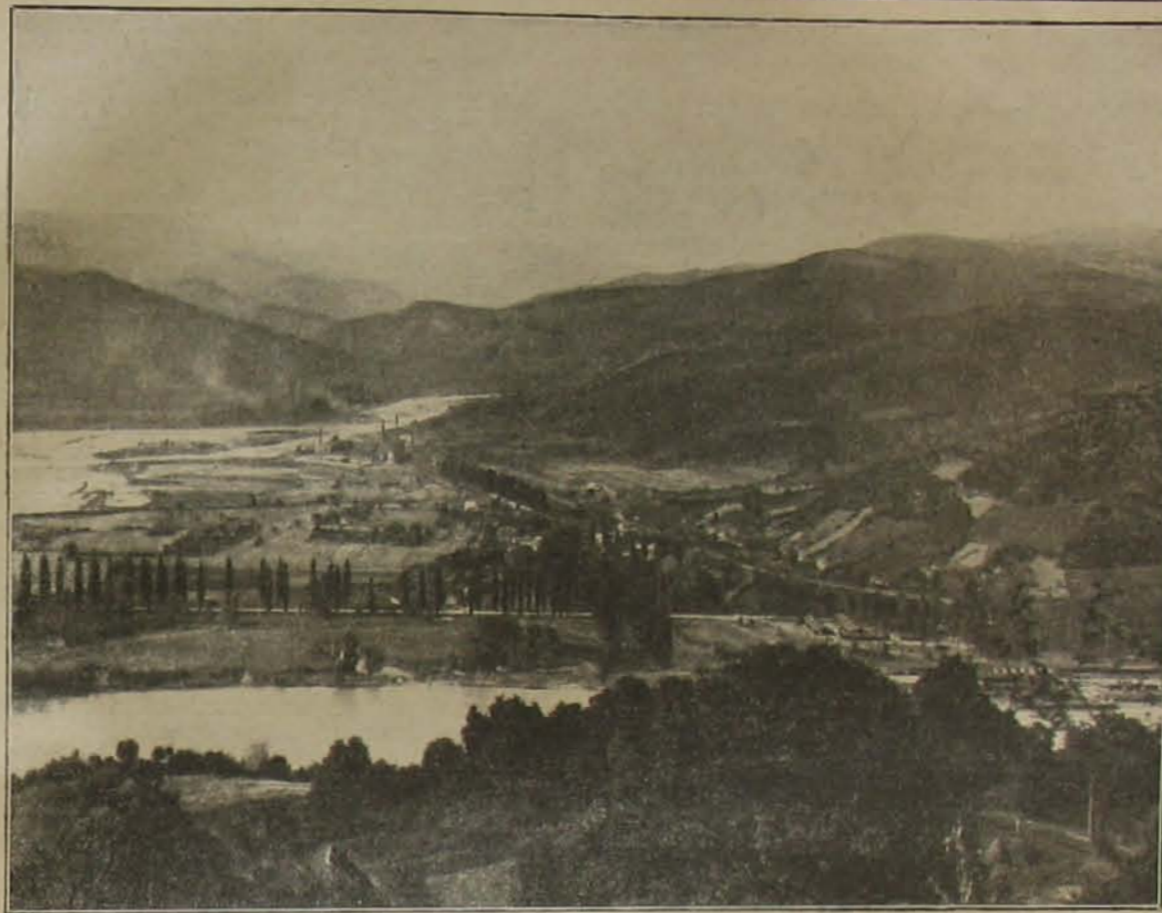
Amint vissza kell szerezniük: a Csorna völgye.

Arról nem is beszéltek, hogy még három szakaszos szákaddal sem volna a géppuskásszervezet megoldva. Köztudomású, hogy a győztes államok