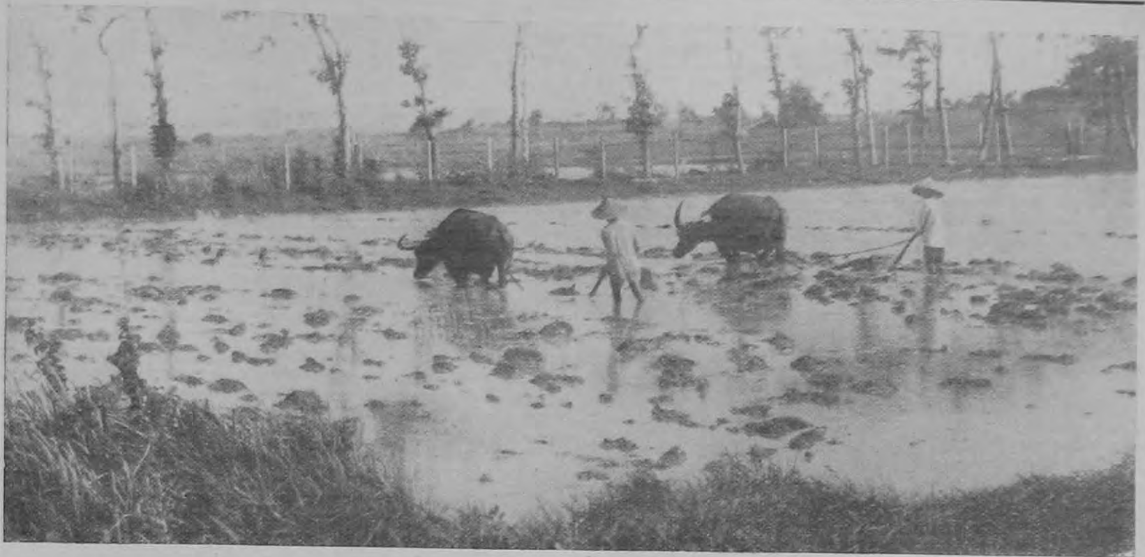
A Filippini-szigeteken bivalyok húzzák a fackét a vízzel elárasztott rizsöldeken.

két szobából, egy konyhából és egy éléskamrából állott. Az éléskamrába a konyhából lehetett bejutni és az egy, kb. 50 cm. széles és 60 cm. magas szelelőablakkal volt ellátva. Az ablakot kívülről kinyitni nem lehetett, miért is a zaj elkerülése végett egy ruhadarabbal azt benyomták. Az ablak belülről fogantyúzárral volt ellátva, mit a betörés következtében keletkezett résen át kinyitottak. A kamrába a fiú bemászott és az ott, valamint a konyhában talált lisztet, cukrot, ruhaneműt stb. a künn levő anyjának egymásután kiadta.