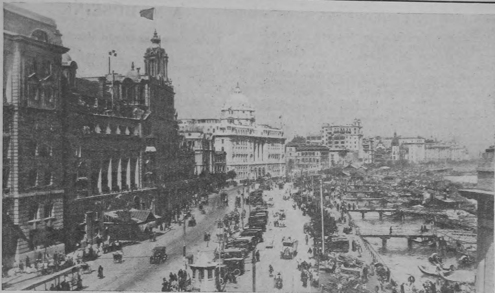
Ahol a kínai polgárháború folyik: Az európai negyed Shanghaiban.