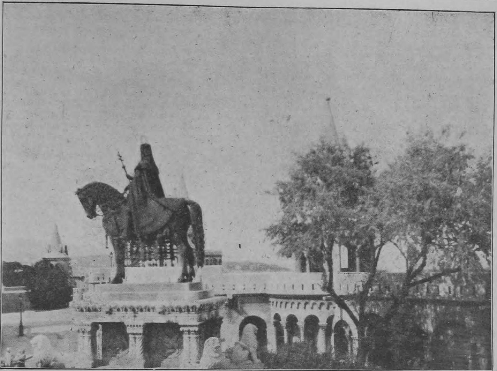
Képek a Szent István-napi körmenetről: Szent István király szobra.

állapíttassék meg s külön honorálja azt a kétségtelesenül nagyobb követelményt, amelyet a csendőr legénységgel szemben mindenféle más hasonló állami alkalmazottal szemben támasztani kell. Ennek bővebb megindokolása túlhaladná cikkem kereteit, de tudom, hogy nem is szükséges, annyira közismert. Ismétlem azonban, hogy végleges megoldást ez sem jelentene. A végleges, radikális és feltétlenül célravezető megoldást én a sorozási rendszernek a csendőrségnél való meghonosításában látnám.