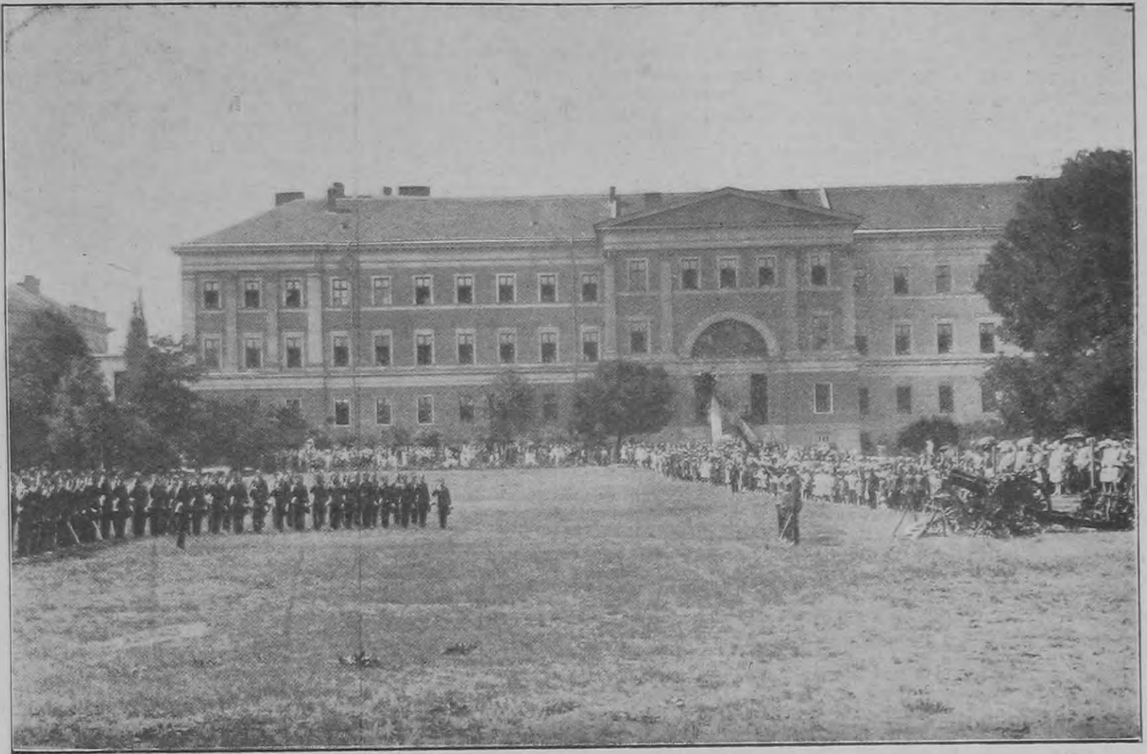
Képek a Ludovika Akadémia tisztavató ünnepélyéről: Az újonnan felavatott főhadnagykok leteszik az esküt.

A felvidéki kis város, amelyben akkor mint zászlóaljsegédtiszt szolgáltam, népes, mintegy ötezer szavazóval rendelkező, erősen ellenzéki hangulatú választókerületnek volt székhelye. Az igaz, hogy régebbi választásoknál ott is kiütöttek néhány zápfogat, berepesztettek néhány fület vagy száját és meglékeltek egypár koponyát, a helyzet mindamellett mégsem volt annyira veszélyes, hogy a karhatalmi szolgálat ellátására a mi zászlóaljunk és néhány csendőr ne lett volna elegendő.