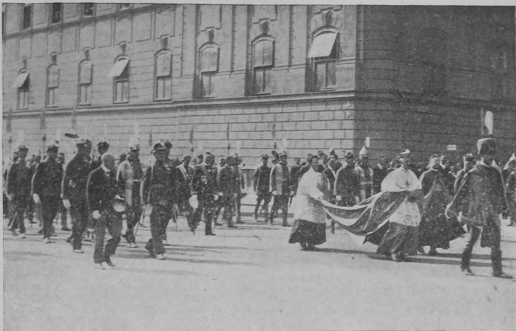
Képek a Szent István-napi körmenetről: Kormányzó Úr Öfőméltósága a körmenetben. Elöl a pápai nuncius halad.

hez szükséges minden segédeszközt könnyebb hét példányban megvenni, mint harmincban: egyszóval azt hiszem, hogy centralizált elhelyezés esetén egy-két év alatt a csendőriskoláknak jelenlegi szegényes, „házilag és költségmentesen“ elkészített felszerelését legalábbis tűrhető felszereléssel lehetne felcserélni. Addig azonban, amíg mindennel harminc külön-külön iskolát kell ellátni, erről aligha lehet szó.