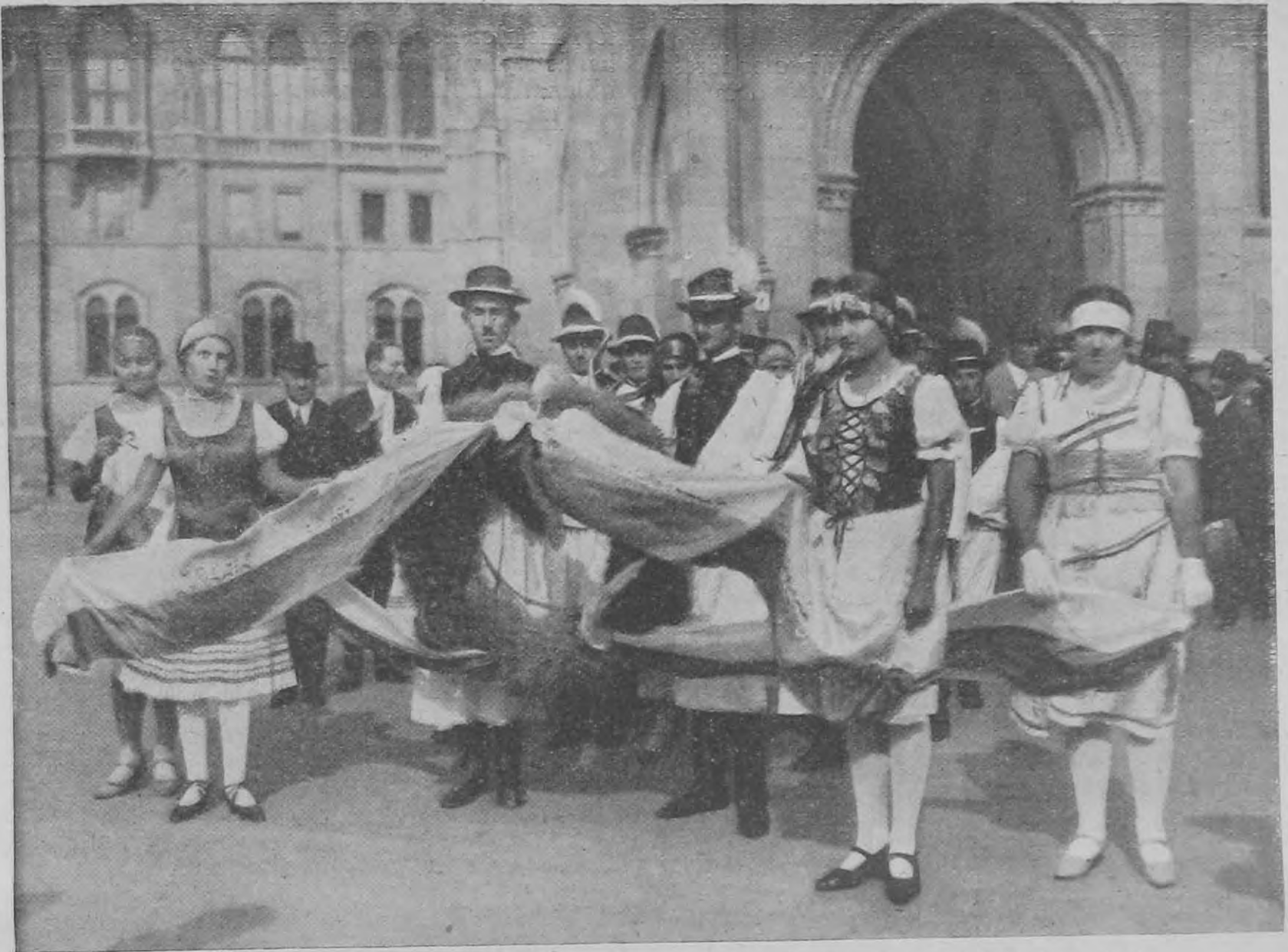
Képek a Szent István-napi körmenetről: Szentés küldöttsége a bizakalászból font koszorúval.

Nálunk úgy gondolnám a sorozást gyakorlatilag megvalósíthatónak, hogy a szárnyparancsnokok — az őrsparancsnokok javaslatának meghallgatása után — kijelölnék azt a sorozás alá kerülő legénységet, amely csendőrségi szolgálatra önként jelentkezett, illetve amely erre a szolgálatra alkalmasnak látszik. Ha évenként átlag 1500 embert számítunk, akkor kereken 100 szárnyra szárnyankint minden évben 15 ember, őrsönkint tehát 1—2 ember jutna. Minden szárny kétszerannyi embert hozna javaslatba, mint amennyire szükség van, hogy válogatni lehessen.