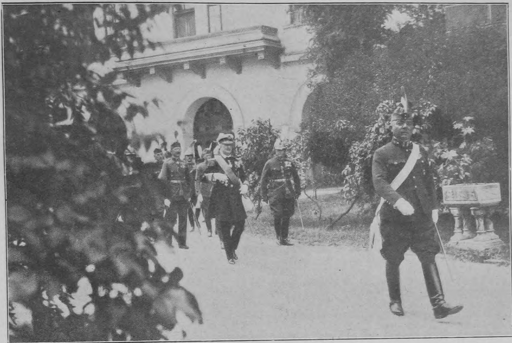
Képek a Ludovika Akadémia tisztavató ünnepélyéről: Kormányzó Úr Öféméltósága érkezése.