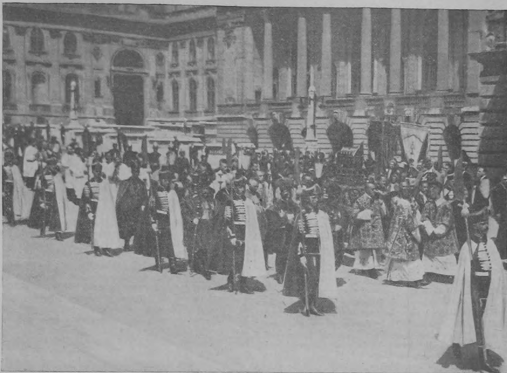
Képek a Szent István-napi körmenetről: A körmenet elindul a királyi palotából.

mális áldozatot jelentene, amelyet a közbiztonság érdekeivel könnyen meg lehetne indokolni, elvégre az ország közbiztonsága nem csak a csendőrség belügye, különösen háborúban nem. És azután: a magyar nép olyan kiváló katonanyag, hogy egy-néhány száz kiválogatott ember elvonását a honvédség igazán nem érzi meg; marad még elég kiváló ember a számára is, akit éppen olyan nyugodtan ki lehetne válogatni.