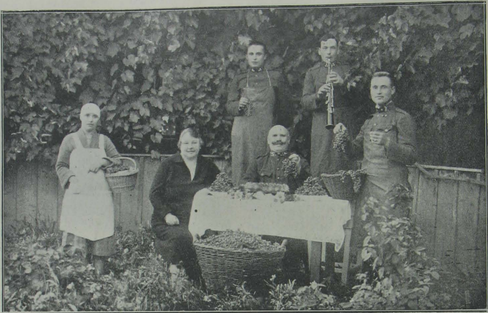
Szüret a medgyesházai örsön.

azonban a lakástulajdonos a nála megszállt idegent, az előljárásnál bejelenteni.