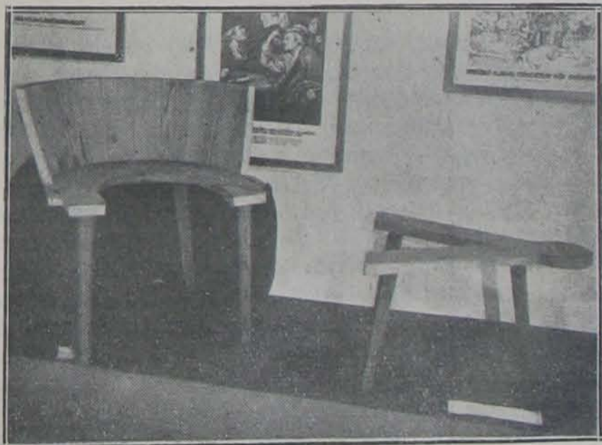
A népegészségügyi kiállításról: ... régi időkben készített, de sok helyen még ma is használatban lévő szülőszékek állanak egy másik helyen ...

Most találkozunk sétánk közben a kiállítás legfantasztikusabb figurájával. Képét fekete álarc borítja, fején kerek