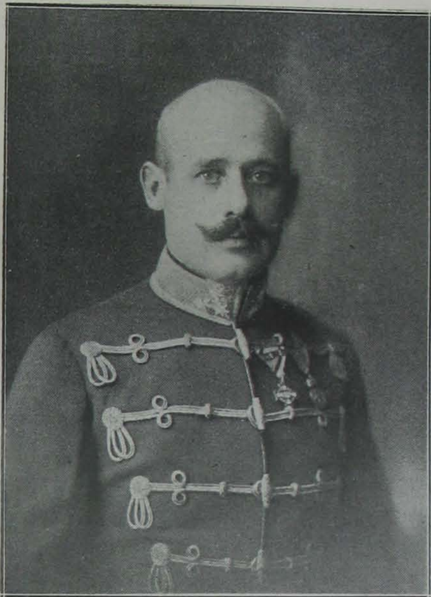
Monostori Erreth Aladár ezredes a m. kir. csendőrség felügyelőjének helyettese.

Végezetül pedig, különösen altiszt bajtársaim figyelmét szeretném valamire felhívni. Cikkemben sok helyütt nem kerülhettem el, hogy egyes meglévő dolgainkról, rendszereinkről és módszereinkről kedvezőtlen véleményt nyilvánítsak. Aki valami újat akar eladni, annak a régít ócsárolnia kell, hogy a maga portékáját dicsérhesse. Hogy aztán igaza van-e vagy nincsen, azt majd csak a portéka mutatja meg. Hogy nekem is igazam van-e vagy nincsen, annak az elbírálása nem reánk tartozik. Egyet azonban hangsúlyozni ki-