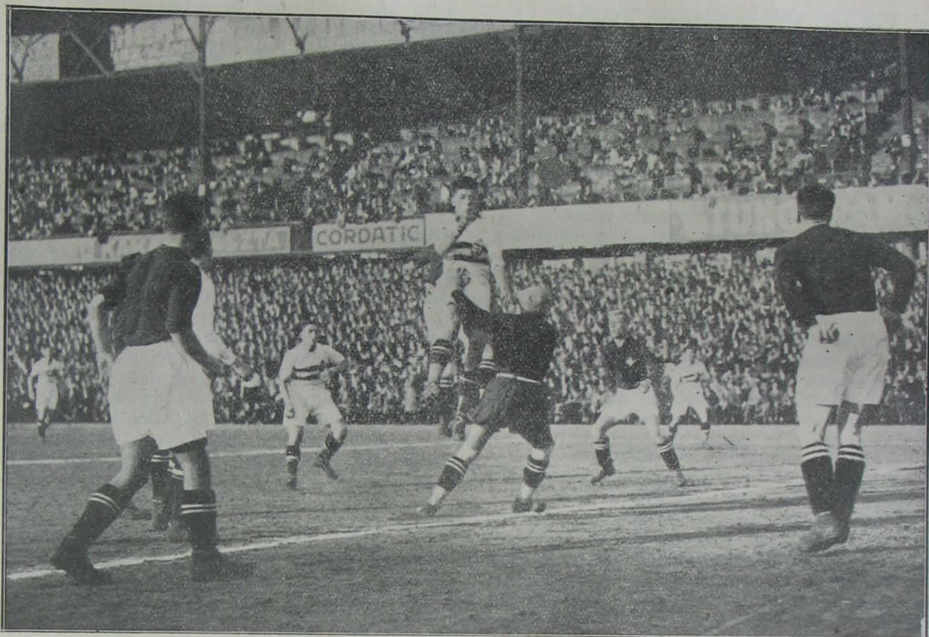
Magyarország—Svájc 3:1. Jelenet a mérkőzésről.

ködés helyességére tanít). Esztetika (a szép megismerését célozza). Jog. Higyenia (egészségtan a testnevelés szempontjából). A módszereket adó tudományok közül a következő tudományokból kivont ismeretekre lehet szükségünk: a pszichológia (lélektan) és a testnevelés szempontjából az anatómiai (biológiai) és fiziológiai (élettani) ismeretekre.