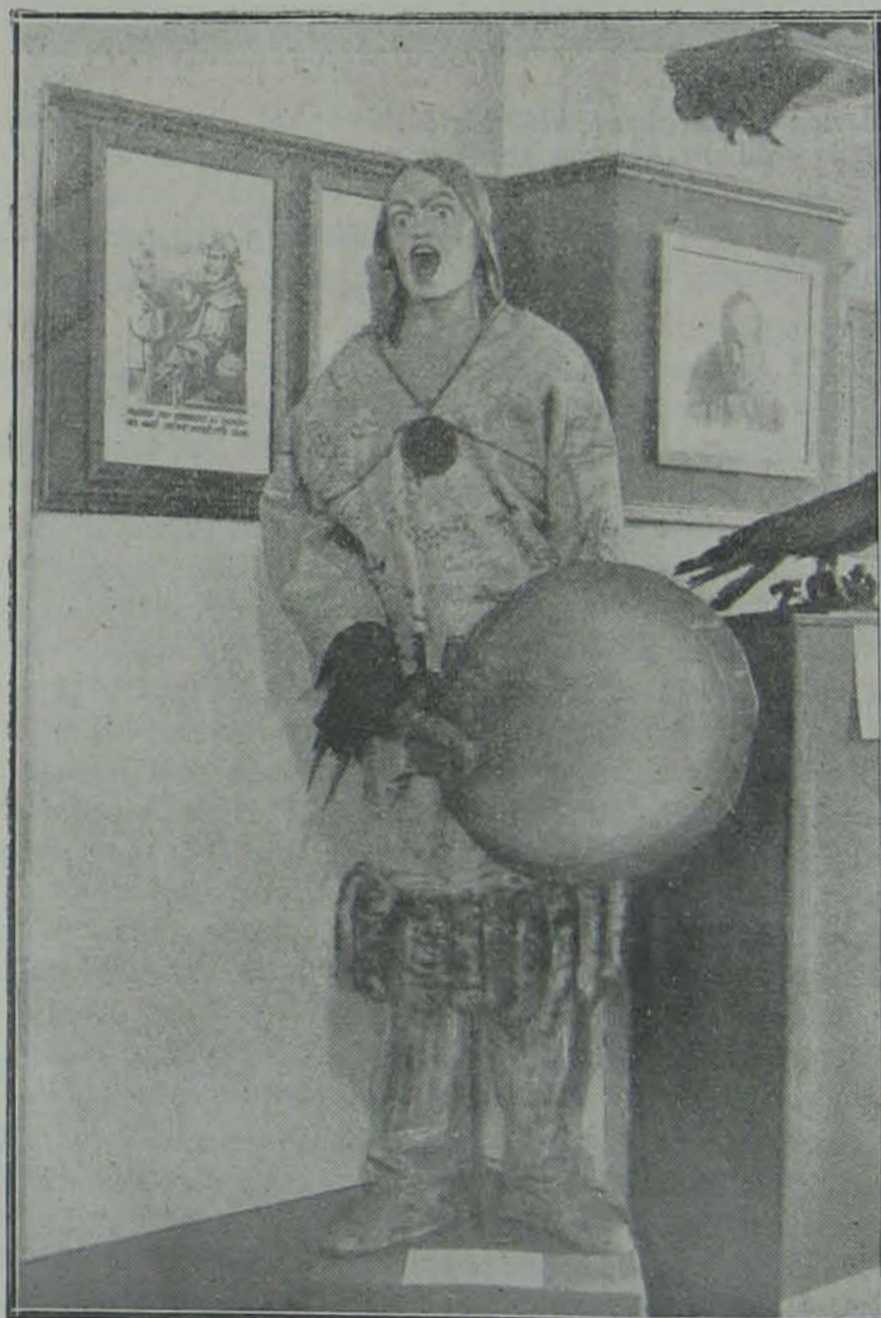
A népegészségügyi kiállitásról: . . . ez a híres Gold Samán.

Szeretném ha ezek valamennyien itt lennének most ebben