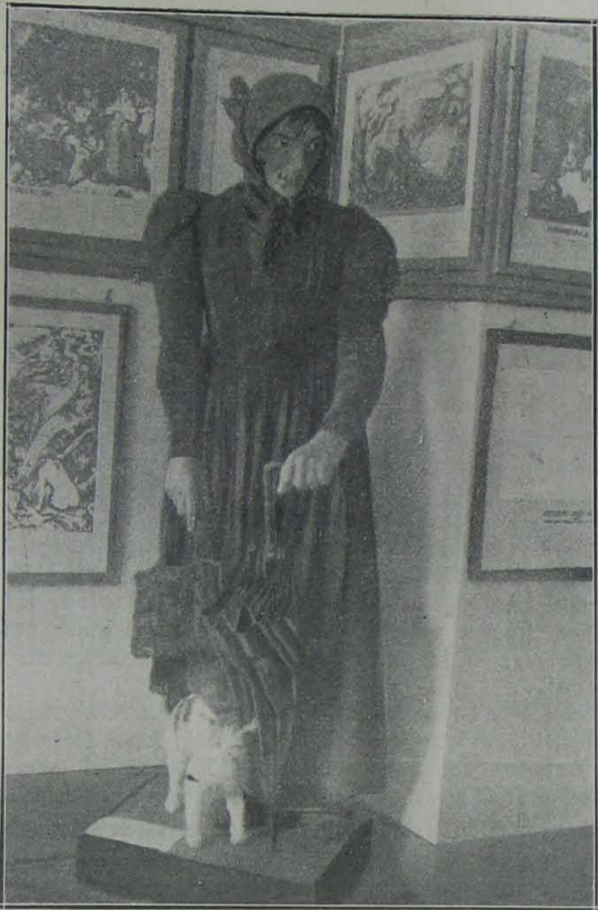
A népegészségügyi kiállításról: ... ahol egy ismerős alak áll utrakészen, kezében esernyő, szatyor ...