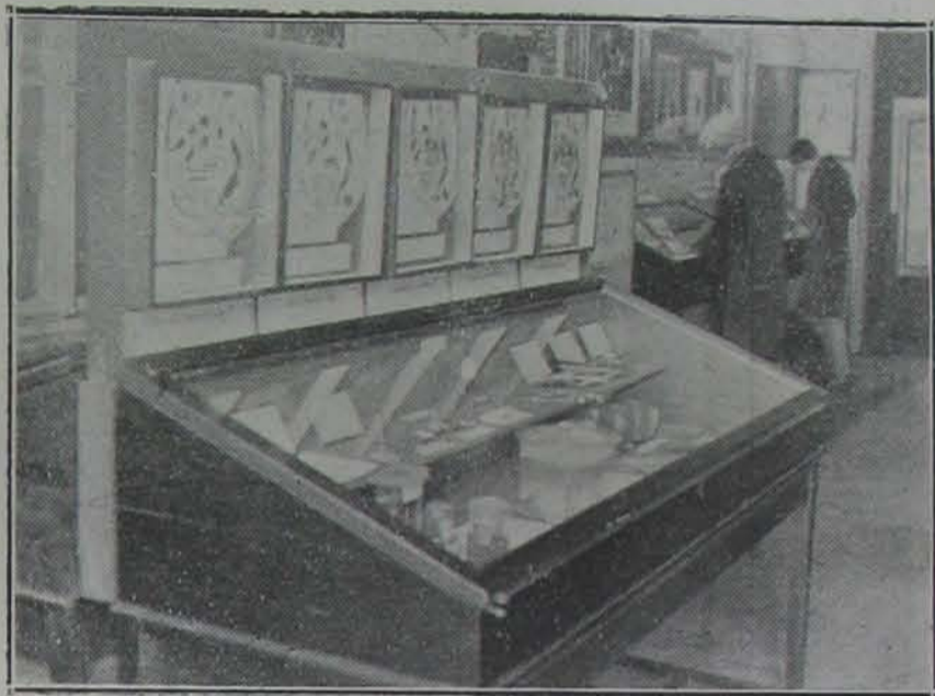
A népegészségügyi kiállításról: ... de hátra van még egy üvegszekrény, ez előtt feltétlenül meg kell még állanunk ...

hoz vagy a Vera nénékhez, akkor jegyezzék meg bucsuzóul a büntetőtörvénykönyv 285. §-át, mely azt mondja: »A teherben lévő nő, aki méhmagzatát szándékosan elhajtja, megöli vagy azt más által eszközölteti, ha házasságon kívül esett