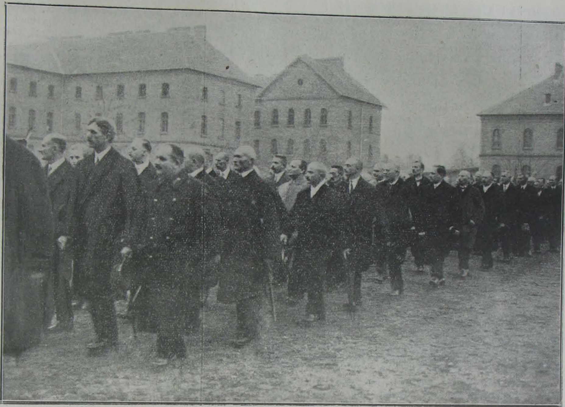
A volt 1. népfelkelő gyalogezred emléktáblájának leleplezési ünnepélyéről: Öreg harcosok diszmenete

másodcsendőri szolgálatra drágán fizetett és kiképzett, nehezen hozzájutható ember anyagot alkalmazunk, b) nehéz az önkéntjelentkezés útján való toborzás és ezért állandóan hiányaink lesznek. Ezért ezt a kérdést t. i. a kiegészítés kérdését a százados ur egyedül és véglegesen a sorozási rendszernek a bevezetésével látja megoldhatónak. Az indokai igen helytállóak és csak az ő szemszögéből nézve, a dolog nem is volna aggályos. Érdekes azonban Kovarcz százados urnak a folyó évi 1. számú Csendőrségi Lapokban kifejtett nézeteit is a mérlegbe állítani, mert ekkor már más oldalról is látjuk a kérdést.