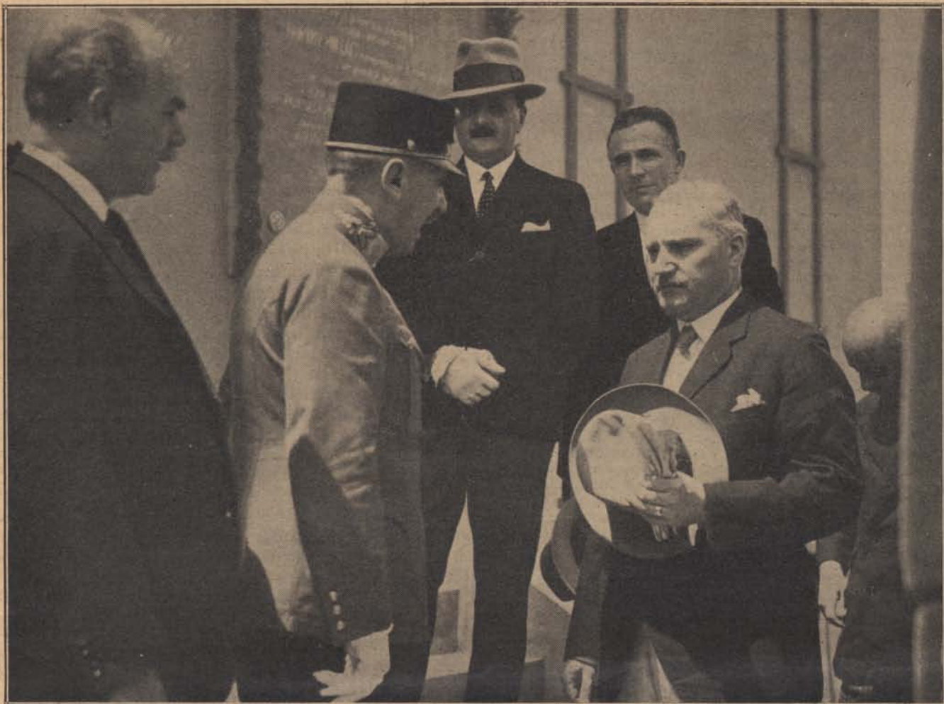
A balatonfüredi csendőrségi gyógyház megnyitása: Schill Ferenc tábornok, a csendőrség felügyelője a gyógyház felavatási ünnepélyén üdvözli a belügyminisztert megérkezése alkalmával.

füredi csendőrtiszti és legénységi gyógyház Főméltóságú Asszonyom nevét viselheti. Engedje meg, hogy a mai felavatató ünnepen ezért a kitüntetendő kegyéért az egész magyar királyi csendőrség, legbensőbb háláját és hódolatát tolmácsoljam. Ez az emberbaráti intézmény mindig büszke lesz a homlokzatán ragyogó névre s a benne gyógyulást kérelmők és találók a mélységes hála és tisztelet érzéseivel emlékeznek majd mindenkor Főméltóságú Asszonyomra, a legremesebb, legjóságosabb első magyar asszonyra. Scitovszky Béla belügyminiszter."