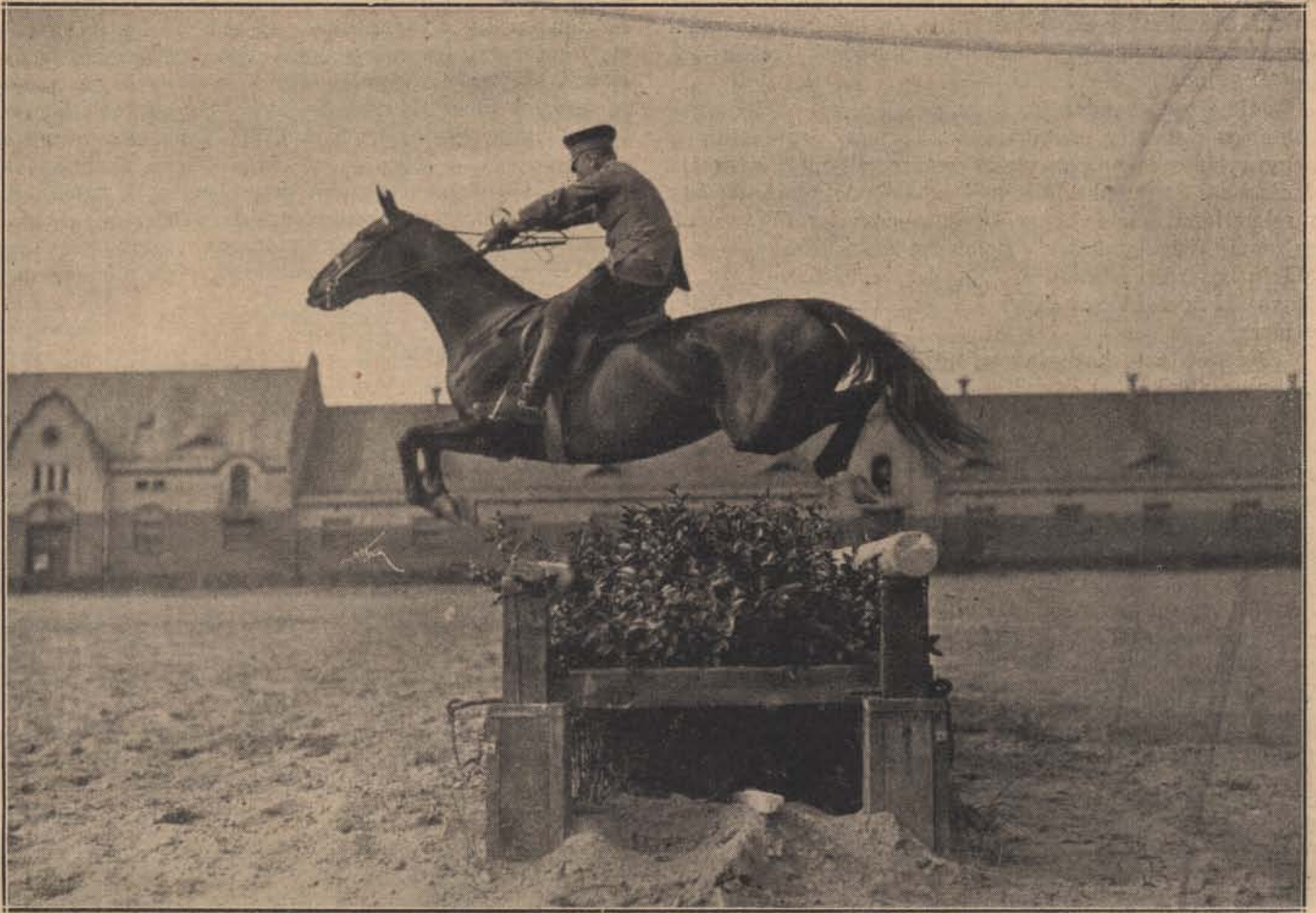
Mozzanat egy német csendőrségi lovaglőiskolából.

nál több pénzt és nagyobb batyut látott és mert azok a vonat indulásáig nem mertek a váróterembe bemenni, gyanúsnak találja a cigányok viselkedését. Ő útközben is szemmel tartotta a cigányokat — mondta — azok egy másik kocsiban utaznak, de nem valószínű, hogy Szegedig, bár a jegyük odáig szól. A fiatalember azt is mondotta, hogy örül neki, hogy csendőrökkel találkozott, legalább a gyanúját azokkal közölheti, mert nem hagyja nyugodni a lelkiismerete, hogy esetleg bűnös cigányok szökését segítette elő.