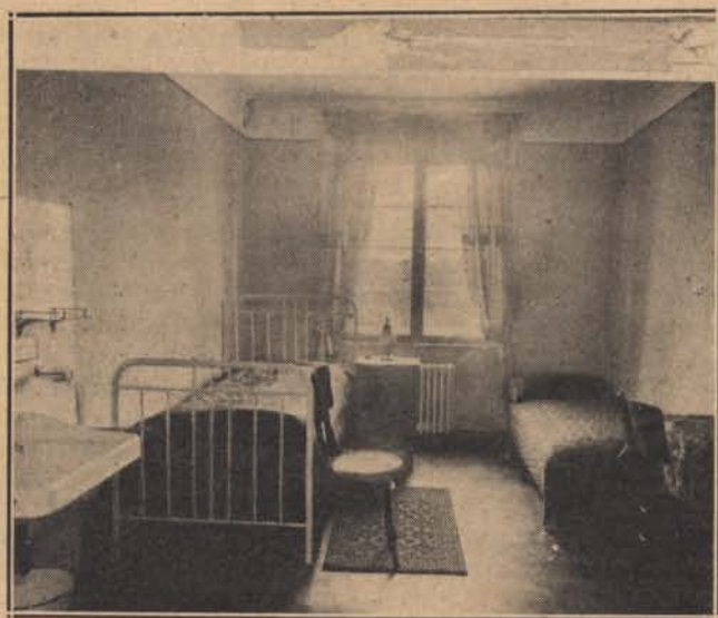
A balatonfüredi csendőrségi gyógyház: Egyágyas szoba.

A csendőrök betarolták a cigányokat a közelben lévő csárda udvarára, ott elszedték a lövő-, szűrő- és vágószerszámukat, kimosták és ideiglenes kötéssel ellátták a sebeiket, azután pedig bekísérték őket Battonyára, a járásbíróház fogházába.