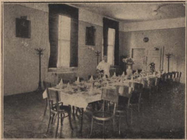
A balatonfüredi csendőrségi gyógyház: Étterem.

gányok kocsijai egy izben megállottak s hogy a kocsikról többen leszállottak, de hát a gyalog más irányba menekülő egységekkel most nem törődhetek, mert céljuk az volt, hogy előbb a kocsikon lévőket tegyék ártalmatlanná.