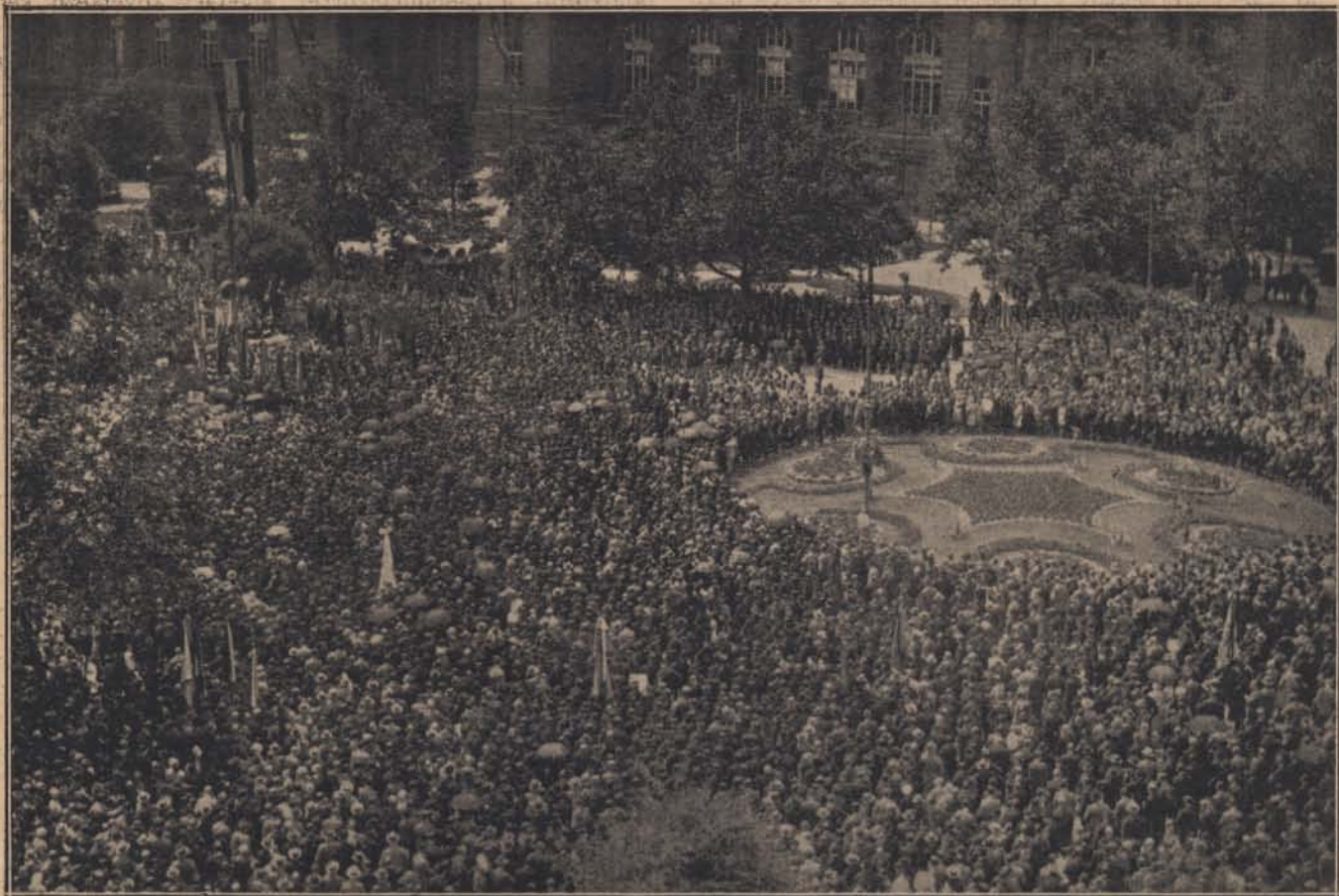
Tiltakozó gyűlés a trianoni békeszerződés aláírásának üzenék eltorzításán — június 4-én — a budapesti Szabadság-téren lengő Országzászló alatt.

dárok” kifejezést, azonkívül, amikor a tanúk nevét felírták, a jegyző engesztelés végett borral kínálta őket. A bort a csendőrök nem fogadták el, amiért távozásuk alkalmával még néhány szidalomban volt részük.