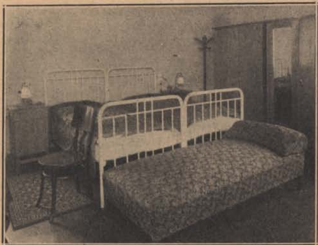
A balatonfüredi csendőrségi gyógyház: Kétágyas szoba.