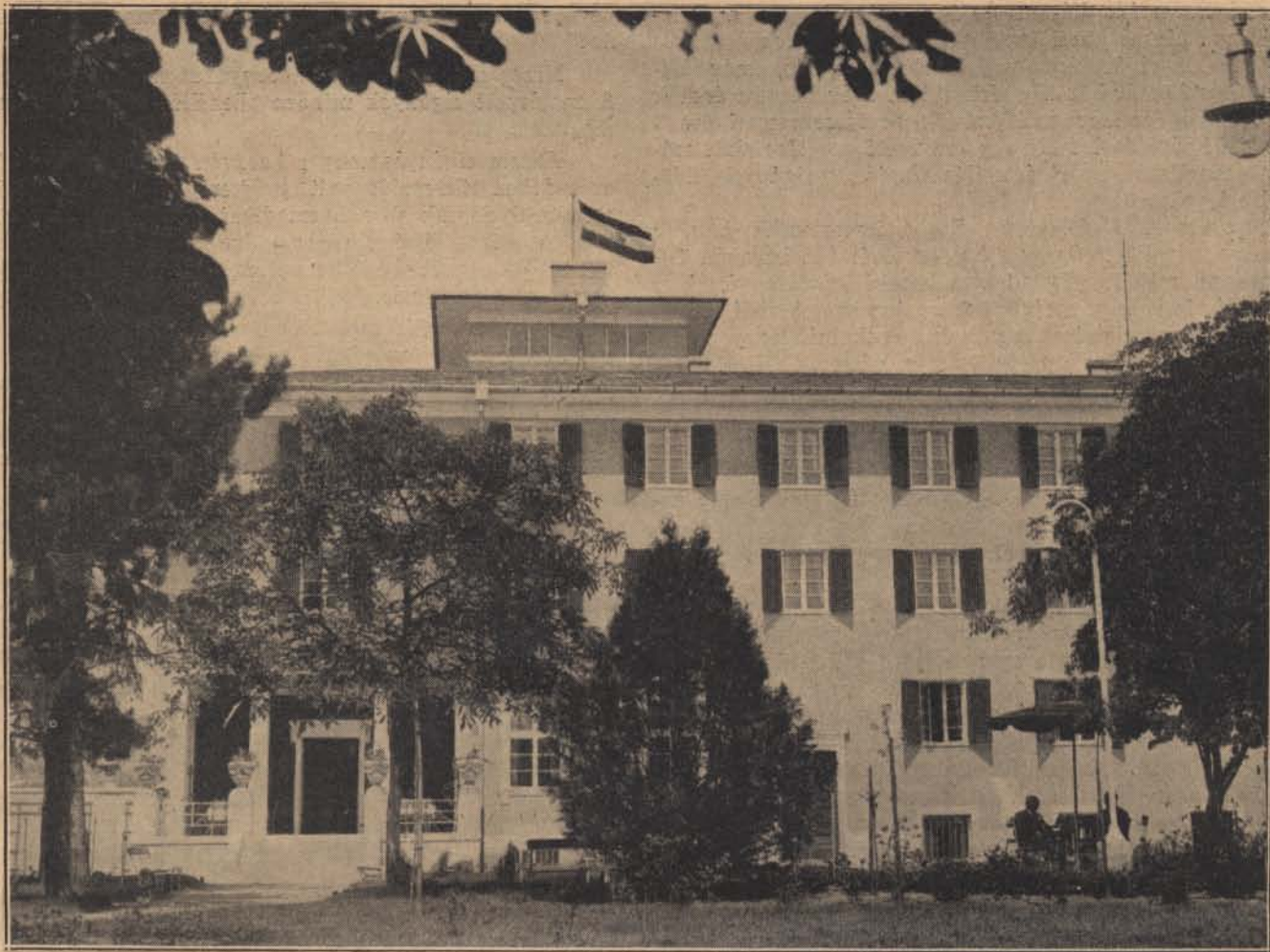
A batonföldi csendőrségi gyógyház: Főhomlokzat.