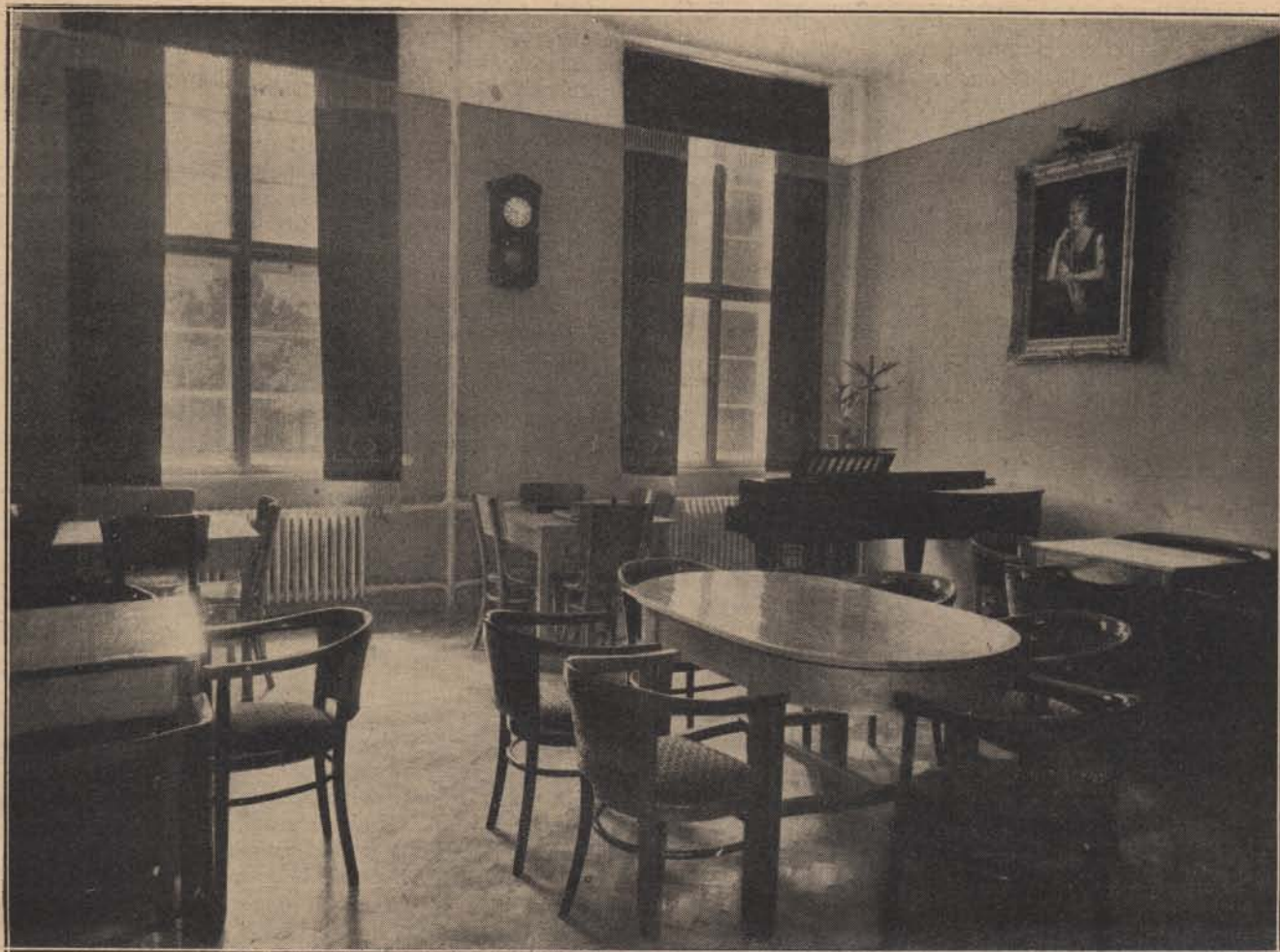
A balatonfüredi csendőrségi gyógyház: Társalgó.

nak a padláson. A bátor fiú óvatosan felmászott a létrán, betekintett a padlásba és meglátta, hogy közel az ajtóhoz a szénában három torzonborz cigány nagy hortyogva alussza az „igazak” álmát. A béres hagyta őket tovább nyugodtan aludni és óvatosan visszamászott a létrán.