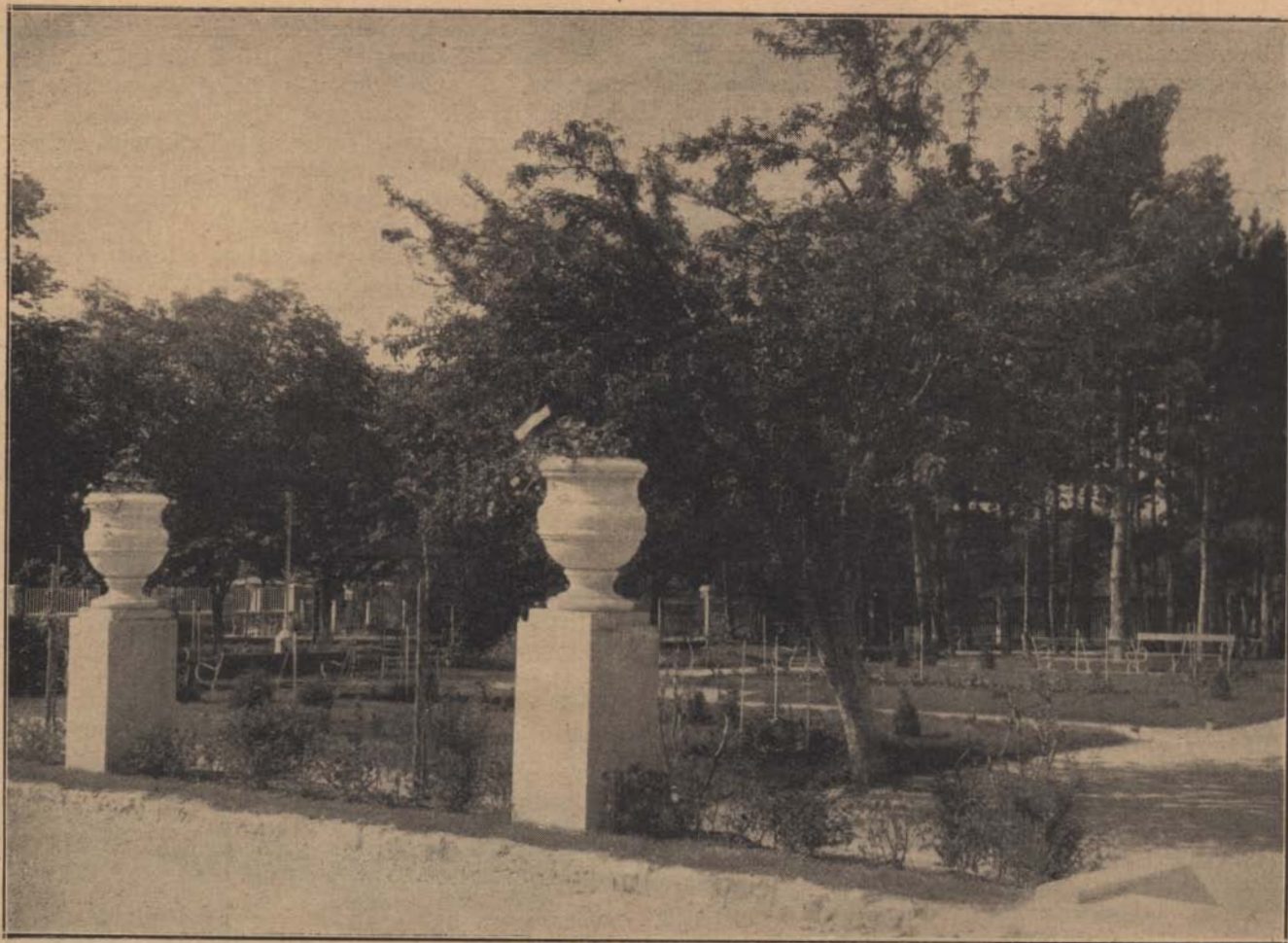
A balatonfüredi csendőrségi gyógyház: Parkrészlet.

Battonyára érkezés után Hambach őrmester azonnal intézkedett, hogy az elfogott cigányok orvosilag megvizsgáltassanak, a sebesültek pedig kezelés alá vétessenek. Itt azután kiderült, hogy egyik-másik cigányférfiún és nőn olyan sérülések is vannak, amelyeket nem a csendőrök golyói okoztak. Ezeket a sérüléseket a cigányok a Béla-majorban lefolyt harcban szerezték.