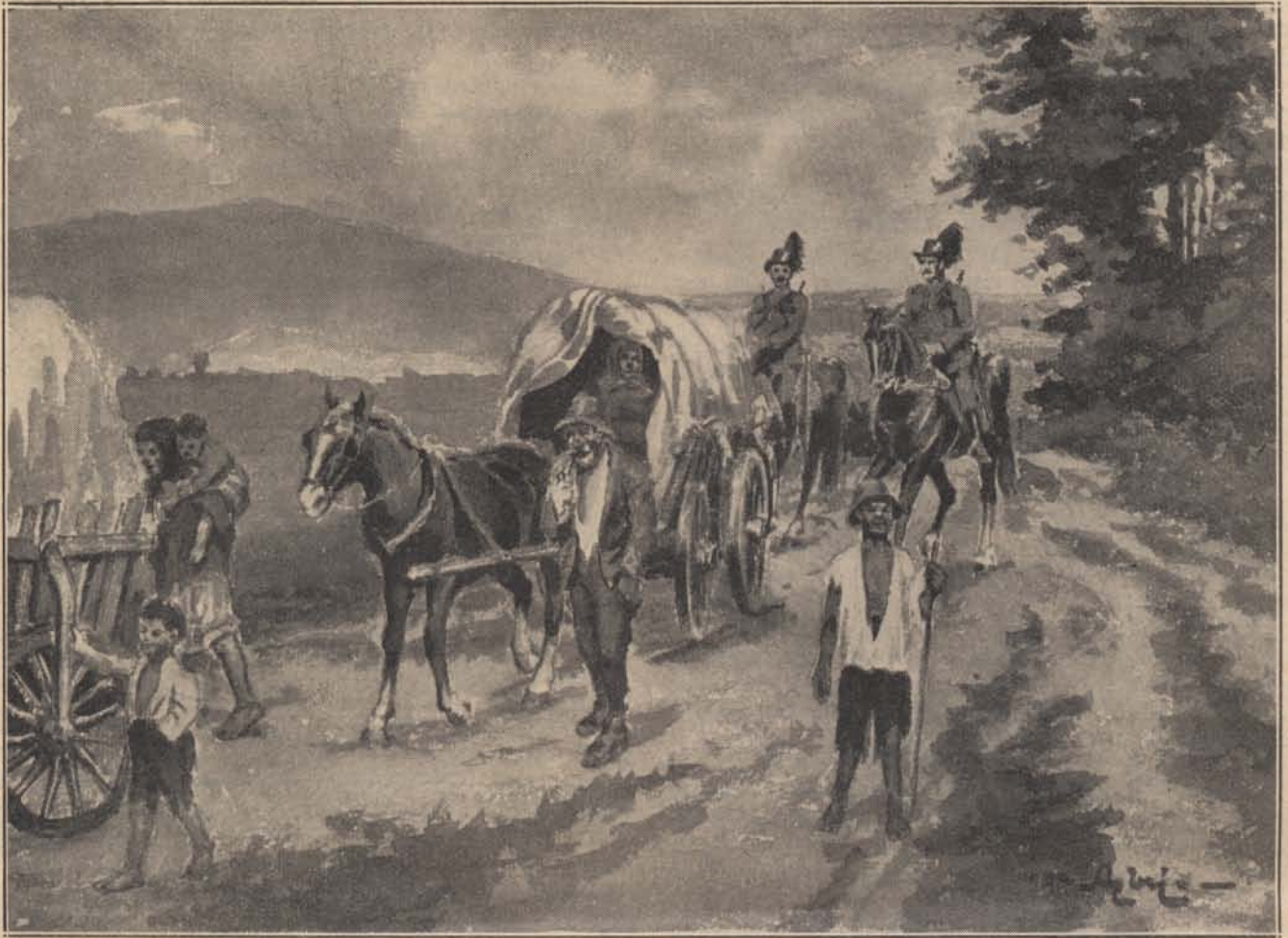
Az örök ellenfelek. (Azbej Imre tusrajza.)

áttették az érdekelt törvényhatóságokhoz, azzal az instanciával, hogy az ügyben a nyomozást ott tovább folytassák s a még szabadon futó bűnösök felett ott hozzanak ítéletet.