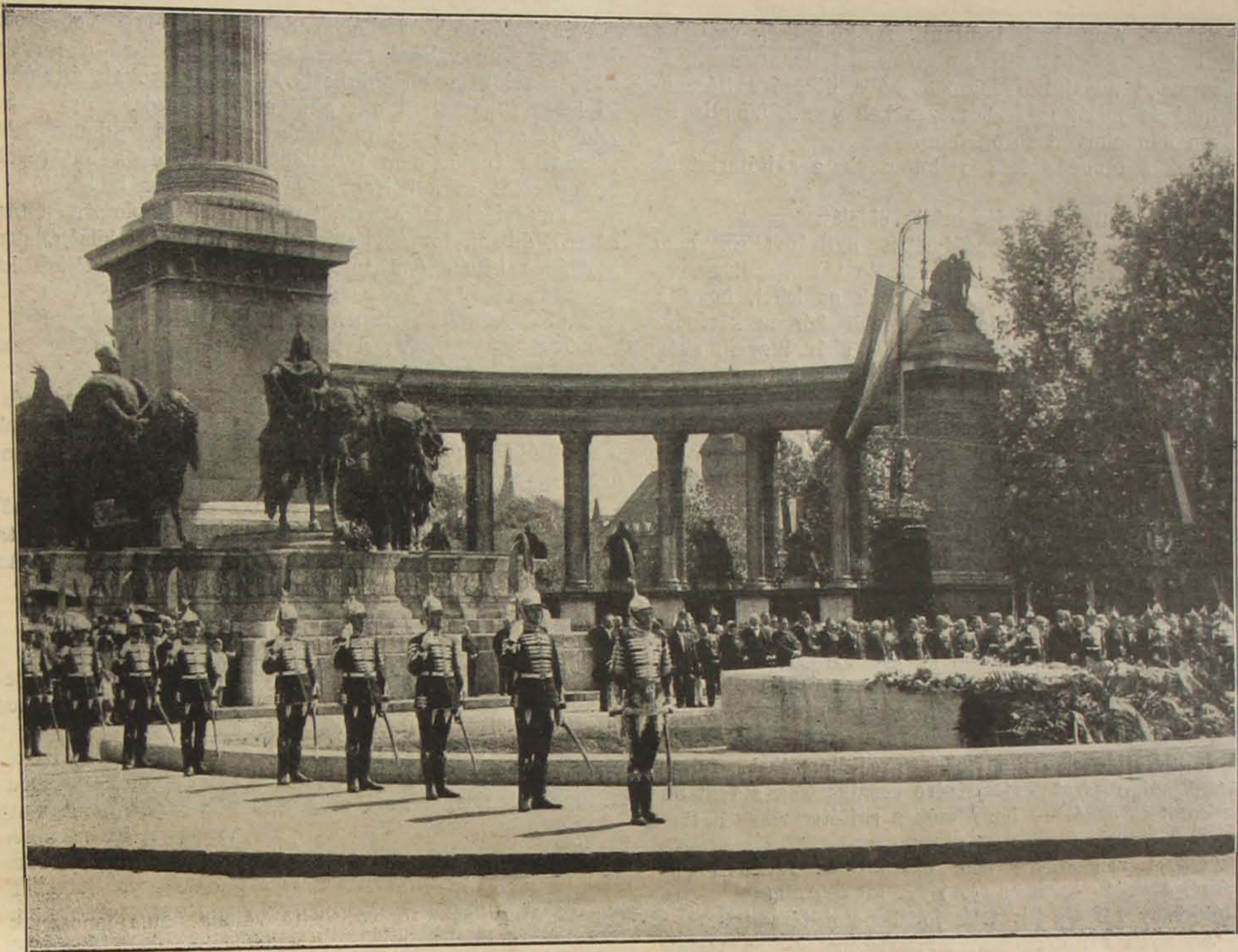
Minden év májusának utolsó vasárnapja törvénybe iktatott ünnepnap: a hősök napja. Budapesten, a Névtelen Hős emlékkövénél ebben az évben is díszes pompával ünnepelték meg ezt a napot, de a hősöket megillető kegyelet szerte az egész országban is megnyilatkozott.

tése, ha a sajtótermék tartalma csupán a választáshoz szükséges adatokra szorítkozik, másfelől megadta a világos és félre nem érthető magyarázatát annak, hogy mik is azok a „csupán a választáshoz szükséges adatok”