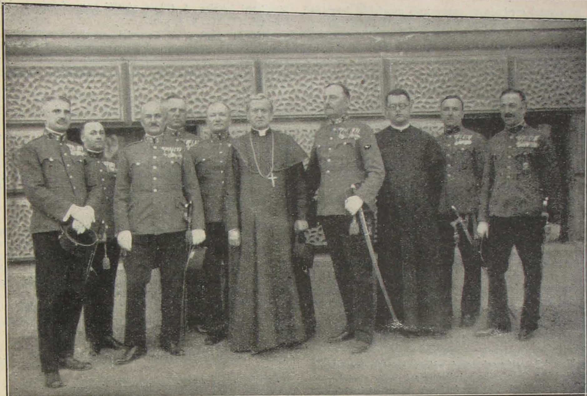
Gróf Mikes János szombathelyi megyéspüspök május 29-én meglátogatta a szombathelyi őrparancsnokképző iskolát és nyomozó alosztályt.

A végletekig tartó, szélsőségesen kiélezett előkészületeknek nyilvánvalóan nincs sok értelme. Ennek kellő lemezséklése az elsőfokú rendőrhatalóságok feladata. Úgy fog történni a most küszöbön álló választásoknál is, hogy a választás napját megelőző nyolc napon belül már nem lehet pártgyűlést tartani. Nagyon helyesen. Legalább így a választópolgárok egy kis lélekzethez juthatnak. Rendszerbe tudják szedni a velük között ellentétes politikai elveket és nyugodtan, megfontolva választhatják meg azt az irányt, amelynek a támogatását helyesnek, célszerűnek ismerik fel és követni hajlandók.