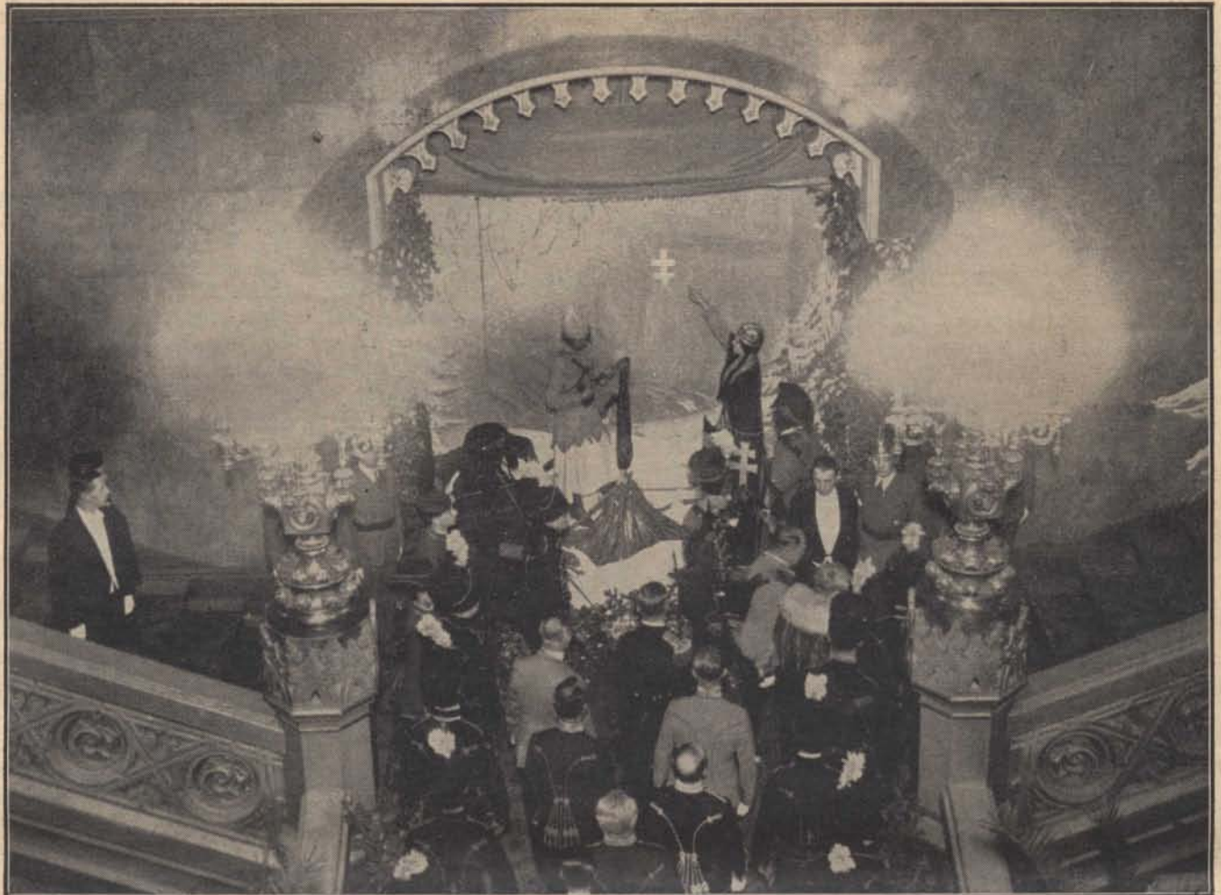
Élőkép a vitézi bálon. Hungaria közelgő feltámadásunk jelére, az újból előtűnő kettőskeresztre mutat. Kormányzó Úr Ő Főméltósága a lépcsőn megállva, nézi a képet.

és Apostoli Királyi Felsége 1910. évi augusztus hó 8-án Bad-Ischlben kelt legfőbb elhatározásával legkegyelmesebben megengedni méltóztatott, hogy az a alapítvány Ő Felsége nevééről legyen elnevezhető, alapító oklevél állíttatott ki.