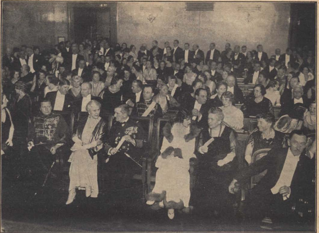
Az „A. P. A.” (All Poupł's Association) magyarországi csoportja teaestélyt rendezett a Főméltóságú Asszony nyomorenyhító akciója javára. A teaestélyen megjelentek: Kormányzó Úr Ö Főméltósága, a Főméltóságú Asszony, dr. József Ferenc kir. herceg, Anna kir. hercegnő és a budapesti diplomáciai testület összes tagjai.

erejük erre nincs, b) ilyenek nemléteben olyanok, kiknek gyermekei a közép- vagy felsőbb iskolába járnak, jó tanulók és e célra a szülők tényleg anyagi támogatásra szorulnak. Az alapítvány a m. kir. honvédelmi miniszter felügyelete alatt áll, az alapítványi segély adományozási joga a mindenkori csendőrségi felügyelőt illeti meg”.